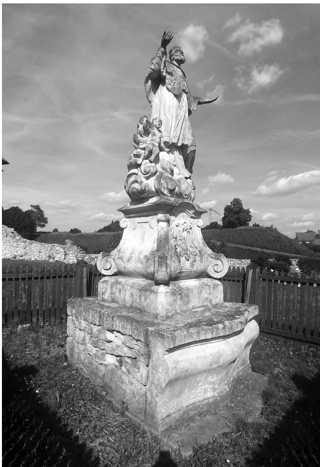
Slika 1. Sveti Ivan Nepomuk , oko 1767. Stari grad, Varaždin. (Foto: Ana Kaniški, 5. svibnja 2023.)

Skulptura stoji na dvodijelnom postolju. Njegov gornji volumen ima oblik obrnutoga kapitela koji leži na niskom kvadru približno iste širine. Kapitel na vrhu ima obrnuti vijenac i bridove u obliku obrnutih voluta. Ispred su isklesani veća kruna iznad alijansnih grbova koje obavija akant. Lijevi grb, obitelji Malatinski na štitu ima snop žita s kokotom između zvijezde i polumjeseca. Desni feldmaršala Nádasdyja ima patku koja pliva na vodi između dva rogoza. Niži kvadar istaknutih uglova i stještenih stranica leži na volumenu postolja sazidanom od kamenih ploča i veziva. Na vrhu ima ploču i kameni ulomak, sprijeda profiliran. Spomenik stoji nad nižom pločom uz tlo, ali nije istovremena.