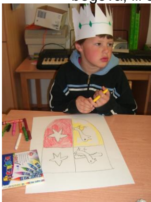
Slika 7: Izrada grbova.

To je uključivalo izume ili druge osobitosti razmatranog razdoblja, poput prvog kotača iz razdoblja stanovnika pilota ili rimskih brojeva, ili grčkih bogova, ili sastavljanja grbova ... (Slike 7, 8)