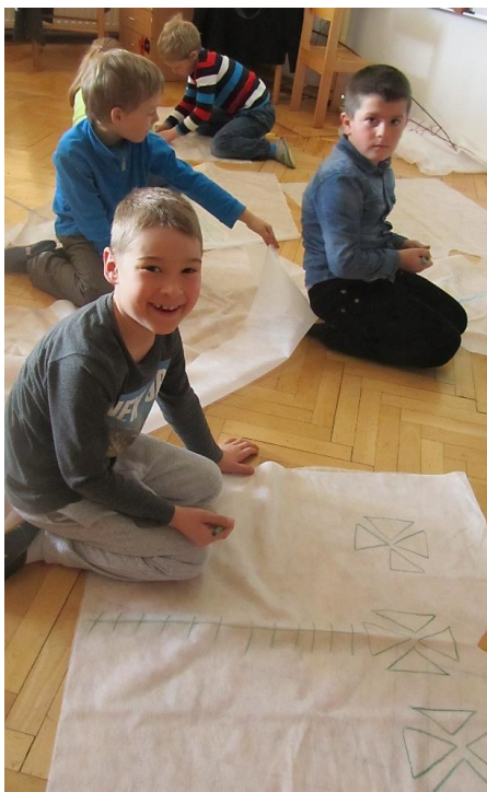
Slika 5: Izrada odjeće.