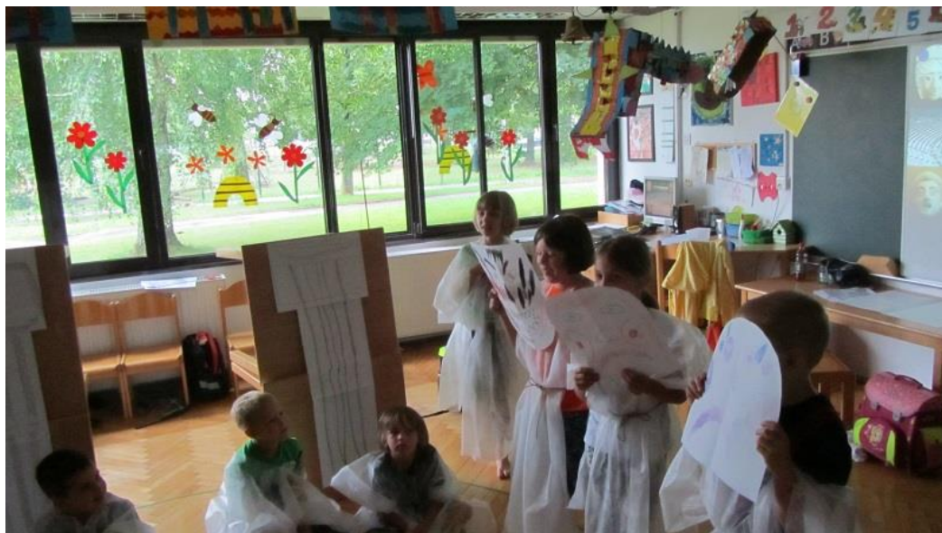
Slika 3: Akropola i kazališna predstava s maskama.