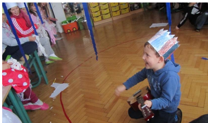
Slika 8: Trubadur slavi ljepotu odabrane djevojke.