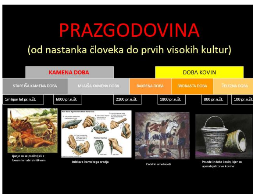
Slika 2: Kronološki prikaz razdoblja – PRAPOVIJEST.