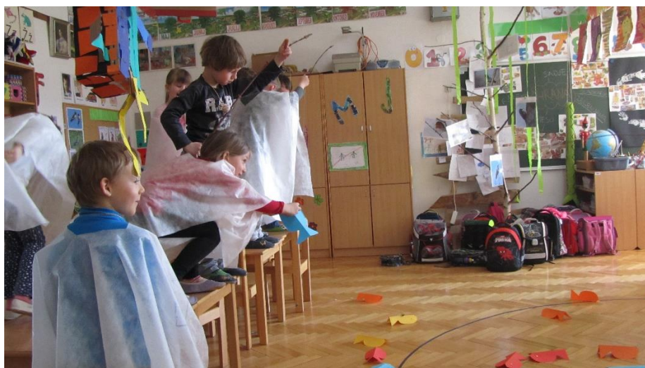
Slika 4: Kolišćarji love ribe iz svojih stanova pilota.

Učenici su se savršeno prilagodili razmatranom razdoblju, zajedno su išli u "lov", ribolov ribe, sudjelovanje na viteškim turnirima, traženje zlata...(Slika 4)