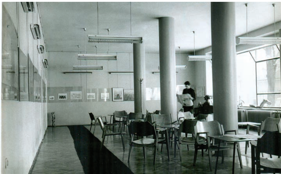
Slika 1. Galerija VN iz 1960-ih.

Slijedeći svoj entuzijazam i entuzijazam vremena, knjižnica nastoji proširiti svoje djelovanje i kulturu približiti čnomerečkim stanovnicima. U knjižničarski uključuju se izložbe slikara i kipara, predavanja, kulturne tribine. Od 1969. godine pa sljedećih dvadesetak godina u suradnji s Centrom za kulturu RANS-a „Moša Pijade“ u Galeriji VN održavaju se izuzetno zanimljive tribine „Mozaik“, kojima se aktualne teme iz umjetnosti, kulture i znanosti približavaju širem krugu građanstva. Ondje je smješten i Odjel nabave i klasifikacije, a prema Vjesniku bibliotekara Hrvatske (1971: 67–68).), u kojem je objavljen In memoriam za Miljenka Pekotu, ondje je bio i mali prostor Kluba bibliotekara Hrvatske – prostor Društva bibliotekara Hrvatske. Prema dokumentima u arhivi Knjižnice Vladimira Nazora (deplijani, katalozi...), 1966. godine započinje kontinuirano postavljanje likovnih izložbi. Isprva su likovne izložbe bile tek dekorativne. U počecima je bila značajna popularizacija naive i amaterizma, osniva se Grupa 69, no postupno se otvaraju vrata akademskim likovnim umjetnicima iz Majstorske radionice Krste Hegedušića, Vanji Radaušu, Jagodi Buić i drugima (Čabrić, 1984). 8 U mandatu ravnateljice Nade Marohnić Čitaonica Vladimira Nazora dobiva i status galerije. 9 Naime, Čabrić (2022b: 28) je ustvrdila da je krajem 1971. godine službeno osnovan Savjet Galerije. Savjet je inicirala Radna zajednica knjižnice i njegov zadatak