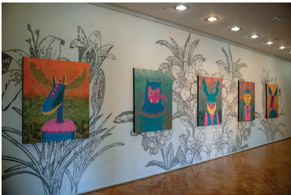
Slika 7. Marina Mesar (OKO), The Lonely Walkers , 2015.