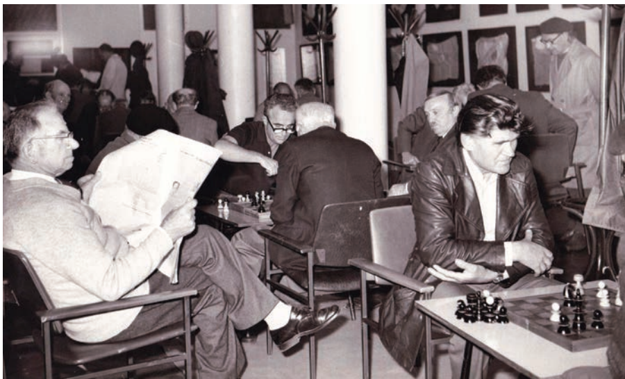
Slika 4. Galerija VN, 1978. Igrači šaha.

U tom razdoblju umjetničke izložbe bile su samo jedna od dodatnih aktivnosti kompatibilnih s primarnom čitaoničkom namjenom prostora. 13 U njoj održavane izložbe tradicionalnih medija nisu bile nametljive prema čitaoničkoj funkciji nego su s njom bile komplementarne. Takav je pristup ukazivao na shvaćanje prostora kao fleksibilnog i prilagodljivog te na potrebu da se umjetnost uključi u svakodnevni život i prostor namijenjen široj publici (slika 4). Program Galerije VN u kojem su umjetničke izložbe bile samo jedan od aspekata šireg koncepta sugerira da je galerija težila demokratizaciji umjetnosti, odnosno da je željela umjetnost učiniti pristupačnom široj publici i uključiti je u svakodnevni život. Također je vidljiv prosvjetiteljski aspekt uvođenja galerijske djelatnosti koji polazi od same gradske četvrti bez mnogo kulturnih sadržaja, a ponajmanje onih koji pripadaju vizualnoj umjetnosti. Taj je prosvjetiteljski pristup karakterističan za čitavo razdoblje osnivanja knjižnica i knjižnih stanica 1960-ih i 1970-ih godina i u skladu je s drugim knjižničnim aktivnostima u sklopu projekta „Kultura radnicima“ poput posudbe knjige unutar črnomerečkih tvornica (Čabrića, 2022: 32).