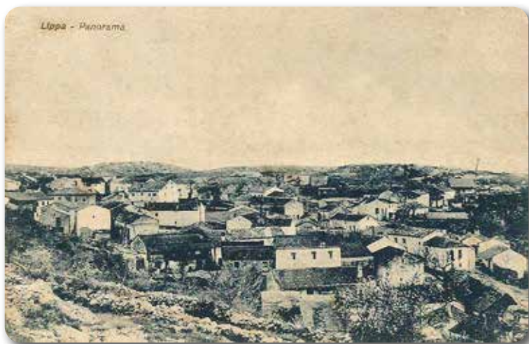
Slika 3. Razglednica Lipe s početka 20. stoljeća