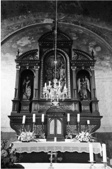
Glavni oltar župne crkve Svetog Duha u Lonji; fot. 26. 9. 2022.