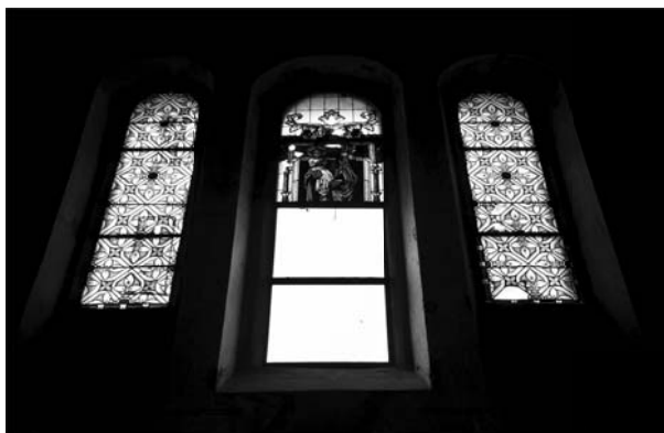
Vitraj s prikazom Svetog Josipa župne crkve u Lonji; fot. 26. 9. 2022.

svjestan vrijednosti glavnog oltara i da se on ranije nalazio u zagrebačkoj katedrali. U spomenici je još 1911. godine istaknuo o oltaru: »Ma da nije djelo osobite umjetnosti, ipak ga nisu trebali tako razkomadati, još bi mu se u našoj stolnoj crkvi, u kojoj se ionako sačuvalo malo starina, bilo mjesta.« 61 Kada je u rujnu 1915. godine odlučio nabaviti novi glavni oltar, zamolio je Zemaljsku vladu da stari premjesti u Arheološki odjel Narodnog muzeja u Zagrebu, »a na mjesto njegovo, da se novi o trošku zemlje postavi« 62 .