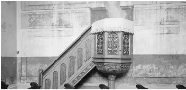
Propovjedaonica župne crkve u Lonji; fot. 26. 9. 2022.