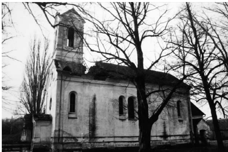
Župna crkva u Lonji nakon oštećenja u ratu 1991.; fot. Ivan Đurić, 1991.; MKM, UAKM – FKB, inv. br. 503737/1, br. neg. II-16456

Usprkos tim stradanjima lonjska župna crkva gotovo u cjelini i danas ima izgled kakav je dobila izgradnjom 1878. – 1880. godine, odnosno u unutrašnjosti intervencijama izvedenim u vrijeme župnika Kušmiševića između 1908. i 1921. godine. Svojom očuvanošću predstavlja pravi mali historicistički Gesamtkunstwerk pa pri njezinoj obnovi treba paziti da se čuvaju sve zatečene vrijednosti, odnosno da se samo rekonstruiraju ili obnove dijelovi koji su uništeni u ratu ili potresu (oslik u južnom dijelu crkve, orgulje te drveni dijelovi kora i vitraji) te da se očisti i dijelom rekonstruira oslik na mjestima na kojima je uništen atmosferilijama. 92