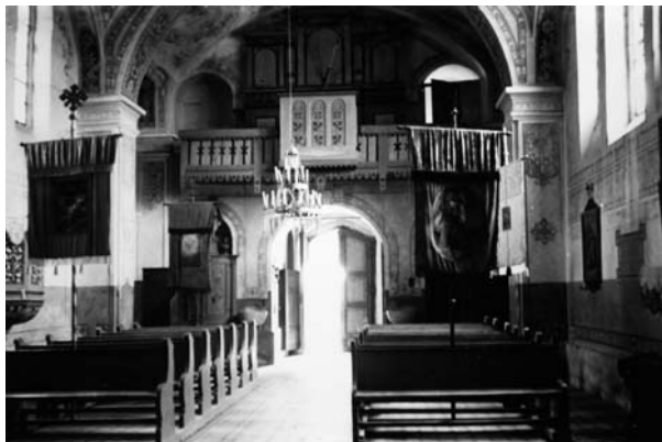
Kor s orguljama uništenima u ratu 1991. godine; fot. Nino Vranić, 1961. (MKM, UAKM – FKB, inv. br. 22945, br. neg. I-B-198)

Novi Kaplanovi oltari i danas stoje u lonjskoj župnoj crkvi. Riječ je kvalitetnim kasno-