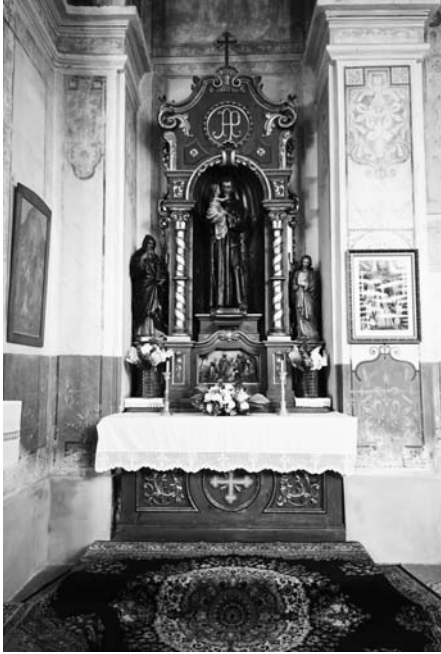
Oltar svetog Antuna Padovanskog