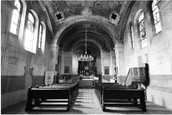
Unutrašnjost župne crkve Svetog Duha u Lonji, pogled prema svetištu; fot. 26. 9. 2022.