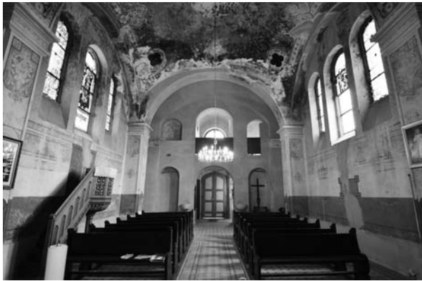
Unutrašnjost župne crkve Svetog Duha u Lonji, pogled prema koru; fot. 26. 9. 2022.

Lonjska župna crkva podignuta je u vrijeme intenzivne izgradnje novih sakralnih građevina, umjesto postojećih starijih uglavnom drvenih crkava i kapela, na području Vojne krajine. Primjetno je, naime, da u posljednjim trima desetljećima svoga postojanja krajiška uprava u Hrvatskoj (okvirno od 1850. godine do ukidanja Vojne krajine 1881. godine) poduzima veća ulaganja, kako na polju sakralne tako i javne arhitekture. Velik dio novosagrađenih crkava podignut je u takozvanom Rundbogenstil , stilu obloga luka, kojemu, kako mu samo ime govori, osnovni element predstavlja korištenje obloga