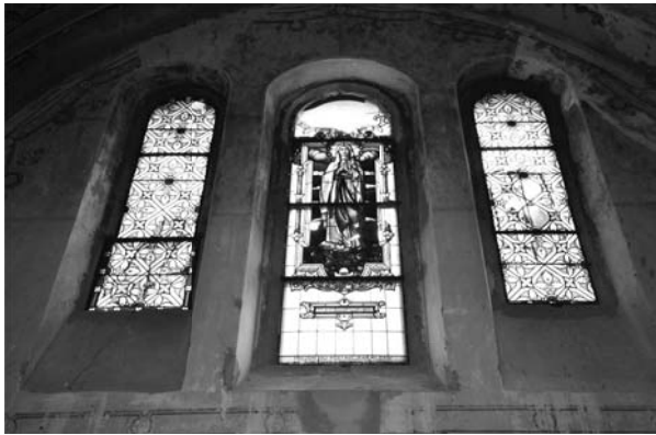
Vitraj s prikazom Majke Božje Lurdske župne crkve u Lonji; fot. 26. 9. 2022.