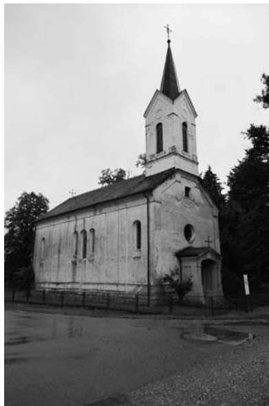
Župna crkva Svetog Duha u Lonji; fot. 26. 9. 2022.

Župna crkva Duha Svetoga u selu Lonji na Savi, smještenom na putu koji povezuje Sisak s Jasenovcem, danas u sastavu Požeške biskupije, vrijedan je spomenik umjetnosti historicizma u Hrvatskoj, kako u smislu arhitektonskoga rješenja, tako i opreme. Istodobno je riječ o građevini vrlo zanimljive kulturne povijesti s obzirom na okolnost da se u njoj desetljećima čuvao vrijedan oltar svetog Ladislava te dijelovi