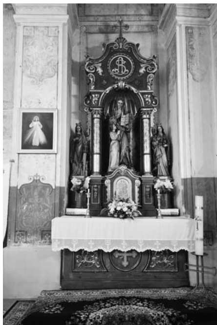
Oltar svete Ane

daleko većemu iznosu od onoga koji je darovao Nadbiskupski duhovni stol, opet je zapela izrada oltara pa time i premještanje središnjeg dijela staroga katedralnog oltara u Zagreb.