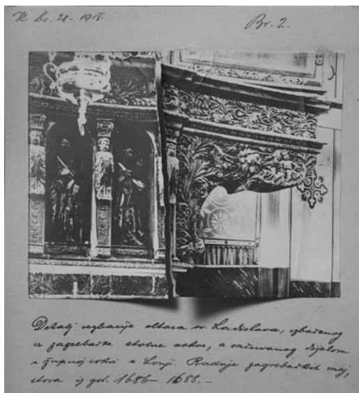
Detalj staroga glavnog oltara župne crkve u Lonji, snimljen 1915.; HR-HDA-80, BiNZV, kutija 600, opći spisi, sv. IV/329-1914.

svjestan vrijednosti glavnog oltara i da se on ranije nalazio u zagrebačkoj katedrali. U spomenici je još 1911. godine istaknuo o oltaru: »Ma da nije djelo osobite umjetnosti, ipak ga nisu trebali tako razkomadati, još bi mu se u našoj stolnoj crkvi, u kojoj se ionako sačuvalo malo starina, bilo mjesta.« 61 Kada je u rujnu 1915. godine odlučio nabaviti novi glavni oltar, zamolio je Zemaljsku vladu da stari premjesti u Arheološki odjel Narodnog muzeja u Zagrebu, »a na mjesto njegovo, da se novi o trošku zemlje postavi« 62 .