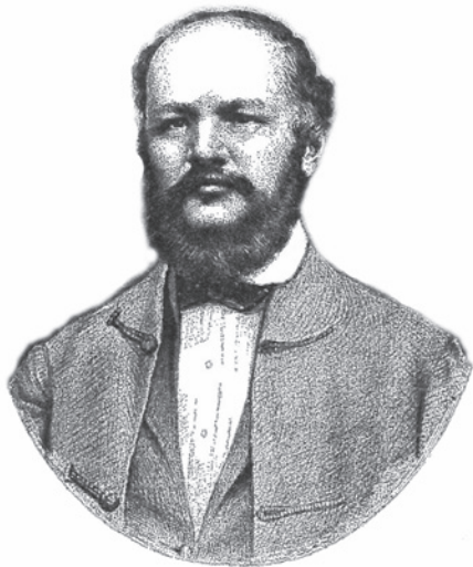
Slika 1. Portret Eduarda Halpera Sigetskog.