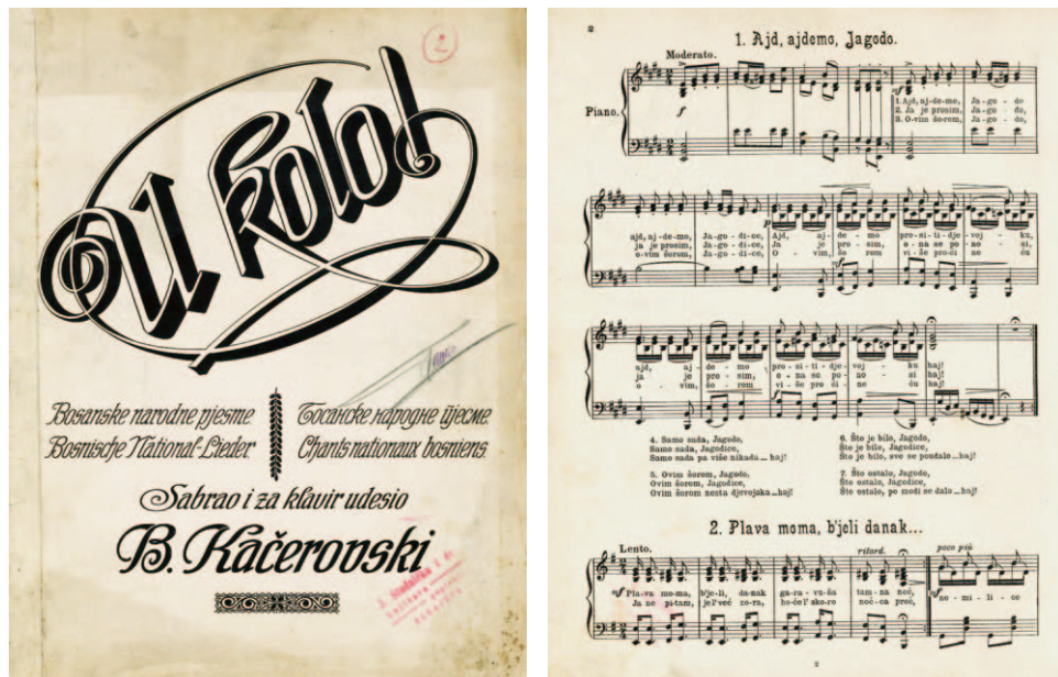
Slika 5a i 5b: Naslovnica i prva stranica partiture U kolo! Bogomira Kačerovskog.

mnim rezultatima s obzirom na to da su sve druge glazbene ustanove, uključujući i Sarajevsku filharmoniju, djelovale kao amaterska udruženja bez stalne državne subvencije, a zahvaljujući prije svega entuzijazmu kulturnih radnika. Dakle, treća faza institucionalizacije ostvarila se kroz prilagodbu, a zatim i promjenu kulturnog modela – prema propisima »nove« jugoslavenske kulturne politike – kojega su rezultati pokazatelji treće faze procesa institucionalizacije.