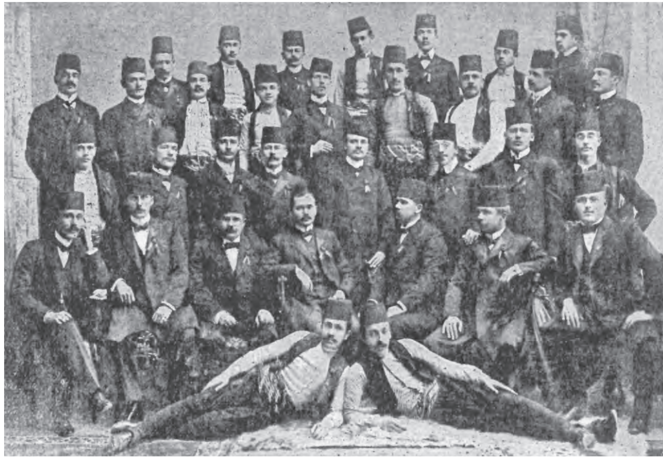
Slika 2: Gajretov hor iz 1905. godine.

svjetna društva. 41 Postupno usvajanje tekovina građanske kulture zapadnoeuropskog tipa rezultira osnivanjem prvih muslimanskih pjevačkih društava, ipak znatno kasnije nego što je slučaj s hrvatskim, srpskim i židovskim društvima. Uspješna djelatnost muslimanskih kulturno-prosvjetnih društava u Sarajevu, Gajreta i Narodne uzdanice , koja osnivaju vlastite zborske i tamburaške ansamble, potaknuto je potrebom za zabavama i drugim priredbama na kojima je glazba imala važnu ulogu. 42