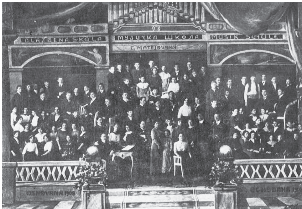
Slika 3: Glazbena škola Františka Matějovskog.

a kratko i operna primadona Bahrija Nuri Hadžić (Sarajevo, 1904 – Beograd, 1993). 43