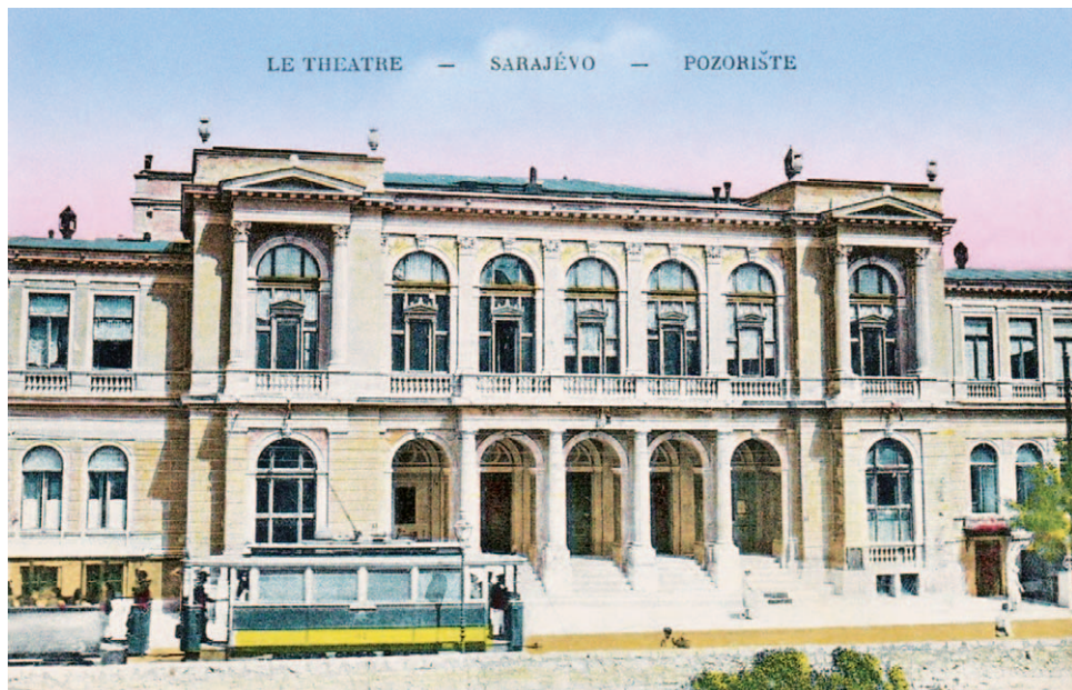
Slika 6: Narodno pozorište 1930-ih.

nog stvaralaštva putem natječaja i narudžbi za nove komade s pjevanjem u kojima je glazba domaćih autora bila obilno zastupljena. 50