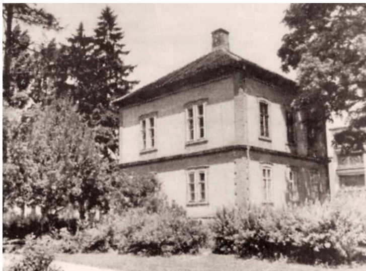
Sl. 5. »Vila Colussi«

Jagić je u istom spisu Ljubiću otkrio svoju sumnju da je na tom zemljištu smješten rimski hram ili neka druga važna građevina. 25 Povijest je te sumnje potvrdila čak stotinu godina poslije! (LOLIĆ 2001: 95-99). Ljubićev dopis koji je uslijedio kao svojevrsan odgovor u prilog Jagićevoj teoriji, od 12. srpnja 1884. godine upućuje na pronalazak golemih zidova u sada Colussijevoj bašći. Ljubić je bio pozvan u Sisak da to vidi. Ondašnji stručnjaci slutili su ili neku veliku građevinu, ili moguće rimski bedem. 26