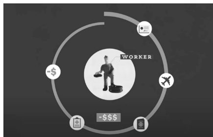
Kadar 1. Proces koji radnici prolaze kako bi dobili ugovor o radu (Vox, 2022: 4:49).

U reportaži DW-a iskazano je da radnici ustvari rade preko nekoliko kooperanata (engl. subcontractors) što otežava praćenje lanca odgovornosti (DW Documentary, 2022: 4:46-4:51). Katarski kooperanti obično su tvrtke ili pojedinci koje angažira primarni izvođač za obavljanje određenih zadataka ili pružanje specijaliziranih usluga na građevinskom ili drugoj vrsti projekta. Kooperanti su uključeni u različite faze projekta, uključujući projektiranje, izgradnju, instalaciju i održavanje. Stoga, uzevši u obzir sve aktere unutar ovakvog sustava zapošljavanja, se može reći da je posrijedi transnacionalna mreža izrabljivanja. U kontekstu loših uvjeta u kojima migrantski radnici rade i žive tijekom boravka u Kataru, u javnosti su se počele pojavljivati informacije o smrti radnika. Iako je Katar pokušao, te i dalje pokušava, zatajiti takve podatke, mnoge međunarodne udruge i organizacije za zaštitu ljudskih prava, prava radnika i migranata apelirale su na činjenicu da je broj preminulih radnika u stvarnosti veći nego što Katar priznaje.