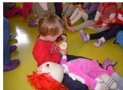
Slika 14: Peti tjedan