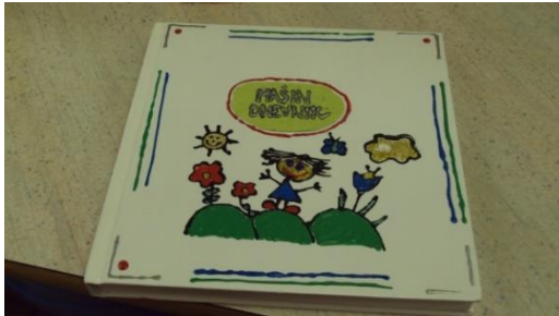
Slika 9: Mašin dnevnik