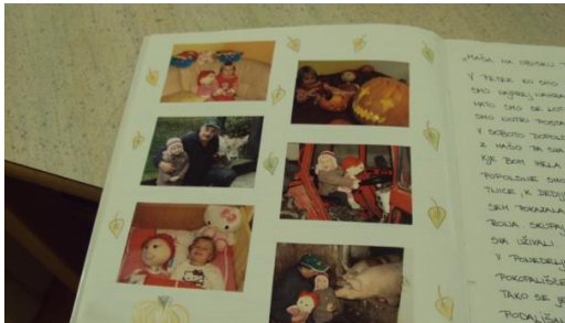
Slika 10: Mašin dnevnik