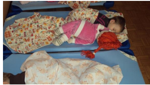
Slika 8: Treći tjedan

Maša je stvarno svestrana, pomaže svugdje, čak i kod odvikavanja od pelena. Iako ima samo dvije i pol godine, već je izašla iz pelena pa potiče i ostalu djecu koja još imaju pelene da joj se pridruže na kahlici. Naravno, kao i svugdje, Maša i ovdje ima jači utjecaj od mene kao učiteljice. Nemali broj djece radije ide na nošu zbog Mašino društva.