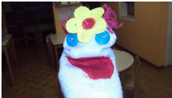
Slika 19: Lutkarske tehnike

Za treću lutkarsku tehniku koristila sam čarapu, napravila sam dvije lutke i dala ih djeci. Tada sam im rekla da svatko donese svoju čarapu od kuće kako bi i oni mogli napraviti svoju lutku. Tako su nastale lutke od čarapa. Eto, djeci nisam prije igrao nikakve igrice, nego sam im samo ponudio kazalište iz kutije i pustio ih da žele. Učinio sam to jer sam tijekom prve dvije igre shvatio da kada djeca sama igraju predstavu, uvijek postoji jedno od djece koje želi da tijek bude onakav kakav sam ja igrao i zato vodi i usmjerava djecu i dovodi ih do ovoga način ograničava izražavanje. U današnjem svijetu djeca često ne znaju kako reagirati u određenim situacijama i kako pokazati svoje emocije. Stoga je djetetu potreban način da te emocije pokaže. To mu omogućuje da se igra s lutkom. (Korošec) Posebno su tu priliku djeca dobila kod zadnjeg lutkarskog tehničara, budući da nisu imala prethodno vodstvo u lutkarskom izražavanju.