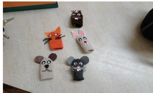
Slika 16: Lutkarske tehnike

Uz pomoć kolegice sam djeci odigrala igricu, potom su se djeca podijelila u grupe i uz pomoć mojih lutaka sama igrala igru. Zatim sam donio materijal i svatko je mogao napraviti svoju lutku za prste koja mu se najviše sviđa. Djeca su zatim igrala igru sa svojim lutkama. Jedna od djevojčica je vrlo pažljivo popunjavala tekst koji smo učiteljica i ja koristile u igrici, pa je svako dijete koje je to reklo ispravljalo na svoj način. Neki od njih samo su čekali da im kaže što da kažu, a neki se nisu dali i inzistirali su na svome. To je dobro prikazano kada dječak koji glumi medvjeda ne pušta lisicu u svoju kuću. Djevojčica mu govori što da kaže, jer kad smo se učiteljica i ja igrale na kraju, pustile smo lisicu u zabavu, samo prije nego je morala obećati da će se popraviti. Dječak, naravno, ne popušta, a djevojčica koja glumi lisicu reagira okrećući se i odlazeći.