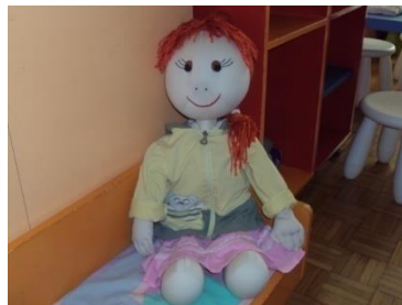
Slika 1: Lutka Maša

Kao lutku ljubimca odabrala sam lutku Mašu koju je imala moja kolegica. Djeca je nikad prije nisu vidjela. Ujutro smo sjedili u krugu, kao i obično, kad se začulo lagano kucanje na vrata. Pozvao sam ga naprijed, ali nitko nije ušao. Ustao sam i otvorio vrata. U garderobi je sjedila preplašena djevojčica.