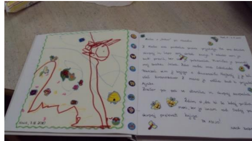
Slika 10: Mašin dnevnik