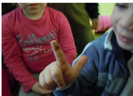
Slika 13: Peti tjedan