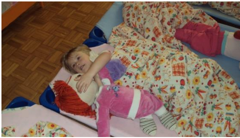
Slika 7: Treći tjedan