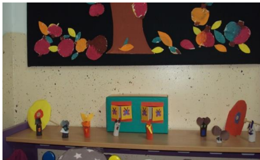
Slika 15: Lutkarske tehnike

Lutka može sve što čovjek ne može. Lutka može letjeti, boriti se, pobjeđivati zle vještice, jača je od najvećeg diva i tjera i najgore strahove koji dolaze u noći. Nevjerojatna moć koju čak i vrlo mala lutka od tkanine ili papira može učiniti. Izrađivala sam lutke i igrala se u grupi u kojoj su djeca od 4 do 5 godina. U grupi je 19 djece i svi su bili jako uzbuđeni zbog projekta lutke. Prvo sam se odlučio za igricu Pod medvjedićim kišobranom. Djeca su već znala priču. Doma sam napravio scenu i lutke za prste.