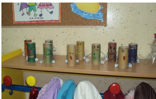
Slika 17: Lutkarske tehnike

Uz pomoć kolegice sam djeci odigrala igricu, potom su se djeca podijelila u grupe i uz pomoć mojih lutaka sama igrala igru. Zatim sam donio materijal i svatko je mogao napraviti svoju lutku za prste koja mu se najviše sviđa. Djeca su zatim igrala igru sa svojim lutkama. Jedna od djevojčica je vrlo pažljivo popunjavala tekst koji smo učiteljica i ja koristile u igrici, pa je svako dijete koje je to reklo ispravljalo na svoj način. Neki od njih samo su čekali da im kaže što da kažu, a neki se nisu dali i inzistirali su na svome. To je dobro prikazano kada dječak koji glumi medvjeda ne pušta lisicu u svoju kuću. Djevojčica mu govori što da kaže, jer kad smo se učiteljica i ja igrale na kraju, pustile smo lisicu u zabavu, samo prije nego je morala obećati da će se popraviti. Dječak, naravno, ne popušta, a djevojčica koja glumi lisicu reagira okrećući se i odlazeći.