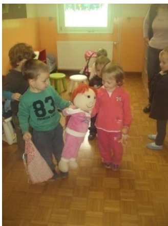
Slika 2: Prvi tjedan

PRVI TJEDAN: “Tko si ti?” upitala sam. Nježan glas mi je odgovorio: “Ja sam Maša.” I pitao: “Mogu li i ja ići s tobom u vrtić.” Pitala sam djecu što misle i naravno svi su se složili da Maša može ostati. Naš do sada uobičajeni dan pretvorio se u akciju. Iako su djeca u vrtiću tek dobrih mjesec dana i još se nisu uhodala, taj su dan postali pravi mali odgajatelji. Kako Maša nikad prije nije bila u vrtiću, naravno da su joj sve morali pokazati.