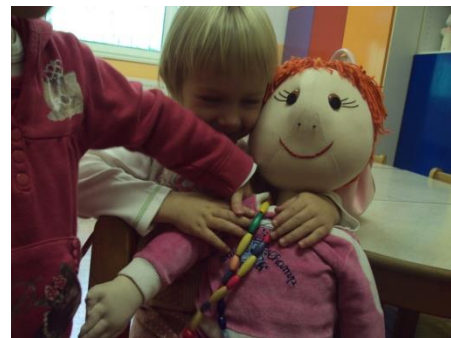
Slika 6: Drugi tjedan

Maša je jako dobra prijateljica, jer je jako povezala djecu. Ali ona mi je i jako dobra pomoćnica, kad neko od djece nešto pogriješi ili ne poslušaju, ja je brzo zgrabim i djeca uzmu Mašu u obzir, jer je jako vole i ne žele da bude tužna ili zla prema njima. Maša mi također pomaže kad je netko tužan jer ga zagrlj i kaže mu da i njoj nedostaju mama i tata, ali zna da se mora još malo igrati, a onda mama i tata dođu po nju. A Mašin komfor je jako bitan, tako da sam jako sretan što je imam. Odvajanje od roditelja nekoj djeci može biti velika frustracija u procesu socijalizacije. Lutka nam, međutim, uspješno pomaže da ih prevladamo. [3]