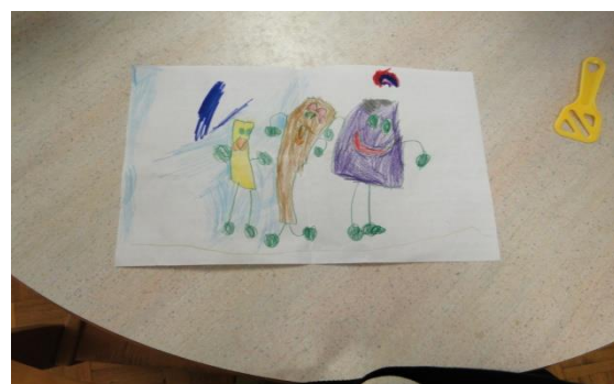
Slika 18: Lutkarske tehnike