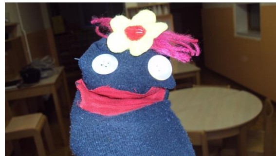
Slika 20: Lutkarske tehnike