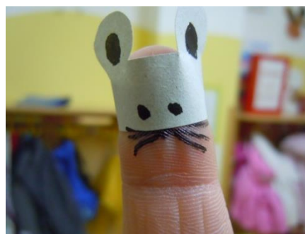
Slika 12: Peti tjedan

PETI TJEDAN: U tjednu kada nije bila na odmoru, Maša je sudjelovala u svim važnim aktivnostima u grupi tijekom cijele godine. Osim Maše, u grupi imamo i druge lutke s kojima se djeca rado igraju. Zato od početka provedbe ovog projekta posebno vodim računa da lutke i razni rekviziti za simboličnu igru uvijek budu na dohvat ruke djece. Djeci se posebno sviđaju igre s prstima u kojima sudjeluje i Maša. Često ti dođu u naručje i kažu "miš", jer miš je bila ta koja je najviše voljela kuhati kašu. Zato sam napravila mišje uši za prst jer je igra još zanimljivija ako miš stvarno skuha kašu. Naravno, i djeca su htjela miševe pa sam im ih nacrtała.