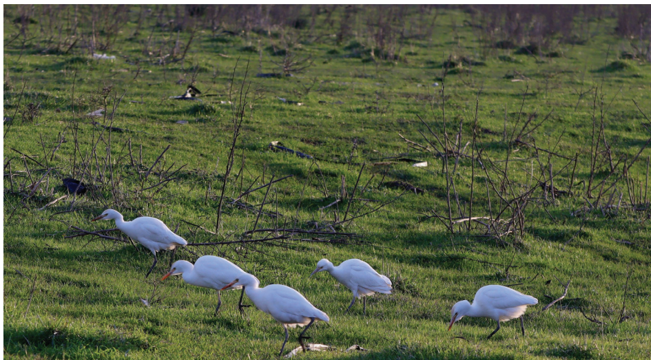
Slika 1. Čaplje govedarice Bubulcus ibis u delti Neretve. Figure 1. Cattle Egrets, Bubulcus ibis in the Neretva Delta.