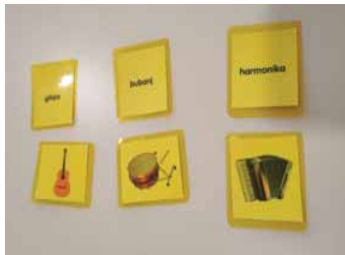
Slika 2. Kartice za imenovanje i čitanje

Ovom vježbom odgojitelji su bili ugodno iznenađeni jer su slučajno otkrili sposobnost prepoznavanja i imenovanja malih tiskanih slova dječaka L.M. (6,2 god.). L.M. ima usvojen postupak slovanja na glas te čitanja riječi.