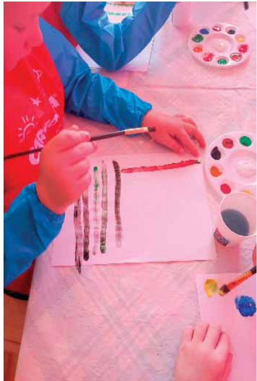
Slika 3. Montessori ples boja

Djeca sjede za stolom na kojem su pripremljeni likovni materijali odabrani prema interesu tj. želji djece. Oko pripreme likovnog materijala te radnih podloga odgojitelju su pomogle dvije djevojčice (5 i 6 god.). Također su jedni drugima pomagali pri odijevanju zaštitnih pregača za slikanje. Uz slušanje klasične glazbe djeca se izražavaju kroz slikanje. Pri tome se izmjenjuje glazba različitog ugođaja. Djeca su bila zainteresirana za slikanje. Pažljivo su rukovali likovnim materijalom te samostalno odlazili promijeniti vodu kada se zaprlja. Međusobno su razgovarali o onome što slikaju te o glazbi. Kada je bio veseli ugođaj djeca su svoje oduševljenje iskazivala kroz pokret za stolom. Nakon završene zajedničke aktivnosti pojedina djeca su i dalje imala koncentraciju i motiviranost za nastavak slikanja. Svoju kreativnost su izražavala koristeći likovni pribor ponuđen u centru likovnosti. Djeca koja nisu željela više slikati pospremila su svoje pregače. Vlažnim maramicama samostalno čiste pregače te ih slože i spremne u kutiju. Od svih provedenih aktivnosti, ova aktivnost je najduže trajala.