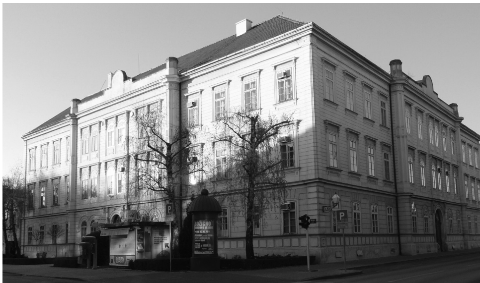
Slika 1. Izložba je postavljena na drugom katu ugaonog dijela i istočnog krila gimnazijske zgrade.

Nastojeći vremenski precizirati starost materijala podobnog za izlaganje, organizatori su već u prvom javnom pozivu na suradnju naglasili: Primit će se sve stvari, koje su starije od 60-70 godina. Dakle sve ono, što seže po prilici najkasnije do god. 1860. 23 Kako bi namaknuli novčana sredstva potrebna za pokrivanje organizacijskih troškova, uputili su molbu varaždinskoj gradskoj općini koja je za njihove potrebe odlučila osigurati početni iznos od pet tisuća kruna. 24 Velika pozornost od početka je bila posvećivana sigurnosti izložbenih sadržaja. Već u prvim obraćanjima budućim posuđivačima i izlagačima organizatori su naglašavali: Na stvari pazit će se neprestano, a u noći uvijek će u Izložbenim prostorijama noćiti jedan od odbornika, jedan vatrogasac i jedan stražar. Pred zgradom bit će isto straža. Stvari će, osim toga biti tako smještene, da se ništa ne će moći otuđiti, a sve najvrjednije stvari bit će u vitrinama i pod staklom. 25 Čuvanje i osiguravanje cjelokupnog izloženog materijala bilo je povjereno pripadnicima varaždinskog vatrogasnog društva kojima su se pridružili varaždinski gardist i i fiziliri odjeveni u svoje tradicionalne odore. 26