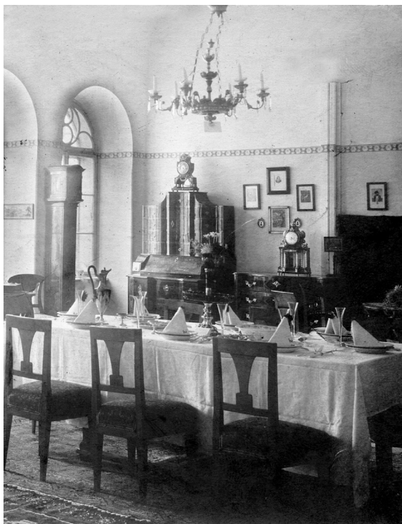
Slika 2. Fotografija jednog od interijera uređenog u sklopu Izložbe, GMV 66676

Za postavljanje Kulturno-historijske izložbe grada Varaždina bilo je odabrano osam velikih učionica smještenih u istočnom krilu te u ugaonom dijelu drugog kata gimnazijske zgrade s kojima se Gimnazija u tom periodu imala pravo koristiti. Među njima bila je nezaobilazna i gimnazijska risaona, najveća dvorana koju je Gimnazija posjedovala, pa ju je stoga i Varaždinska gimnazijska ekstenza koristila kao svoju predavaonicu. Nakon pomnog razmatranja karakteristika raspoloživog prostora, uzimajući u obzir i prirodu izložbenog materijala s kojim su raspolagali, priređivači su Izložbu nastojali organizirati po temama. Pritom su svaku izložbenu prostoriju, ovisno o mogućnostima, pokušavali urediti kao posebnu sadržajnu cjelinu.