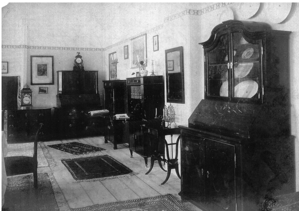
Slika 3. Fotografija jednog od interijera uređenog u sklopu Izložbe

Tako je u četvrtoj izložbenoj prostoriji bio uređen salon u stilu ampira s ormari- ma, krevetima i sekreterima. Tu su se našle garniture namještaja iz perioda baroka i rokoka, sve upotpunjeno goblenima i sagovima, te odgovarajućim lusterom i brojnim slikama na zidu. Bila je predstavljena i relativno bogata kolekcija satova raznih vrsta i stilova od kojih su neki bili opremljeni mehanizmom koji svira. 43