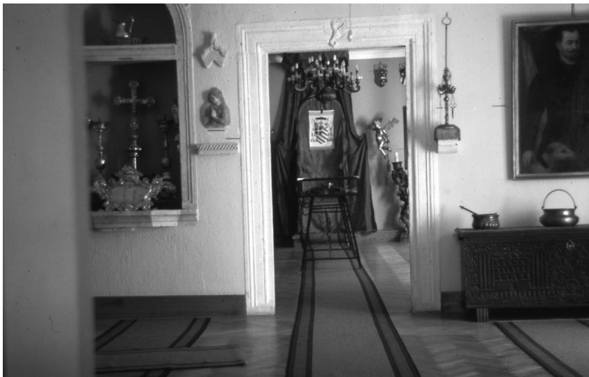
Slika 5. (3.009.) Biskupski tron u Opatskoj riznici (svibanj 1973.)