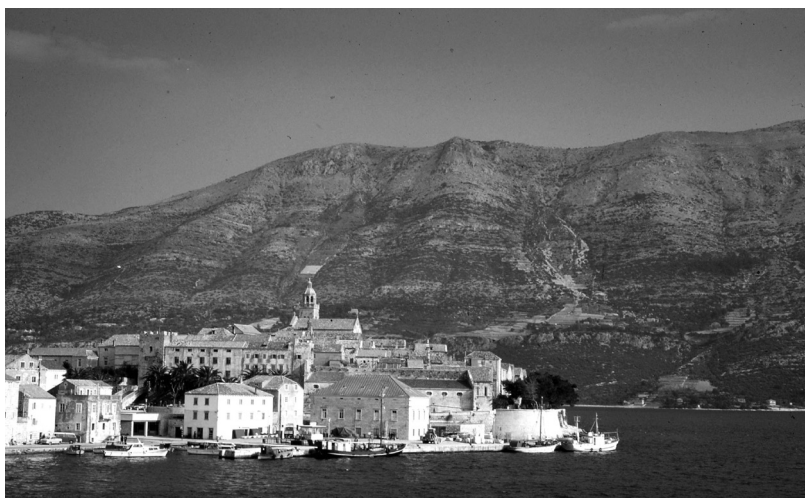
Slika 2. (1.011.) Panorama Korčule IV – grad s kućom Zovetti, jednoetažnim objektom opskrbnog centra, ribarnicom, istočnom rivom s benzinskom stanicom, zgradom DTO Partizan , skladištem Gradine uz Partizan , brodom Prišnjak (Plovput) uz istočnu rivu (prije 1973.)