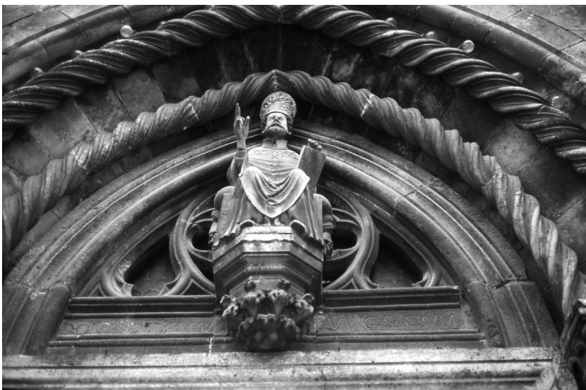
Slika 6. (5.001.) Glavni portal korčulanske katedrale s drvenom šakom sv. Marka (20. st.)