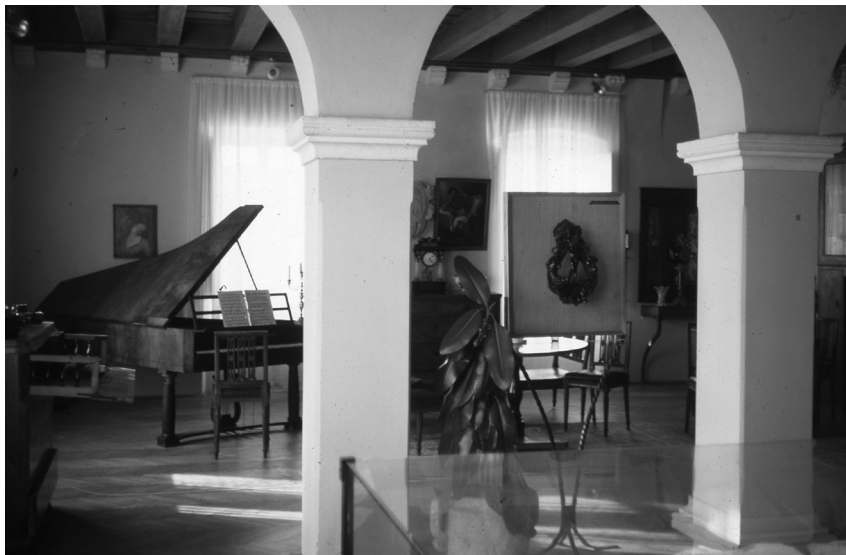
Slika 7. (6.006.) Gradski muzej Korčula – salon s klavirom (s početka 19. st.), slikom Bogorodica i sv. Ivan iz 1810. i kucalom iz palače Arneri (studenj 1978.)