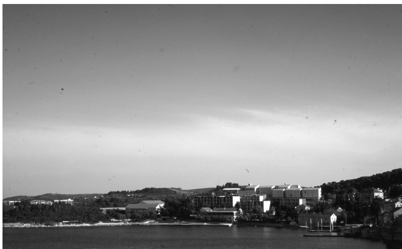
Slika 1. (1.004.) Hotelski kompleks – Pod Salatin s hotelom Marko Polo , paviljonima hotela Park , kućom Verzotti i nezatvorenim bazenom KPK (prije 1975.)