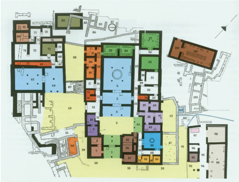
Slika 2: Višebojni tlocrt palače u Pilu (Blegen i Rawson 2001: 9)

Palača se sastoji od četiri glavna dijela: glavne zgrade, jugozapadne i sjeveroistočne zgrade i skladišta vina. Kao i drugdje, zgrade su bile od kamena u donjim dijelovima, a od čerpića i drveta u gornjim. Stupovi su bili drveni s kamenom bazom, unutrašnji zidovi bili su ožbukani, reprezentativnije prostorije imale su freske. Podovi su bili popločani, a oni u megaronu imali su ukras. Stubišta u glavnoj i jugozapadnoj zgradi ukazuju na postojanje gornjeg kata.