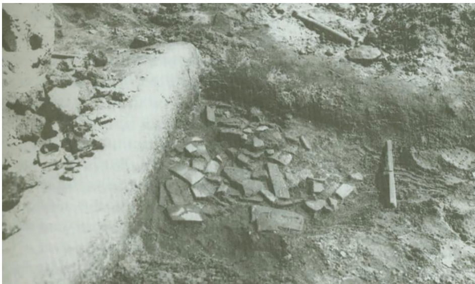
Slika 5: Arhiv linear B pločica u Pilu koje su se razbile i rasule po podu nakon što je izgorjela polica na kojoj su bile poslagane (Davis et al. 2008: 43, sl. 28)