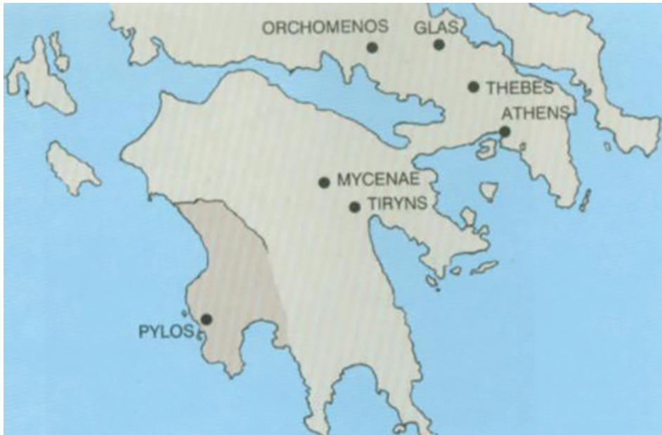
Slika 1: Plan jugozapadnoga dijela pokrajine Mesenije sa zaljevom Navarino, sjeveroistočno od kojeg je označen i položaj Nestorove palače (Davis et al. 2008: 5)

otkrivenom i najslavnijem mikenskom lokalitetu – Mikeni (za opis otkrića Mikene v. Tomas 2009). Mikenska civilizacija nije razvila neku jedinstvenu državnu cjelinu, već je bila rascjepkana u niz teritorijalnih jedinica od kojih je svakom dominirao dobro utvrđen grad (citadela) unutar koje bi se nalazila luksuzna palača iz koje je vladao mikenski kralj. Većina mikenskih citadela bila je smještena u Argolidi i Meseniji na Peloponezu, te na Atici i u Beotiji. Uz Mikenu drugi najvažniji mikenski centri bili su Tirint (v. opis u Tomas 2012), Atena, Teba i obližnji Orhomen s citadelom Gla (opisani su u Tomas 2011). Nakon što su oko 1450. g. pr. Kr. Mikenjani zauzeli otok Kretu i time priveli kraju prethodnu minojsku civilizaciju (Castleden 1990), najveća minojska palača Knos postaje središtem iz kojeg su Mikenjani upravljali otokom Kretom (otkriće Knosa opisano je u Tomas 2008). Čak je i sama Atena u prapovijesti bila mikenski centar.