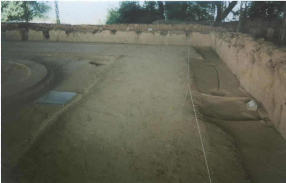
Slika 4: Baza za kraljevo prijestolje od kojeg vodi kanalić za libacijske žrtve

Iza prijestolja je impozantna freska lava i grifona koji naglašavaju moć kralja. U istočnom kutu sobe nalazila se gore opisana freska svirača lire (slika 3).