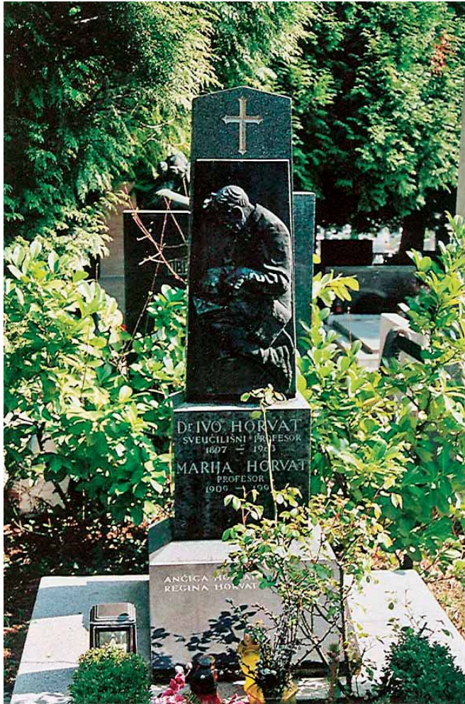
Sl. 4. Zajednički grob obitelji Horvat na zagrebačkom groblju Mirogoj