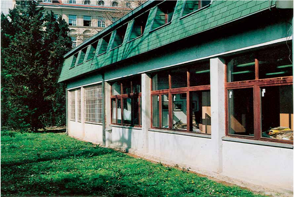
Sl. 2. Zgrada u Botaničkom vrtu u čijem prizemlju je smješten Herbarij

Fig. 2. The house in the Botanical Garden; the Herbarium is situated on the ground floor