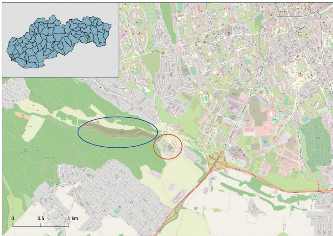
Sl. 2. Luník IX (crveno) na rubu slovačkih Košica. Zapadno je vidljivo odlagalište otpada (plavo).