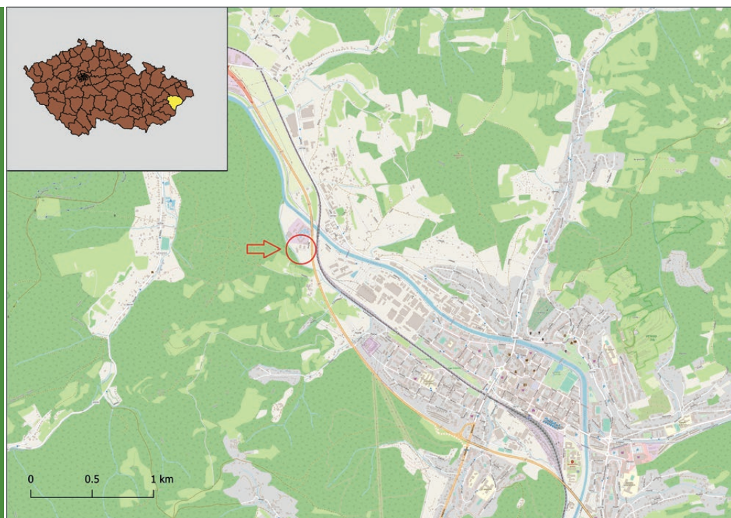
Sl. 4. Položaj romskog naselja Poschla (zaokruženo, crveno) na rubu češkog gradića Vsetína.

Usprkos nadanjima, Baršunasta revolucija 1989. i ekonomska tranzicija 1990-ih nisu donijele pozitivne promjene po čehoslovačke Rome. Upravo suprotno, njihov se status dodatno pogoršao. Stara su geta (poput Chanova i Lunika) nastavila postojati, uz daljnje srozavanje životnog standarda njihovih stanovnika (Guy, 1998). U Chanovu tako od 1996. više nema tople vode, a stambene zgrade su prepuštene propadanju (Stejskalová, 2013). S vremenom su formirana i nova geta, često nastala istjerivanjem prezaduže-