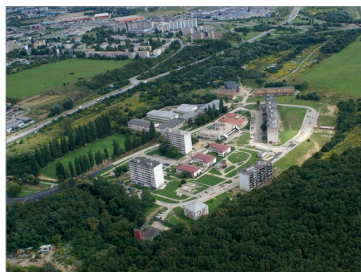
Sl. 3. Lijevo: Luník IX 2010-ih godina; desno: Luník IX nakon uređenja prilikom posjeta pape Franje, 2021.