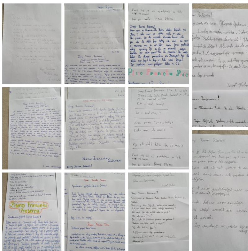
Slika 1: Pisma 6. b Francetu Prešernu

Napiši pismo našem najvećem slovenskom pjesniku. Zamislite da je pjesnik još živ, jer očekujete njegov odgovor. Postavite mu najmanje 5 pitanja, pridržavajući se načela pristojnog komuniciranja pri pisanju. Čuvajte se fikcije.