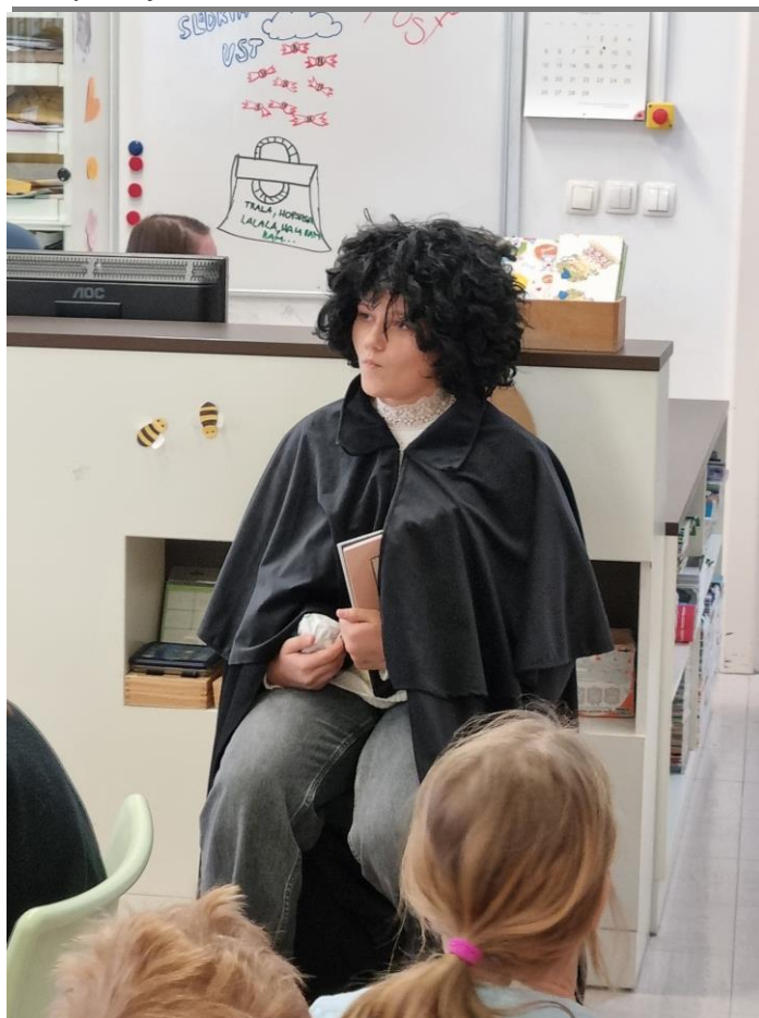
Slika 2: „France Prešeren“ odgovarja na vprašanja iz pisma v šolski knjižnici

Učenici su prvo imali pitanja kako će France Prešeren odgovoriti na ova pisma, budući da više nije živ. Postavio sam im isto pitanje i oni su sami počeli odgovarati. Odgovori su bili da će pisati iz galaksije, groba, da će pisati njegov prijatelj Matija Čop, da će mu na pismo odgovoriti živuća rodbina itd. Moj odgovor im je bio vrlo motivirajući, naime da će France Prešeren osobno posjetiti našu školsku knjižnicu i stoga neka se potrude jer on već čeka njihova pisma. Naravno, uz pomoć osmaša, France Prešeren je doista došao u školsku knjižnicu, gdje je odgovarao na njihova pitanja.