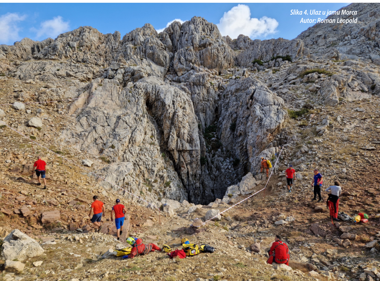
Slika 4. Ulaz u jamu Morca

proletjelo uz grijanje doza krvi i svakakvih drugih doza lijekova, brigu o Marku koji je povraćao krv, sakupljanje potrošenih igala i praznih ampula... Postavljачka ekipa vratila se s uspješno odradenog zadatka, već je bila večer, umor je zavladao bivkom, a liječnici su nakon cjelodnevnih napora uspjeli