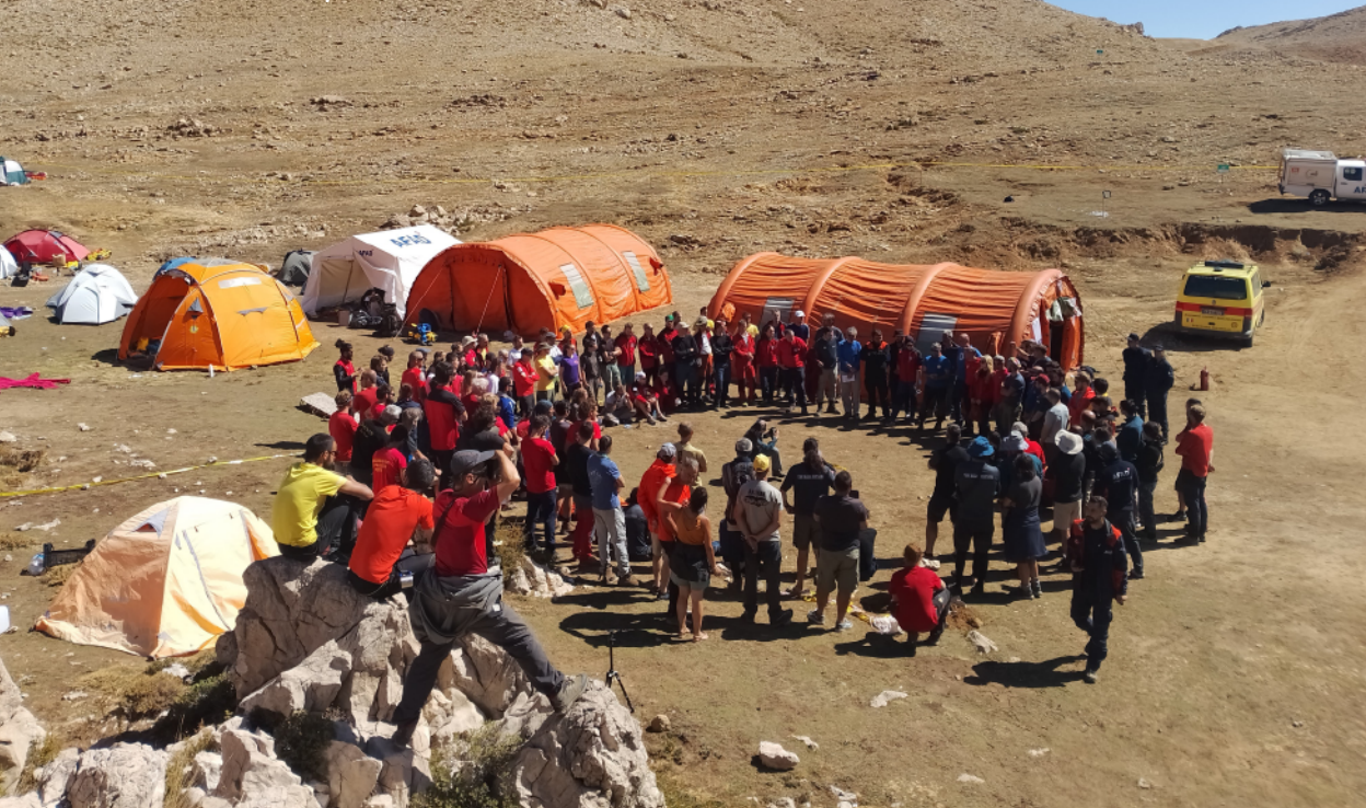
Slika 11. Završna analiza akcije izvlačenja unesrećenog Marka iz Morče Autor: Dimitri Pavlinov (Papi)