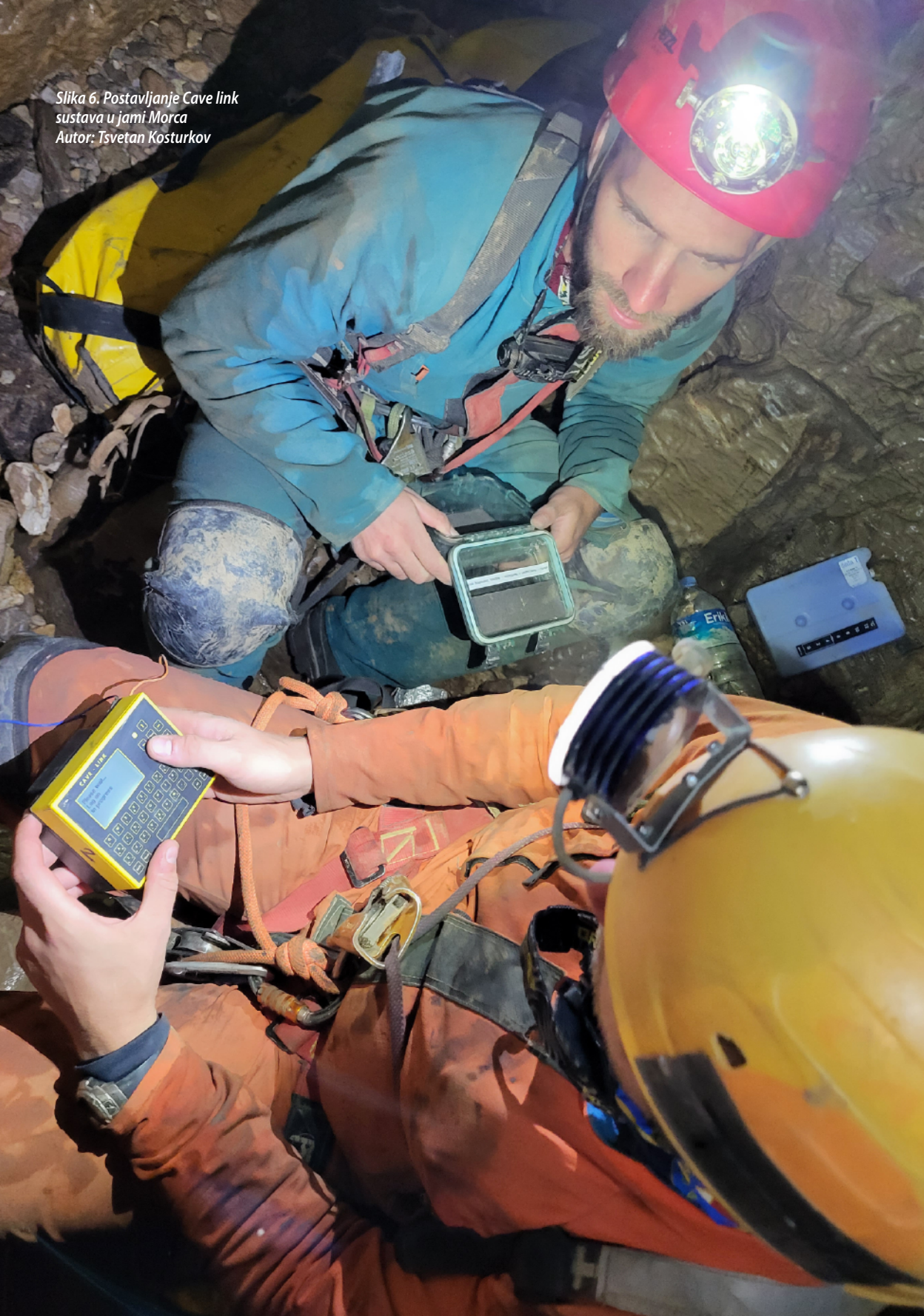
Slika 6. Postavljanje Cave link sustava u jami Morca Autor: Tsvetan Kosturkov