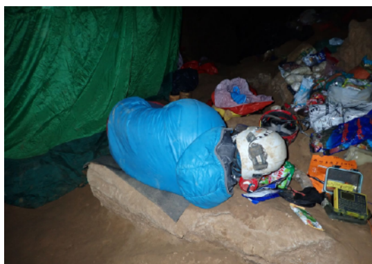
Slika 8. Spavanje u bivku na -1040 m

tu riječ. Brzo smo priskočili upomoć i podmetnuli leđa pod kamene blokove kako bi rasteretili nogu te polako izvukli manji blok pridržavajući veći kako bi Filip izvukao nogu. Kada je Filip izvukao nogu (tj. krak ), pustili smo veći blok čiji je udarac odzvonio na dnu meandra. Nasreću, noga nije bila ozlijeđena i tajac se ubrzo pretvorio u uobičajeni žamor, a transport se nastavio te smo se vrlo brzo našli u bivku na -720 m. Sreća zbog uspješno odrađenog posla i zbog toga što ništa nije pošlo po krivu bila je najveća nagrada koju smo mogli dobiti. Iscrpljeni i umorni pozdravili smo se s ekipom i vratili se nazad u bivak na -1040 m gdje smo planirali noćiti jer u bivku na -720 m nije bilo mjesta jer se tu nalazi ekipa spremna za nastavak transporta. Nakon par sati opet smo u bivku, javljamo se površini, premećemo po ostacima hrane i vrlo brzo padamo u san.