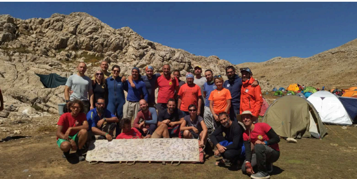
Slika 12. Ekipa spašavatelja nakon uspješne akcije