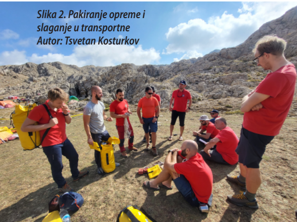
Slika 2. Pakiranje opreme i slaganje u transportne

U bivku uzbuđenje i iznenađenje našom pojavom. Na prostoru bivka nalazila su se dva velika šatora. Zeleni u kojem se nalazio unesrećeni Mark i liječnički tim koji ga je obrađivao te ljubičasti koji je služio za odmor ostalih speleologa. Desetak bugarskih spašavatelja, koji su već bili u bivku, bilo je začuđeno kako nismo ponijeli više postavljачke opreme i zabrinuto gdje ćemo se svi stisnuti u bivku jer je bivak ionako već bio pretrpan, a vreća za spavanje i bez nas nije bilo dovoljno (Slika 7). Među Bugarima bilo je i nekoliko naših starih znana: Papi (Dimitri Pavlinov) i Dančeta (Yordanka Donkova) koji zadnjih godina redovito dolaze na ljetne speleološke logore u Hrvatsku. Brzo smo se sporazumjeli i čim smo ih uvjerali da imamo sve što nam treba za bivakiranje, raspoloženje se popravilo. Nakon kratkog sna probudili smo se i počeli