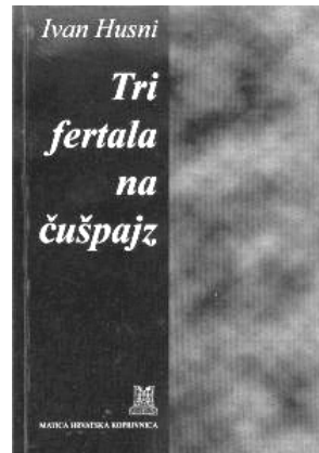
Sl. 10. Naslovnica Tri fertala na čušpajz , autorica: Draženka Jalšić Ernečić (HUSNI, Ivan: Tri fertala na čušpajz . Koprivnica: Matica hrvatska Koprivnica, 2003.).

vatske Koprivnica. Na početnoj stranici knjige nalazi se i grb Ivana Husnog, rad Marija Sačera iz Legrada, inače člana Hrvatskog društva karikaturista i suradnika Glasa Podravine. Grb je modifikacija grba grada Koprivnice s prepoznatljivom kulom i krunom, no umjesto ljljana sa svake se strane kule nalaze škare, a iznad krune je u šaci stisnuta predimenzionirana igla koja naglašava »bodljikavi« karakter kolumni.