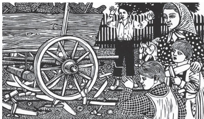
Sl. 3. Ilustracija iz zbirke priča Četiri dječaka i jedan pas , autor: Branko Vujanović (LOBOREC, Božena: Četiri dječaka i jedan pas: istinite priče . Zagreb: Mladost, 1973.).

Šest godina prije romana S one strane oblaka Božena Loborec je u Mladosti objavila zbirku priča Četiri dječaka i jedan pas . Likovni urednik, kao i u slučaju romana S one strane oblaka , bio je Irislav Meštrović, a knjiga ne odstupa od ustaljenih standarda Biblioteke Vjeverica. 15 U Mladosti je ova zbirka priča 1975. godine doživjela i drugo izdanje, a ilustrator je oba akademska slikar i grafičar Branko Vujanović 16 koji je velik dio svojeg stvaralaštva posvetio upravo opremi knjiga. On je 1989. godine naslijedio Meštrovića na mjestu likovnog urednika te se njegove ilustracije nalaze na nekima od najuspješnijih izdanja Biblioteke Vjeverica poput Grge Čvarka Ratka Zvrka,