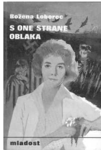
Sl. 1. Naslovnica romana S one strane oblaka , autor: Josip Vaništa (LOBOREC, Božena: S one strane oblaka . Zagreb: Mladost, 1979.).

Oba su djela objavljena u izdavačkoj kući Mladost u Zagrebu koja se ubrzo nakon osnutka sredinom 20. stoljeća prometnula u vodećeg izdavača knjiga za mlade uzraste. 3 Svoju prepoznatljivost knjižna