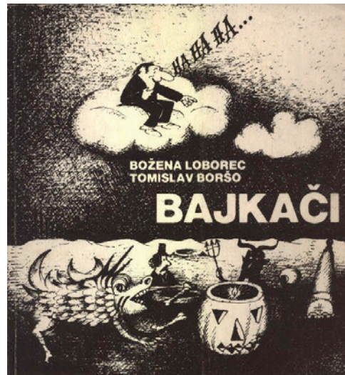
Sl. 9. Naslovnica Bajkača , autor: Tomislav Boršo (LOBOREC, Božena; BORŠO, Tomislav: Bajkači . Koprivnica: Muzej grada Koprivnice, 1984.).

Kolumne su 2003. skupljene u knjizi Tri fertala na čušpajz u izdanju Matice hr-