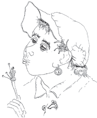
Sl. 8. Ilustracija iz zbirke pjesama Za moje blizance , autor: Ivan Večenaj (LOBOREC, Božena: Za moje blizance . Koprivnica: Centar mladih, 1995.).