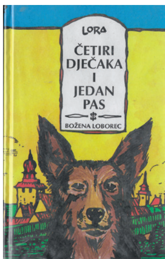
Sl. 4. Naslovnica zbirke priča Četiri dječaka i jedan pas , autorica: Draženka Jalšić (LOBOREC, Božena: Četiri dječaka i jedan pas . Koprivnica: Lora, 1994.).

Treće izdanje zbirke Četiri dječaka i jedan pas objavljeno je u Koprivnici 1994. u izdanju Lore, a autorica ilustracija je Draženka Jalšić. U razgovoru za Glas Podravine i Prigorja 1995. godine Božena Loborec istaknula je da su prva dva izdanja u nakladi od 16.000 primjeraka rasprodana, što je zasigurno bio povod odluci o novom izdanju. Osim izdavača, novost je u trećem izdanju autorska odluka o smještanju radnje u Koprivnicu te navođenje pravih imena protagonista umjesto nadimaka. 20 Za treće je izdanje Božena Loborec stoga zaključila: »Tako sam knjizi dala ono što joj je nedostajalo. Zato mi je ovo treće izdanje najmilije.« 21