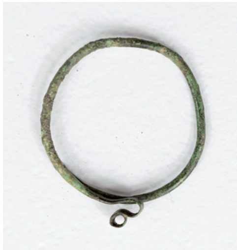
Sl. 4. Brončana karičica i brončana karičica-sljepoočničarka sa završetkom u obliku slova S

pravljene od tanje brončane žice i različitih su veličina. Slični nalazi brončanih karičica i sljepoočničarka sa S petljom, u bližoj okolini, pronađeni su na lokalitetima u Velikom Bukovcu, 11 Đurđevcu na lokalitetu Sošice, crkvi sv. Nikole u Koprivnici, Kloš-