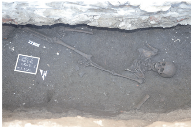
Sl. 3. Grob 6, pokojnik je pokopan u orijentaciji istok-zapad s manjim odstupanjima i uz pokojnika su pronađene brončane karičice

Nakon uklanjanja recentnog nivelirajućeg šljunka uz zapadni zid cinktora na dubini od 1,20 do 1,30 m uočena je struktura izrađena od većih i manjih kamenih blokova međusobno povezanih žučkastom žbukom, a koja prati iskop kanala od zapada prema sjeveru. S obzirom na nemogućnost daljnjeg proširivanja iskopa prema zapadu nije moguće odrediti njegovu namjenu ili vrijeme gradnje. Prema načinu gradnje i vezivu moguće je pretpostaviti da ta struktura pripada antičkom bedemu. U zapadnom dijelu cinktora pronađena su dva groba od kojih je jedan uništen. Drugi grob (Grob 1), grob djeteta, orijentiran je