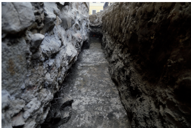
Sl. 5. Žbukana podnica uz sjeverni zid cinktora

tru Podravskom i Đelekovcu 12 te Stenjevcu. 13