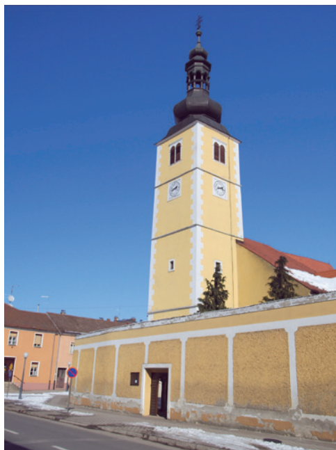
Sl. 1. Župna crkva Presvetog Trojstva u Ludbregu

sondi 16/73 s istočne strane apside crkve i kamenog trijema cinktora, na 0,20 m dubine, otkriven je masivni rimski zid za koji se pretpostavilo da se radi o bedemu, a koji je na gornjoj površini izgrađen od kamenih ploča i ulomaka opeke, povezanih žučkastom vezivom žbukom krupnog agregata. Utvrđeno je da je zid širine 1,35 m i da je na njega nasjela istočna apside crkve. 2 Sa sjeverne strane cinktora u sondi 17/73 pronađeno je mnogo dislociranih ljudskih kostiju, željeznih čavala od drvenih sanduka, ali i ranosrednjovjekovna srebrna naušnica – sljepoočničarka s nastavkom u obliku slova S i dio rimskog žbukano poda. 3 Naušnica sljepoočničarka je jednostavna, veća karika od savijene žice rastavljenih krajeva od kojih je jedan ravno odrezan, a drugi raskucan i savijen u obliku slova S. Sljepoočničarka je pripisana kottlaškoj kulturi koja traje od 9. do 11. stoljeća i isprepliće se s bjelobrdsom kultu-