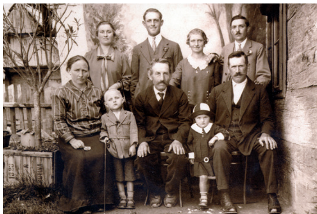
Sl. 2. Portret obitelji Krča

Kvrgićem i Bobijem Marottijem uvećao proslavu 100. obljetnice koprivničke bolnice, a 1996. godine na promociji knjige dr. Švarca »Štikleci iz stare Koprivnice« ujak je interpretirao odlomke iz knjige. Mene pak čini ponosnim što sam, na poziv dr. Švarca, imao priliku zauzeti ujakovo mjesto na promociji drugog, dopunjenog izdanja knjige »Štikleci iz stare Koprivnice« (2009.) i čitati odlomke iz ove knjige koja je trajni dokument jednog vremena, ljudi i događaja koji su obilježili tadašnju Koprivnicu i koja bi trebala biti obvezna lektira svakog Koprivničanca.