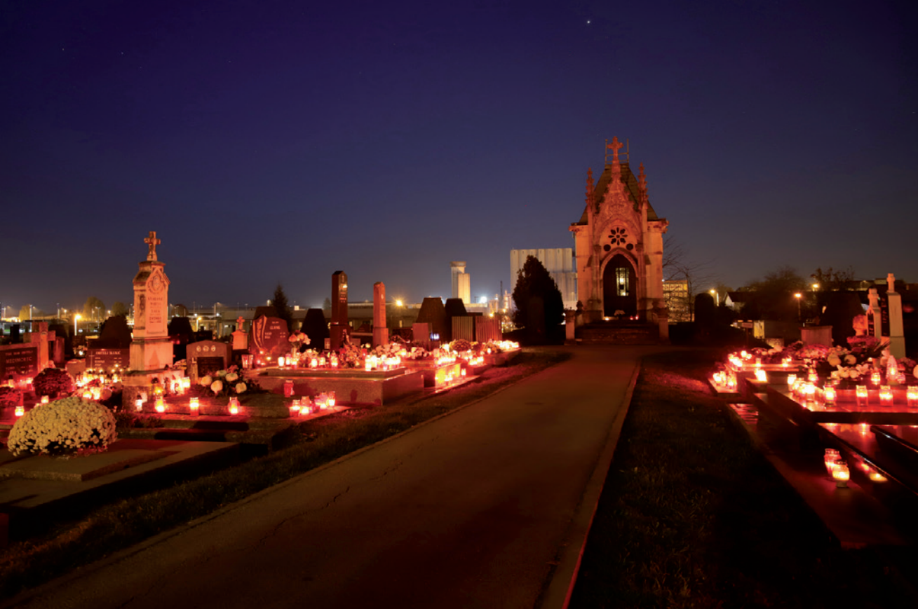
Koprivničko gradsko groblje Pri sv. Duhu u večer Svih svetih