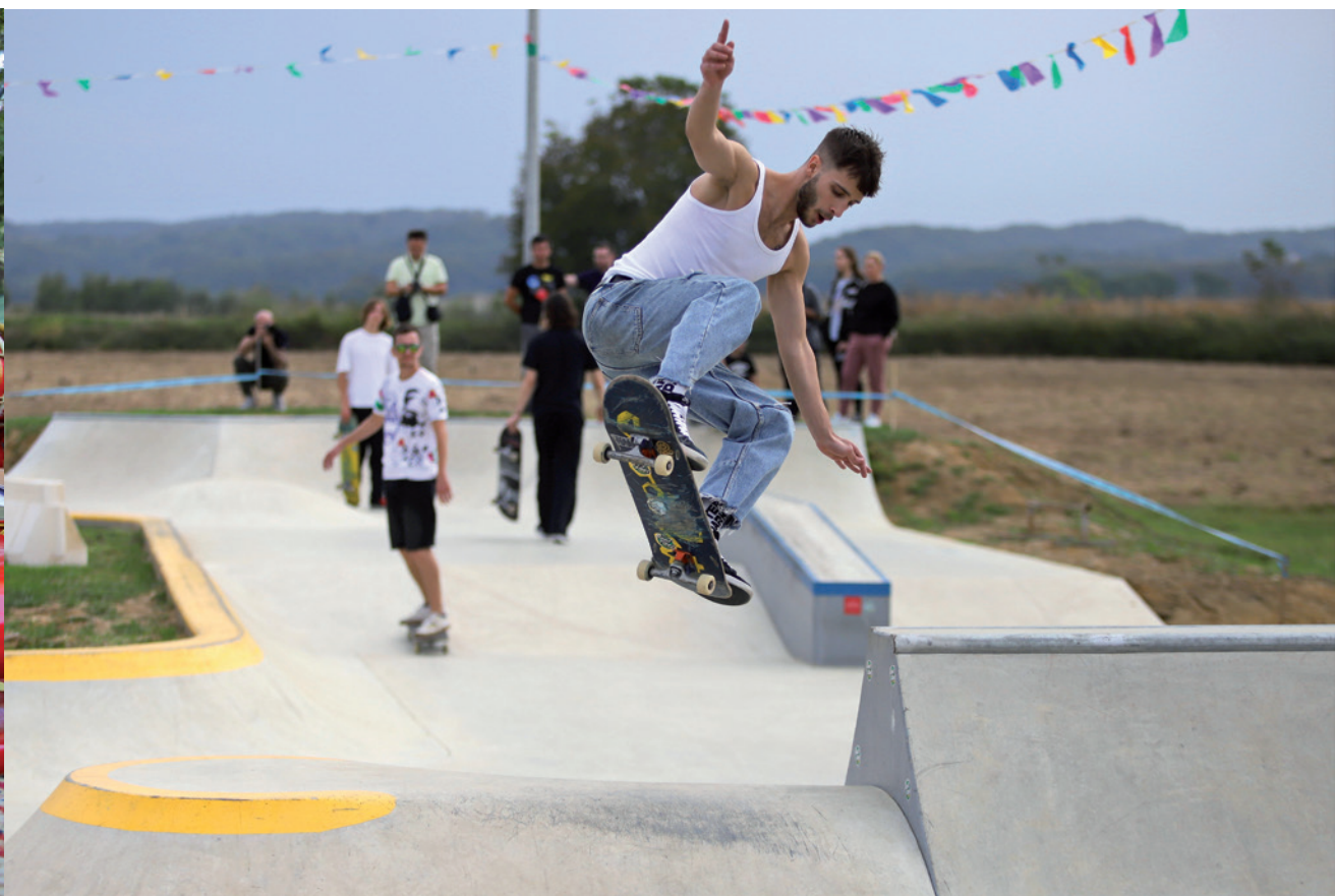
Natjecanje u novom skate parku u Koprivnici