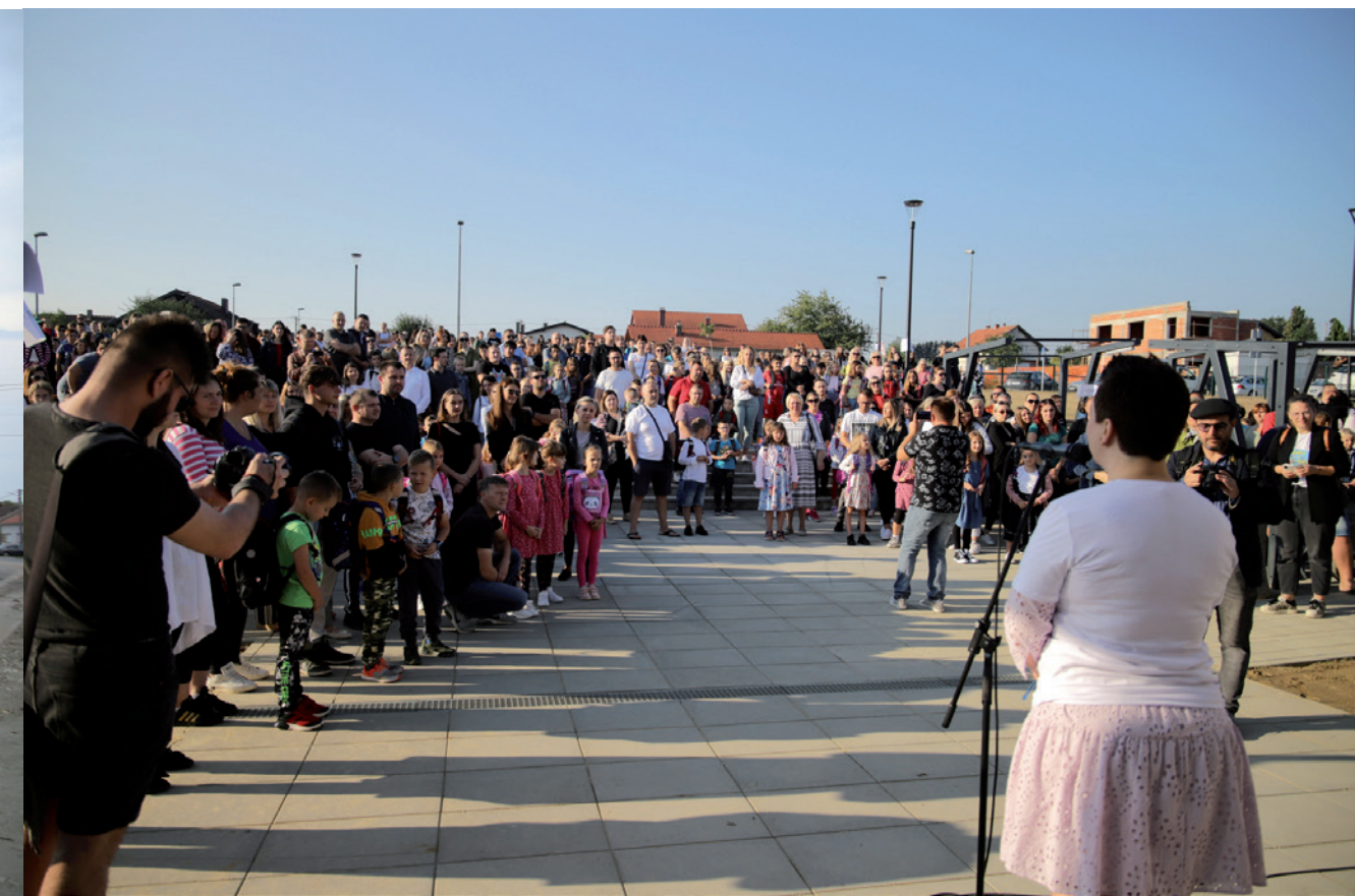
Prvi dan škole na Podlicama