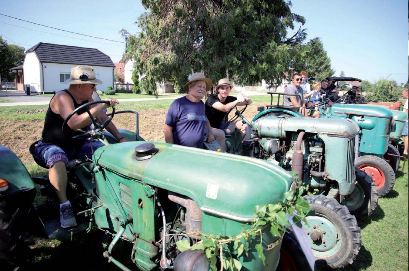
Na vatrogasnoj vježbi s traktorima u Koprivničkim Bregima