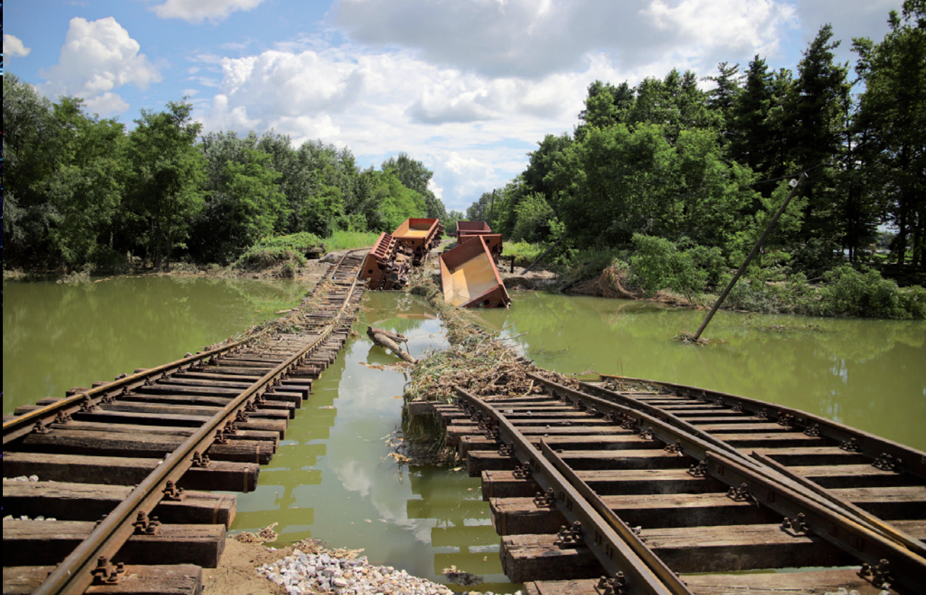
Potopljene tračnice i vagoni kod Šoderice u Botovu