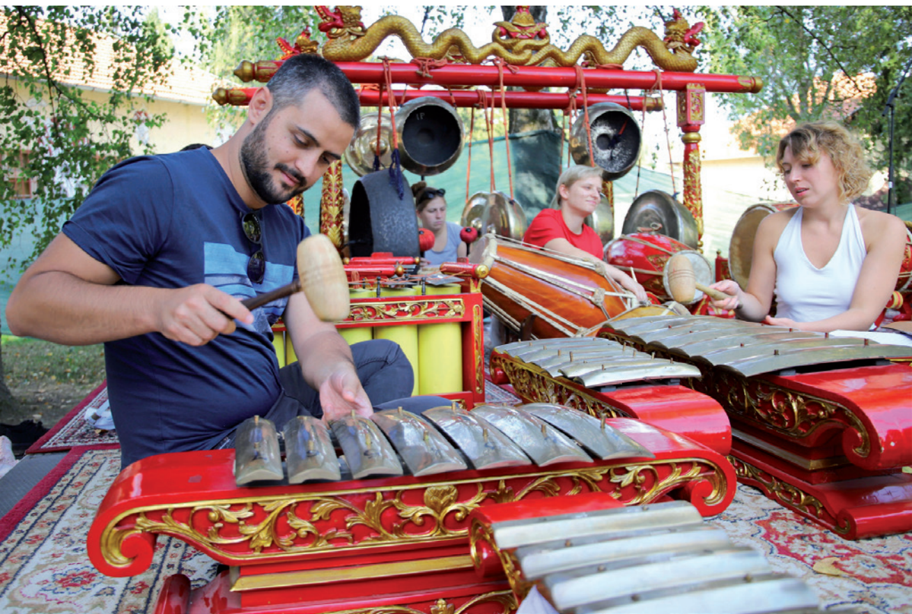
E.T.N.O. festival