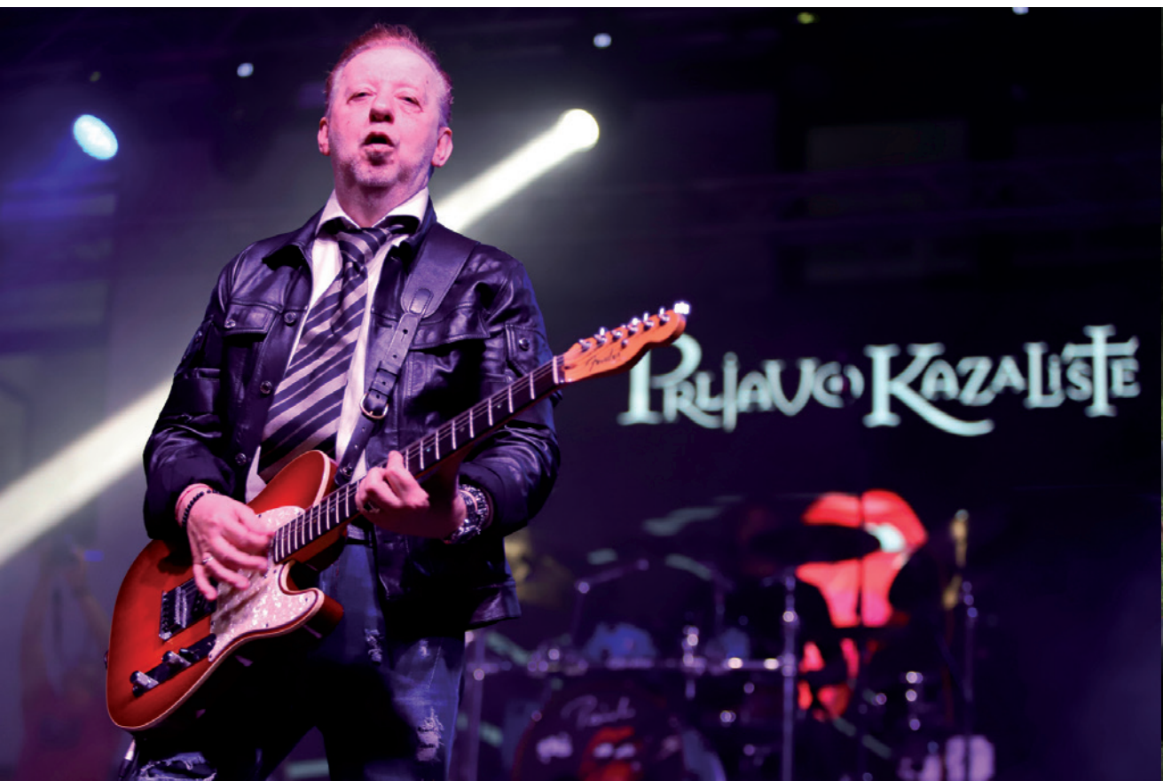
Prjavo kazalište u Đurđevcu