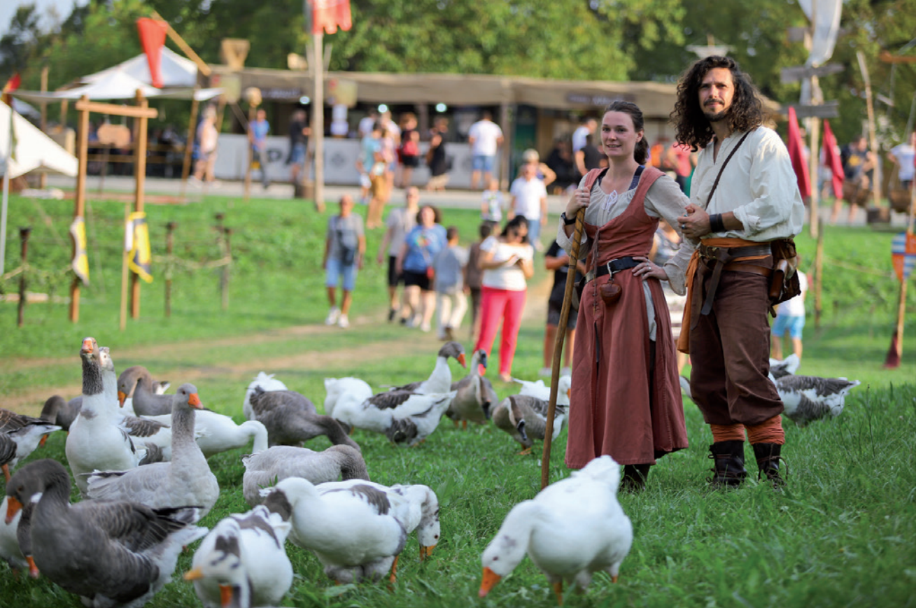
Guske su bile glavne zvijezde Renesansnog festivala 2023. godine