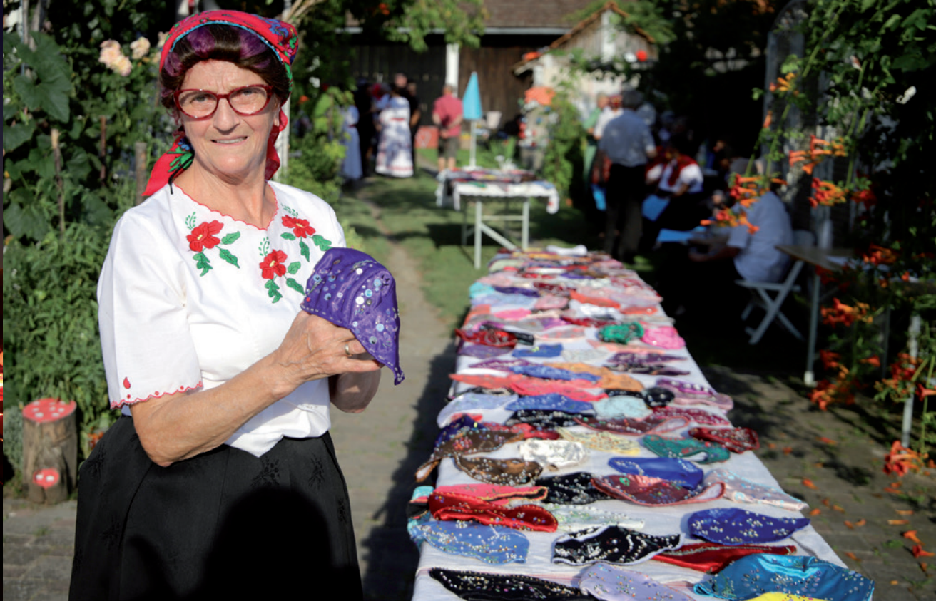
Festival poculica u Molvama