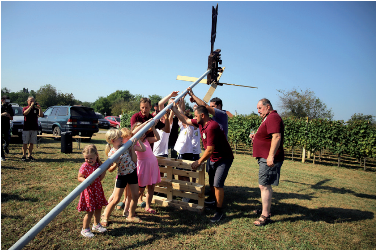
Podizanje klopoteca na Bartolovo 2023. u Novigradu Podravskom