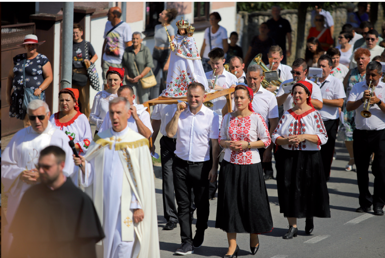
Procesija u Molvama na blagdan Velike gospe