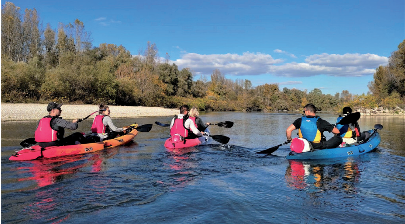
Drava i Bednja sve su popularnije za vodene sportove poput kajakarenja i vožnja kanuom, prizor kod Ludbrega