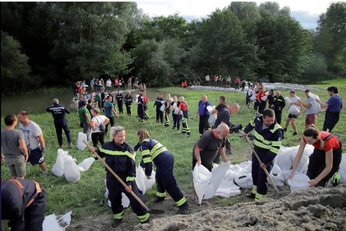
Mještani Hlebina i Gabajeve Grede brane svoja naselja od poplave podizanjem nasipa