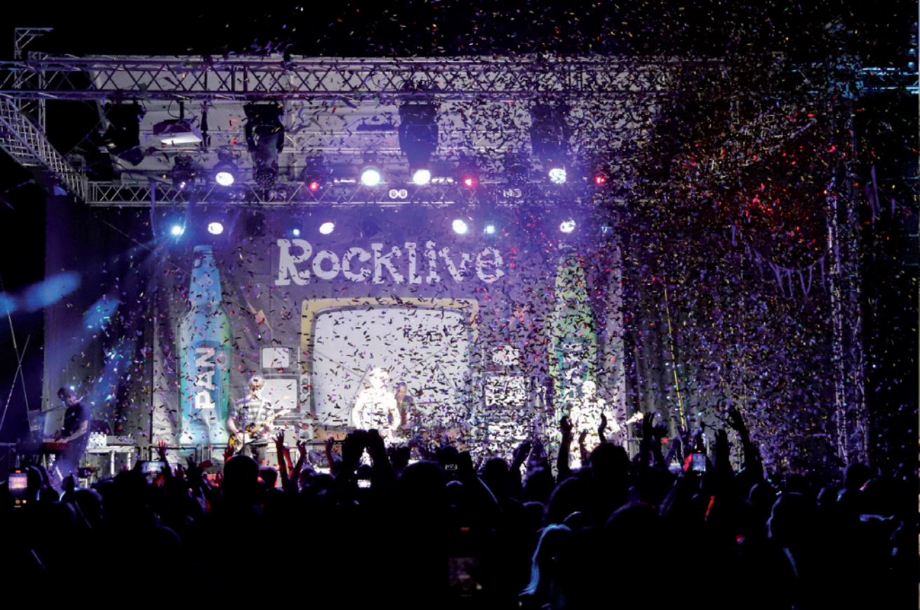
Psihomodo Pop bio kao najveće ime ovogodišnjeg festivala RockLive