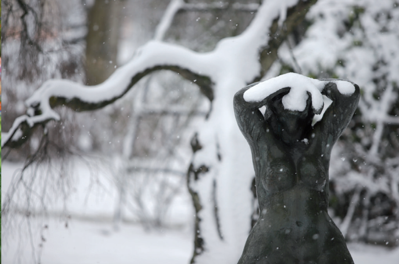
Rijetki prizori snježnih padalina posljednjih godina