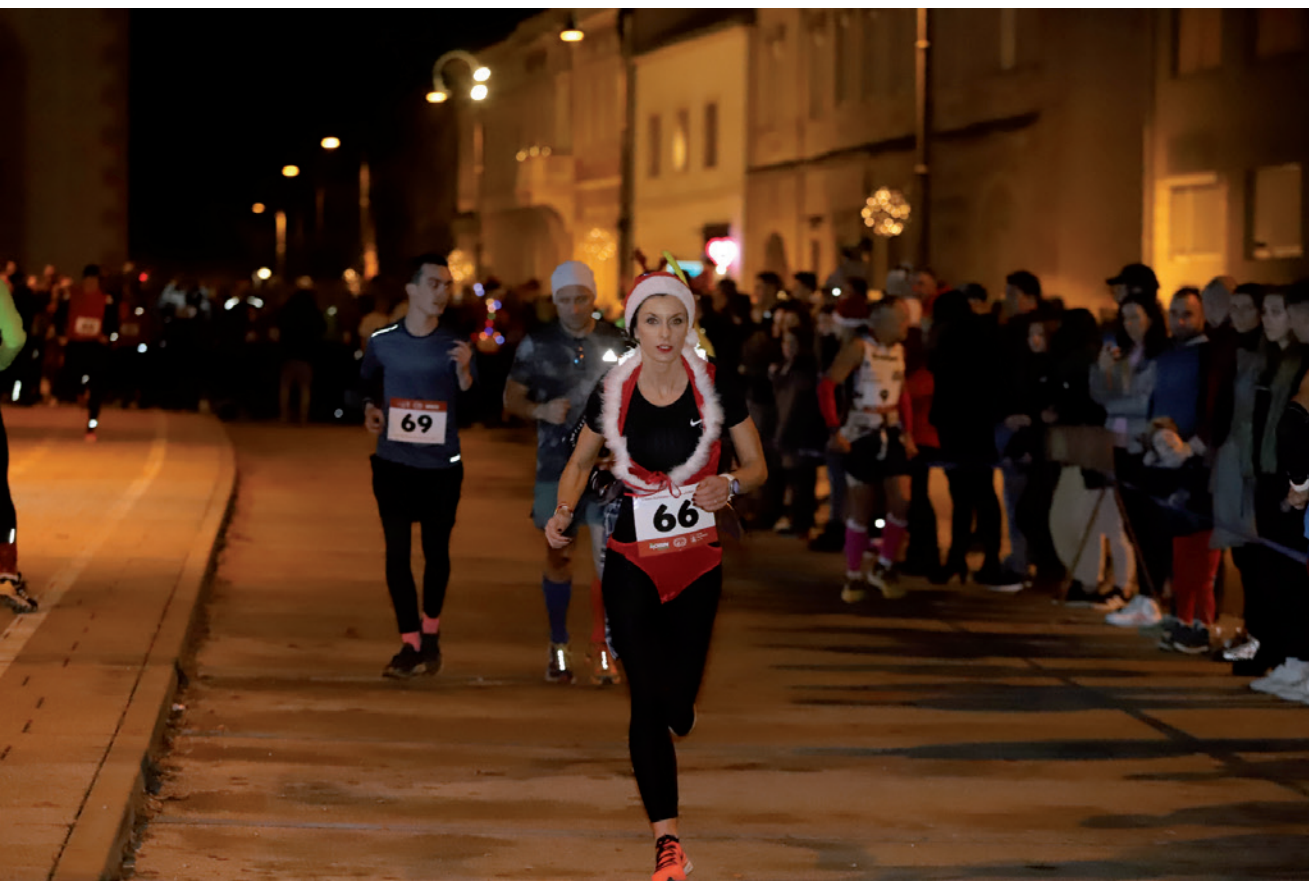
3. Robin – Štefanjska večernja utrka grada Koprivnice