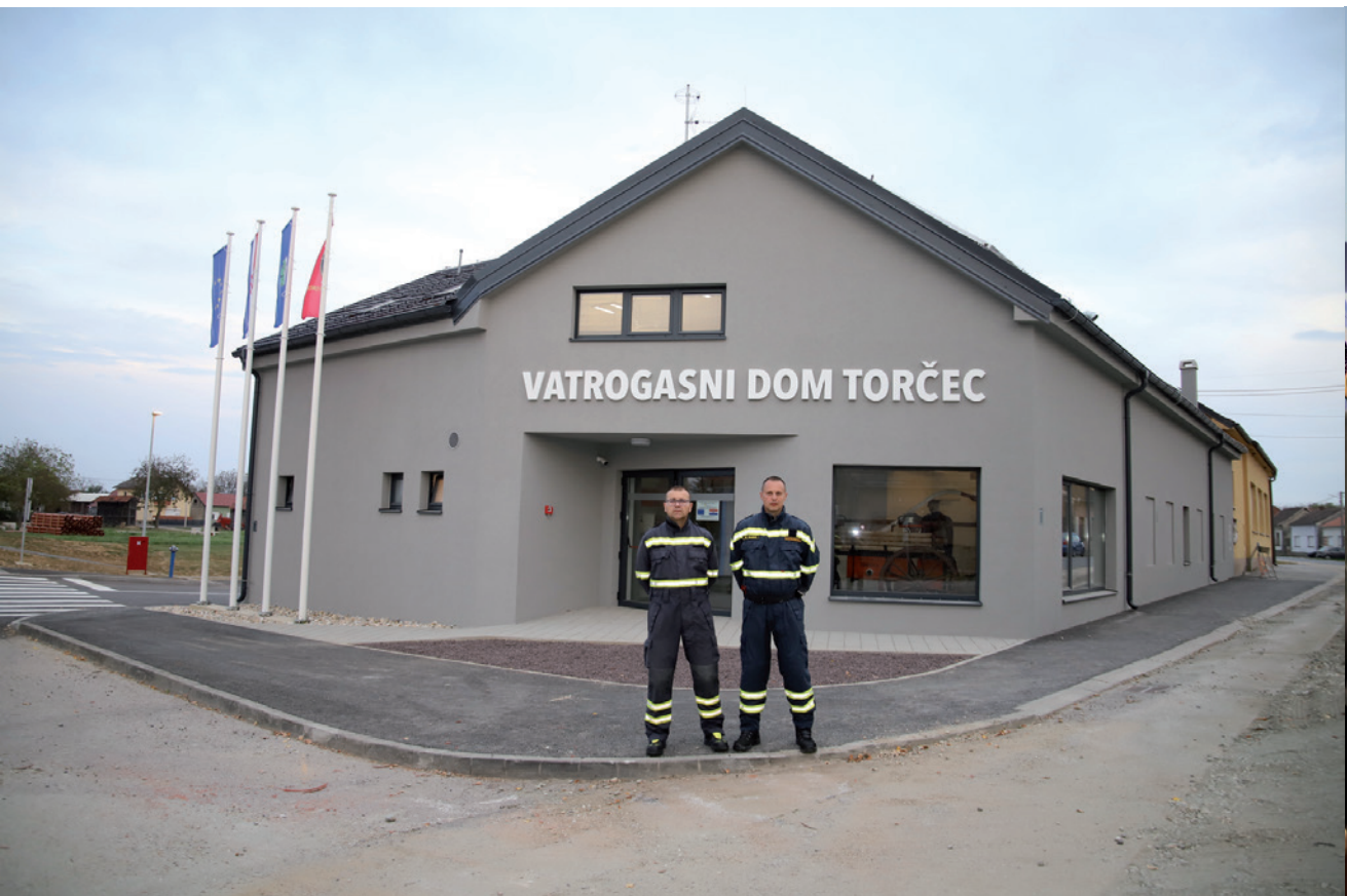
Torčec je dobio novi Vatrogasni dom