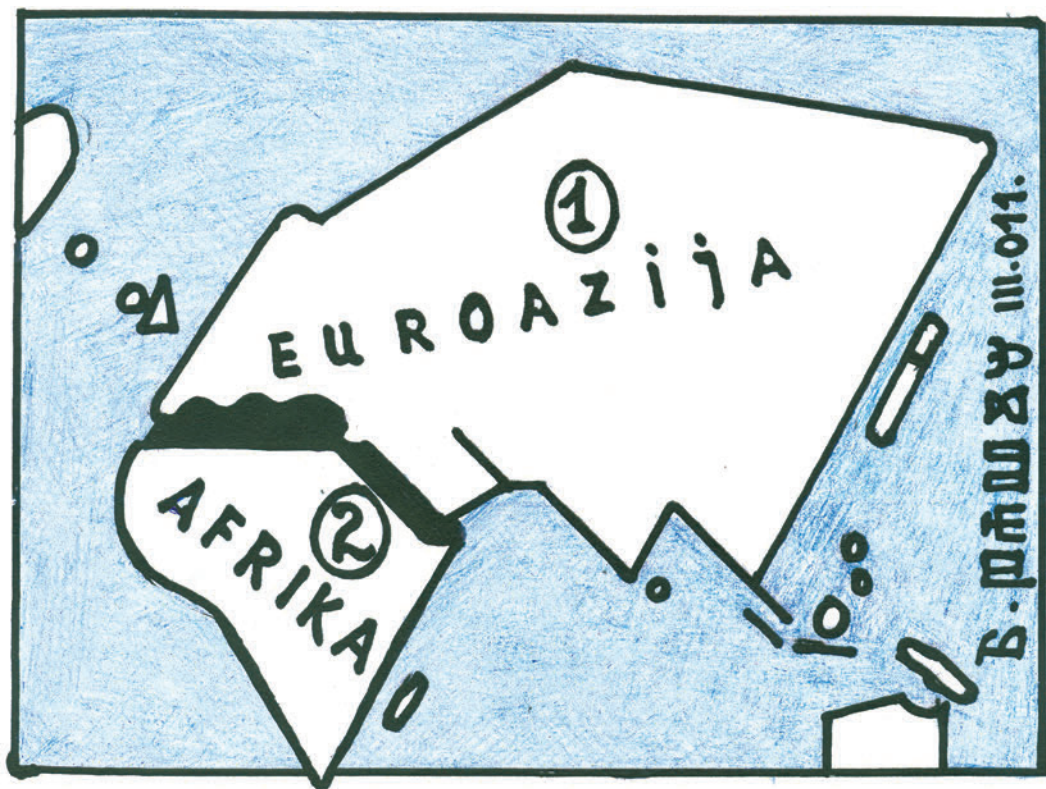
Sl. 1. Klasično Sredozemlje razdvaja svjetski otok