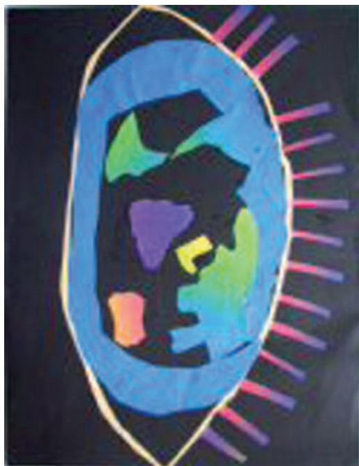
Sl. 6. Štefica Gabud, Svijet u oku

Učenici naše škole sudjelovali su na dva natječaja i njihovi radovi bili su izloženi na međunarodnim kartografskim izložbama. U natječaju 2007. godine inspirirani temom