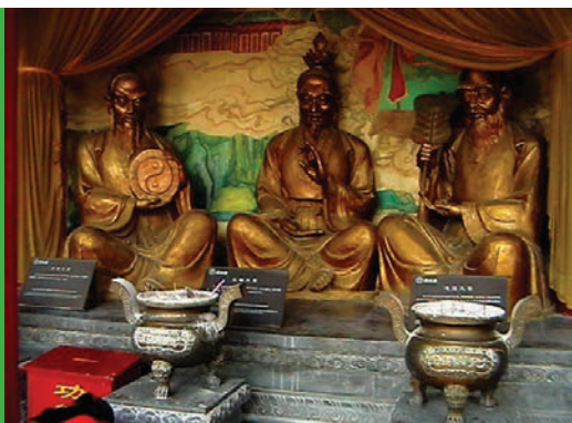
Sl. 4. Unutrašnjost jednog od hramova

Kaifong je zapadnim turistima vrlo nepoznat tako da smo u ovom kompleksu naišli na samo jednog Europljana, a kineskih turista ima 'kao da smo u Kini'. Ali treba primjetiti još nešto. Kinezi nemaju brade. Samo oni od 60 godina pa naviše, ponekad imaju bradu. Samo visoki dostojanstvenici i svećenici na kipovima i slikama imaju znatnu bradu kao odraz uzvišenosti. Obično se na to ne obraća pažnja, ali nas čak dvojica smo imali brade, pa smo primijetili iz idućeg razloga. Kako nismo sličili na dostojanstvene taoističke svećenike i nismo djelovali uzvišeno Kinezi su nas malo čudno gledali. Imali smo osjećaj da pričaju djeci: 'Gledaj sine, ovako su ljudi izgledali dok nije bilo civilizacije'. Pa uistinu, nakon razgledavanja Kaifonga, možemo reći da je Europa u srednjem vijeku imala još dug put pred sobom do civilizacije.