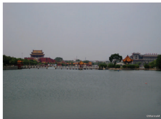
Sl. 5. Pogled na sjeverno jezero

Zapravo je to majstorski spoj drva i kamena koji je preživio tisuću godina prirodnih nedaća. Visoka je preko 50 m, s 13 reljefno izrezbarenih katova (sl. 6). Dozvoljeno je ući i popeti se, ali nije preporučljivo. Pagoda je