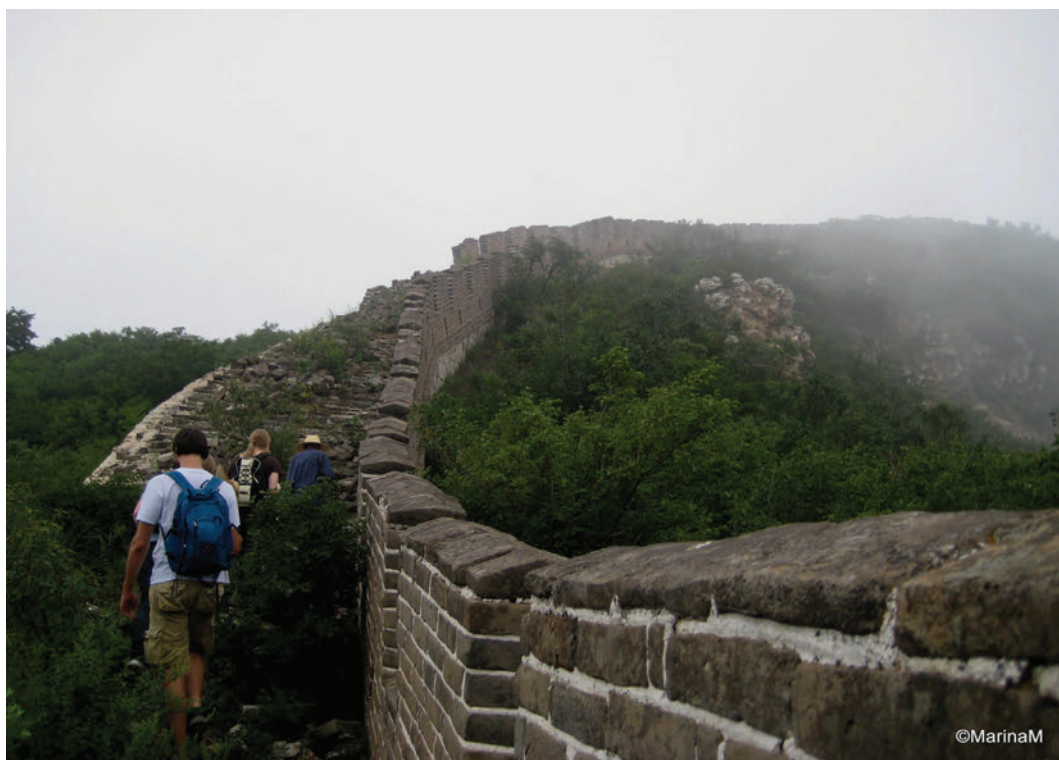
Sl. 8. Zid iz sredine prvog tisućljeća

Posjet muzeju starih astronomskih instrumenata je razočarao. Iako se pričaju bajke o staroj kineskoj astronomiji u ovom muzeju se ne može doznati puno o tomu. Većinom je sve bazirano na suradnji s europskim astronomima i na preuzimanju kopernikanskog sustava. Tu i tamo poneki zanimljiv instrument (vodena ura, sekstant...).