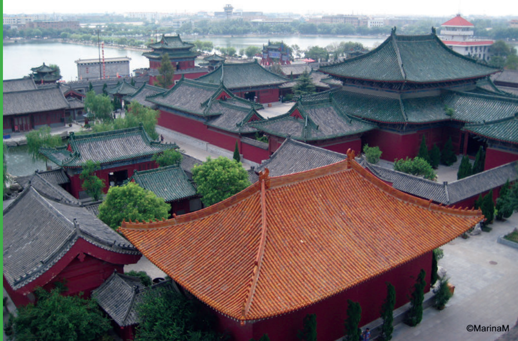
Sl. 3. Carska palača, s vrha carske rezidencije

Kinezi su trgovci pa se tako možete za malu svotu fotografirati u nekoj tradicionalnoj odjeći (ipak, istu odjeću ne prodaju, nažalost). No zato ju neki zaposlenici ovog zdanja nose kao uniformu. Sve je u stilu srednjovjekovne Kine.