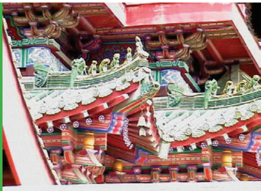
Sl. 2. Detalj s reljefa na carskoj rezidenciji

fom izrađenim puno ljepše i detaljnije (sl. 2) od najbaroknijih europskih građevina. Čim vidite tako nešto odmah vam postaje jasno