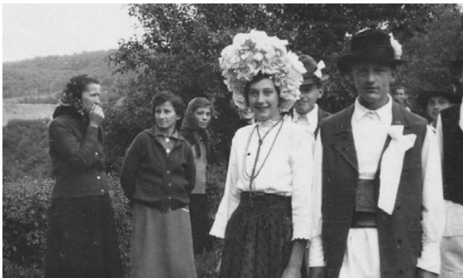
Fotografija 12: Članovi folklornog društva, 1960. – prikaz rekonstrukcije svadbenih običaja. U novije vrijeme fotografije 11 i 12 važne su za obnavljanje običaja tradicijske tounjske kulture.