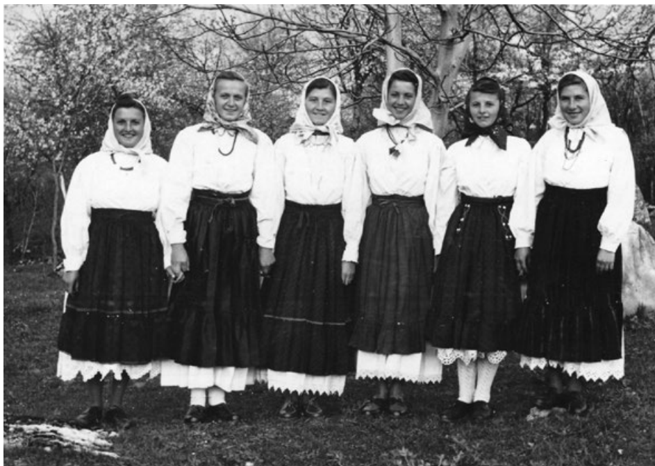
Fotografija 11: Folklorno društvo – članice ženske plesne skupine u narodnim nošnjama, 1953.