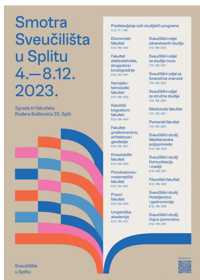
Slika 1 – Plakat Smotre Sveučilišta u Splitu 2023.

Događaj kao što je Smotra Sveučilišta u Splitu izvrsna je prilika za maturante budući da na jednom mjestu mogu dobiti sve potrebne informacije s ciljem što lakšeg odabira studija. Sveučilište u Splitu trenutačno broji 20 sastavnica s više od 200 studijskih programa.