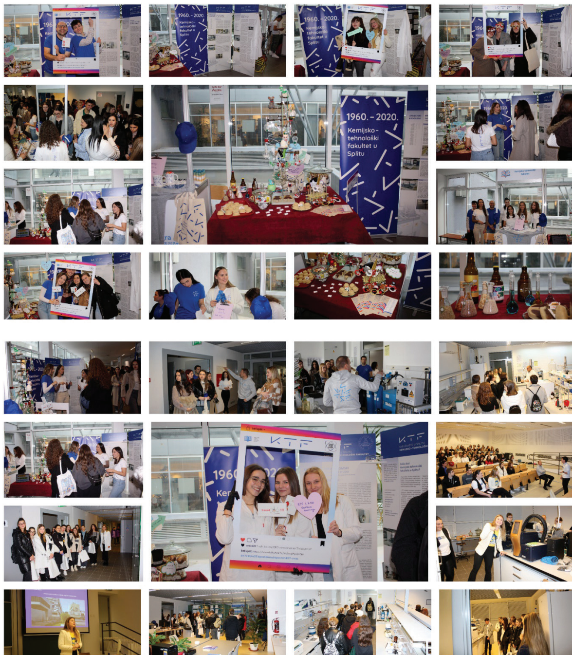
Slika 8 – Dašak atmosfere sa Smotre 2023.

Uživajte u fotografijama, osjetite dašak atmosfere (slika 8)! Vidimo se na Smotri Sveučilišta u Splitu 2024.!