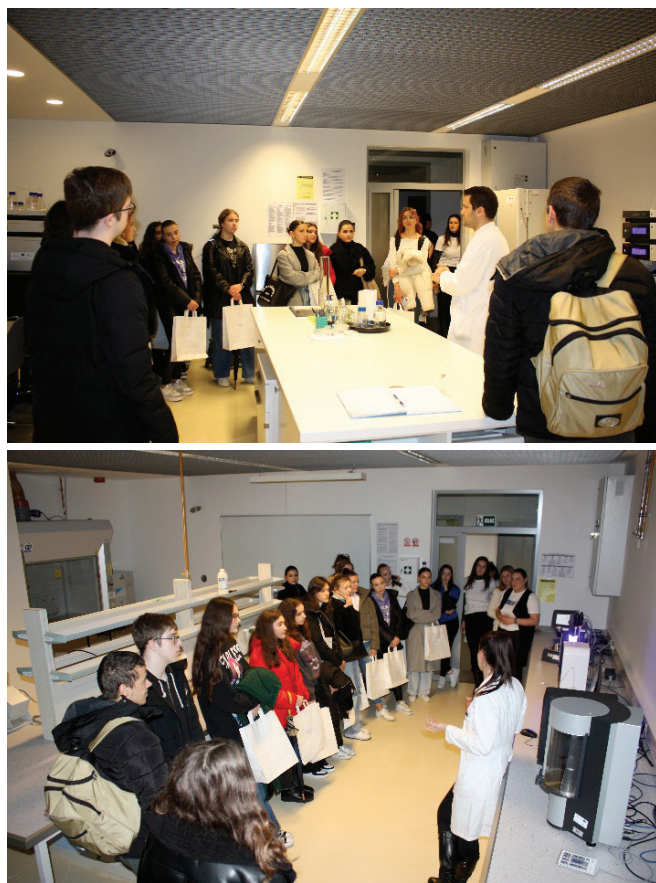
Slika 6 – Razgledavanje Kemijsko-tehnološkog fakulteta