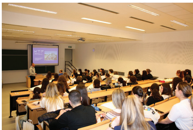
Slika 5 – Prezentacija Kemijsko-tehnološkog fakulteta u amfiteatru