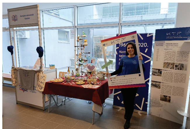
Slika 2 – Izložbeni prostor Kemijско-tehnološkog fakulteta

Po završetku svečanog otvaranja, Smotra je nastavljena u auli zgrade triju fakulteta s postavljenim štandovima svih sastavnica Sveučilišta u Splitu, na kojima su maturanti i svi zainteresirani mogli dobiti povratne informacije i promotivne materijale. Također, sve sastavnice Sveučilišta u Splitu održale su i pojedinačna predavanja tijekom cijelog tjedna (slika 1). Kemijско-tehnološki fakultet imao je priliku predstaviti se budućim studentima kroz dvije aktivnosti: prvoga dana – prezentacijom na štandu (slika 2) te drugoga dana Smotre – prezentacijom u amfiteatru i razgledavanjem Fakulteta kad su im podijeljeni i prigodni poklon-paketi.