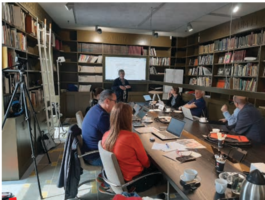
Radionica za edukatore u Sittard-Geleenu, 1. svibanj 2023.

Jedan od ciljeva projekta upravo je povezati baštinske ustanove sa zajednicama iseljenika i useljenika te zajedno kreirati proizvode i usluge kojima bi se migracija dodatno afirmirala kao važan društveni čimbenik i izazov za stručni rad