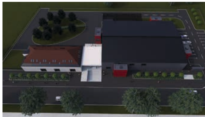
Simulacija budućeg arhivskog spremišta DAVŽ.

U okviru komponente Javna uprava, pravosuđe i državna imovina Ministarstvo kulture i medija zaduženo je za reformsku mjeru Digitalna transformacija konzervatorskih podloga i arhivskih zapisa koja obuhvaća investiciju unapređenja digitalne infrastrukture i usluga javnog sektora u području arhiva za koju je odobreno 35,2 milijuna eura bespovratnih sredstava kojima će se financirati pripadajuće aktivnosti u iznosu od 100 %.