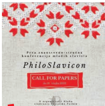
Objava na Facebook stranici Kluba – obavijest o održavanju znanstveno-stručne konferencije PhiloSlavicon © Klub studenata rusistike Puškin

Da bi naše uspomene bile dostupne široj publici, Klub se uključio u projekt They: Live, koji ima cilj dokumentirati studentsku svakodnevicu i objaviti je na virtualnoj platformi Topoteka. S obzirom da smo već bili upoznati s takvom praksom arhiviranja, mada na značajno manjim platformama, Klub je arhivirao i podijelio s projektom svoje najljepše trenutke kako bi se oni očuvali i doprinijeli izgradnji digitalnog arhiva. Taj je pothvat Klub imao priliku prezentirati na konferenciji 8. Dani ICARUS Hrvatska „Exchanging