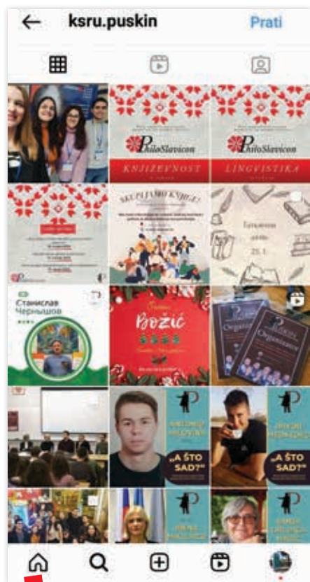
Objave na Instagram stranici Kluba – dosadašnji projekti, druženja, obavijesti © Klub studenata rusistike Puškin

Objava na Facebook stranici Kluba – obavijest o održavanju znanstveno-stručne konferencije PhiloSlavicon © Klub studenata rusistike Puškin