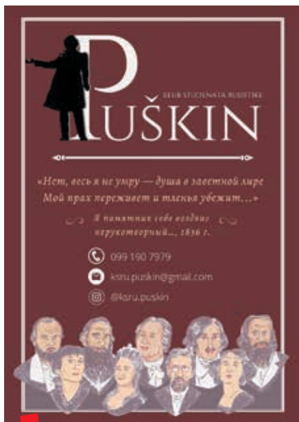
Vizualni identitet Kluba

Najraniji pismeni trag ostavili smo već registriranjem studentskog kluba. Proces registracije i osnivanja kluba studenata, odnosno udruge nije kompliciran, ali je dugotrajan i naporan. Što se tiče papirologije, za upisnik u Registar udruga Republike Hrvatske potrebno je priložiti zapisnik osnivačke skupštine, statut kluba i dokumentaciju o osnivačima. Zatim to službenici u nadležnoj gradskoj instituciji pregledaju, odobre ili pošalju na doradu. Ali, tu nije kraj pripreme i predaje dokumentacije, ovo je bio jednostavniji dio. Nakon gradskog ureda potrebno je uputiti se i u ostale institucije kako bi proces osnivanja i registracije udruge bio gotov. Posebnost osnivanja studentske udruge je u tome što je pri osnivanju potrebno udrugu upisati u Upisnik studentskih organizacija Sveučilišta u Zagrebu. Nakon borbe s birokracijom, klub, odnosno udruga vidljiva je u službenom Registru udruga Republike Hrvatske.