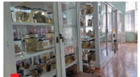
Muzej prije preseljenja