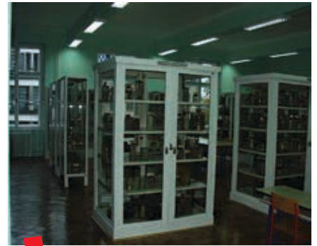
Muzej nakon obnove 2000-ih

Govorov je u periodu od 1924. do 1928. proveo kategorizaciju oko 2.000 preparata, koliko ih se skupilo u prvih pet godina rada Zavoda. Preparati su sve do 1928. bili razbacani, a tada je, zalaganjem Govorova i Saltykova, nabavljeno prvih 10 ormara. Nabavkom ormara u Muzeju je izloženo prvih 340 preparata koji su bili raspoređeni u dvije osnovne skupine: opću patologiju i specijalnu patologiju. Unatoč različitim problemima, Govorov je