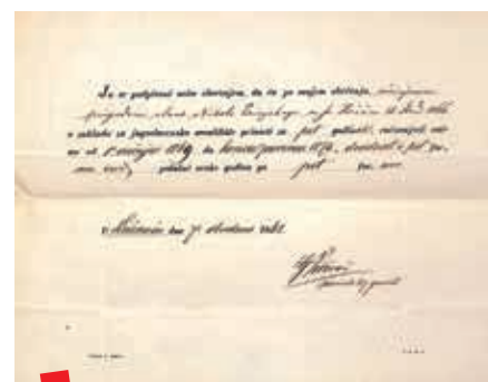
Obveznica iz 1868. za Zakladu jugoslavenskoga sveučilišta u Zagrebu