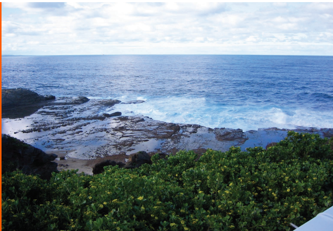
Sl. 8. Wollongong - New South Wales, mjesto okupljanja Hrvata za blagdan Velike Gospe

Nastava hrvatskog jezika na sveučilišnoj razini u Australiji počela je 1983. godine. Hrvatski jezik uveden je na Sveučilište Macquarie 3 , koje je tako postalo prva sveučilišna institucija izvan domovine gdje je uveden hrvatski jezik kao samostalni studijski predmet. Jedan od najzaslužnijih za uspješan rad Studija hrvatskog jezika na Sveučilištu Macquarie u Sydneyu je profesor Luka Budak. U pozicioniranju hrvatskih studija i priznavanju hrvatskog jezika u Australiji značajno su pridonijeli Središnji odbor hrvatskih škola u New South Walesu i Slobodni hrvatski radio program na 2SER-FM. Podrškom, lobiranjem za hrvatski jezik, te programom studija uspjeli su od osnutka do sada privući više od 1500 studenata na Hrvatske studije i time proširiti interes za hrvatski jezik. Od početka rada do danas Hrvatski studiji su se s tri početna predmeta na prvoj godini razvili do