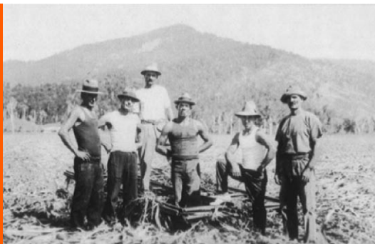
Sl. 1. Starija generacija hrvatskih iseljenika u Australiji krajem 19. stoljeća