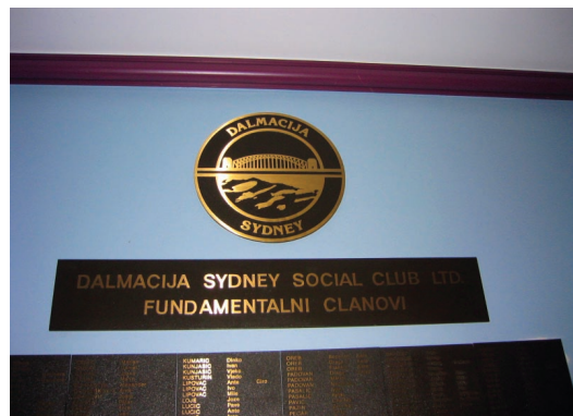
Sl. 4. Dalmacija Sydney Social Club LTD.

Glavna uloga hrvatskih udruga i klubova u New South Walesu temelji se na povezivanju hrvatskih iseljenika s ciljem dugoročnog druženja, razmje-