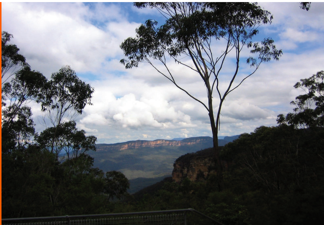
Sl. 12. NP Blue Mountain

bole, a mnoge do tada postojeće političke organizacije prestaju sa svojim radom i djelovanjem iz razloga što su uspostavom hrvatske države njihovi ciljevi bili postignuti, a istovremeno zbog promijenjenih okolnosti u domovini, na političku scenu u Australiji stupaju nove snage i čimbenici (vidi više u: Tkalčević 1999).