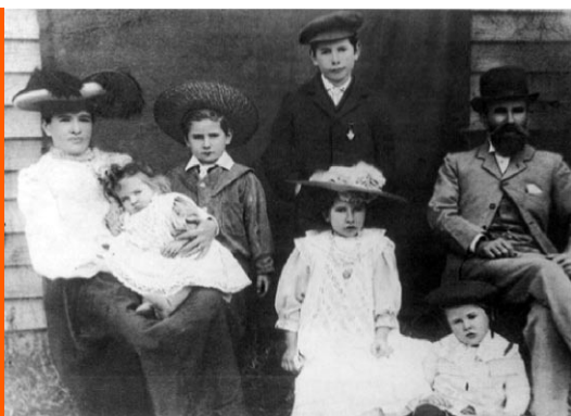
Sl. 2. Obitelj Radonich podrijetlom iz Dubrovnika krajem 19. stoljeća u Australiji