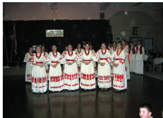
Sl. 5. Kulturno umjetničko društvo Stjepan Radić, Sydney

ne različitih iskustva na svim interesnim poljima unutar postojećih društava, udruga i klubova, od posebne su važnosti međusobna pomaganja na polju svih životnih sfera vođena nostalgijom prema domovini, organiziranje zajedničkih proslava hrvatskih i australskih blagdana i sl. Tijekom istraživanja u New South Walesu 2003. godine uočeno je kako zajednička druženja i susreti unutar društava, udruga i klubova pružaju hrvatskim ise-