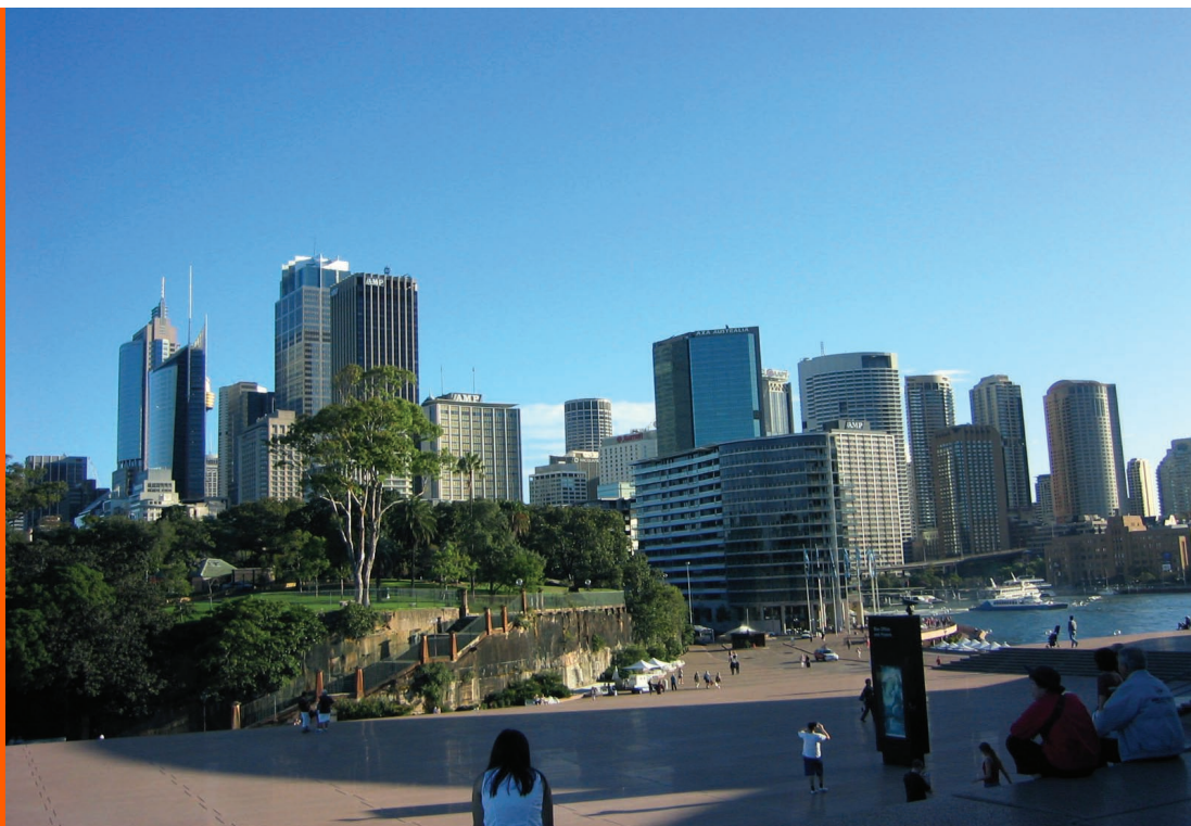
Sl. 6. Sydney - Darling Harbour, downtown

Ijenicima svojevrsnu psihičku stabilnost, utječu na očuvanje i njegovanje etničkog identiteta, hrvatskog jezika, hrvatske kulture i običaja. Istodobno se uočava kako postignuto zajedništvo hrvatske zajednice omogućava hrvatskim iseljenicima kvalitetniji suživot s ostalim migrantskim zajednicama na području New South Walesa.