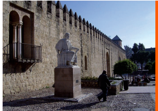
Sl. 6. Abu al Walid Muhammad Ibn Ahmad Ibn Ruschd ili kraće Averroes (1126.-1198.), bio je jedan od najvećih filozofa arapskoga svijeta. Iz ugledne obitelji, od oca suca (kadije), dao je dubok i trajan pečat rodnom gradu. Zahvaljujući njemu, zapadnoeuropska je kultura upoznala djela antičkih filozofa, a prevodeći i komentirajući Aristotela, Averroes je izvršio snažan utjecaj na katoličku skolastičku filozofiju. Osim filozofijom, bavio se i medicinom – napisao je medicinsku enciklopediju.

Kao središte kalifata, u znanosti i umjetnosti Cordoba je prednjačila. U gradu je djelovalo mnoštvo znanstvenika i umjetnika iz svih područja: filozofa, povjesničara, geografa, astronoma, matematičara, liječnika, književnika... Većina njih djelovala je na vladarskom dvoru jer su znanost i umjetnost uživali bogatu podršku vladara. Danas su na istaknutim mjestima u gradu spomenici dvojici njih.