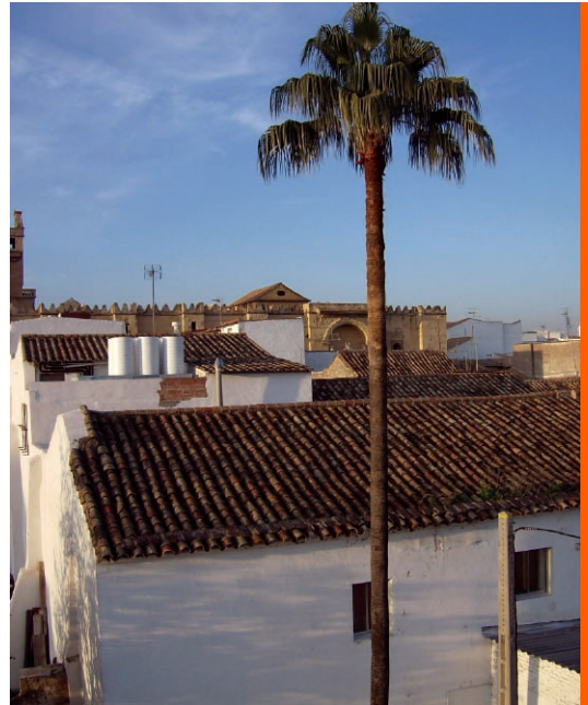
Sl. 14. Poneki prizori podsjećaju na Sjevernu Afriku ili Bliski istok.