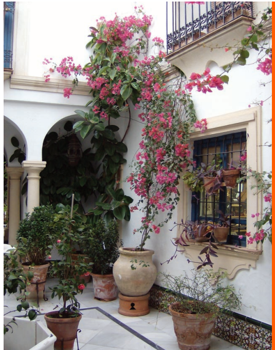
SI. 5. Kulturna baština kao turistička privlačnost – andaluzijski vrt (patio)