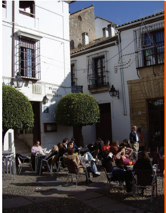
SI. 4. Nekadašnja židovska četvrt danas ima ugostiteljsku, rekreacijsku i turističku namjenu

Dok šćete Cordobom, iznenadi vas njezina prostranost – glavne ulice su vrlo široke, a trgovi vrlo veliki. Jedan od njih zove se Plaza tres culturas (Trg triju kultura). Međutim, jedan dio grada sve je samo ne prostran. Ulice su uske, nepravilnog oblika, a trgovi mali. To je Juderia – židovska četvrt. Kuće su ovdje niske, sve su bijele boje, svježe oličene. Nerijetko se naiđe na dovratnik ili ogradu uređen u maurskom stilu. Četvrt je puna restorana i kafića, gdje vas čeka andaluzijski specijalitet serviran u malim posudama – tapa (od španjolskog „poklopac”). Navečer u mnogima od njih možete uživati u flamenku. Na svakom su koraku stabla narandži – prepuna cvjetova ili plodova. Na žalost prolaznika, a na sreću njihovih foto-objektiva, te naranče nisu jestive. Ako provirite u vrt (kojega vlasnici često „slučajno” ostavljaju otvorenim), divit ćete se umijeću aranžiranja – arhitekture, zelenila i cvijeća kojega, zahvaljujući toploj klimi Andaluzije, ima gotovo uvijek. Vrtovi Cordobe (španj. patio) čuveni su u svijetu.