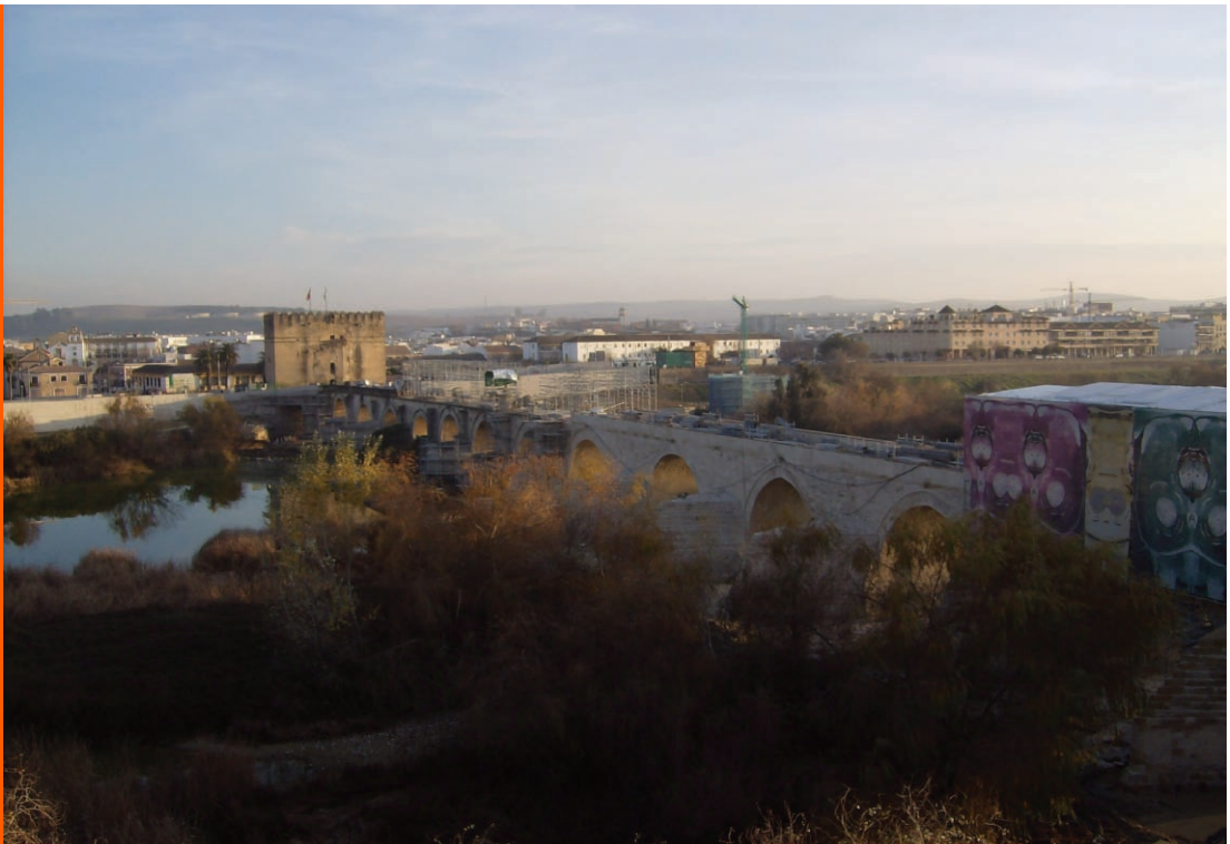
Sl. 2. Rimski most na rijeci Guadalquivir te u pozadini katedrala

Cordobu će s ponosom u sastavu svoje države istaknuti i Bizantinci među najzapadnijim po-