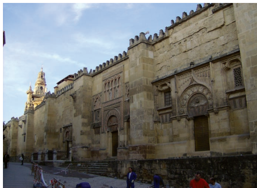
Sl. 8. Zid oko kordopske katedrale

Ušavši u zgradu, u polumraku se suočavate s mnoštvom crnih granitnih stupova - ima ih preko osam stotina! Međusobno su povezani crvenobijelim lukovima – bizantski utjecaj još iz Sirije. Osim ovog kulturnog preplitanja još vam je neobičnije vidjeti raspelo uokvireno tipično arapskim