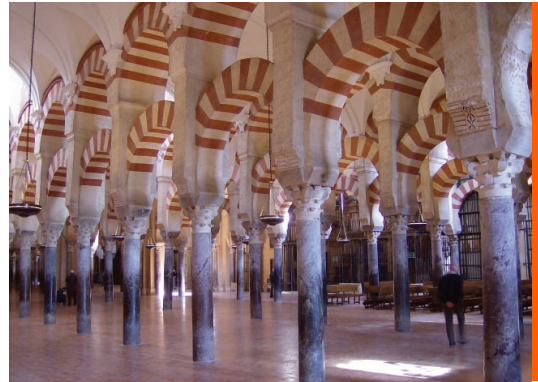
Sl. 3. U kordopskoj katedrali

Pedesetak godina kasnije jedan je od nasljednika Abd ar Rahmana I., Abd ar Rahman III., stupio na prijestolje kao osmi emir emirata Cordoba. Imao je jasne ciljeve: uspostaviti autoritet emirata tamo gdje je bio narušen i srušiti vlast pojedinih feudalaca koji su se bili više ili manje odmetnuli od vlasti emira. Osobno je predvodio emirske čete u ostvarivanju toga cilja i osvojio pobunjene