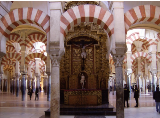
Sl. 10. Miješanje kršćanskih i islamskih elemenata: raspelo okruženo lukovima (crveno-bijele lukove Arapi su izgradili po uzoru na kršćanski Bizant)

lukom ili pak masivna, orijentalna vrata ukrašena arapskim slovima – sve u katedrali. Najveći dio građevine ostao je neizmijenjen – samo su u sredini porušeni stupovi i sagrađeno je svetište u skladu s katoličkom graditeljskom tradicijom, i tu se doista osjećate kao u crkvi.