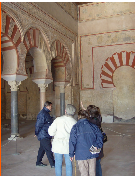
Sl. 12. Nekadašnja dvorana s prijestoljem kalifa danas je predmet proučavanja turista i stručnjaka

Međutim, povijesna sudbina nije htjela zadržati ovo divljenja vrijedno zdanje dugo na pozornici. Kordopskome kalifatu i obitelji Omajada primicao se nepovratni pad. Usprkos velikoj snazi Kalifata i ne obazirući se na njegove kulturne dosege, u Španjolsku su iz sjeverne Afrike prodrli Berberi pod vodstvom dinastije Almoravida koji su proizročili donedavno nezamislivi pad Kalifata, a 1010. godine do temelja su srušili Medinu Azaharu. Sjajno graditeljsko djelo trajalo je 65 godina. Padom Kordopskog kalifata Omajadi su nestali s povijesne scene.