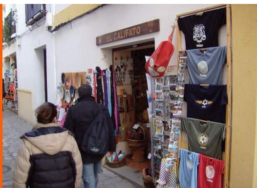
SI. 16. Prodavaonica „El califato” (Kalifat) – povijesna baština koristi se u trgovini, odnosno turizmu.