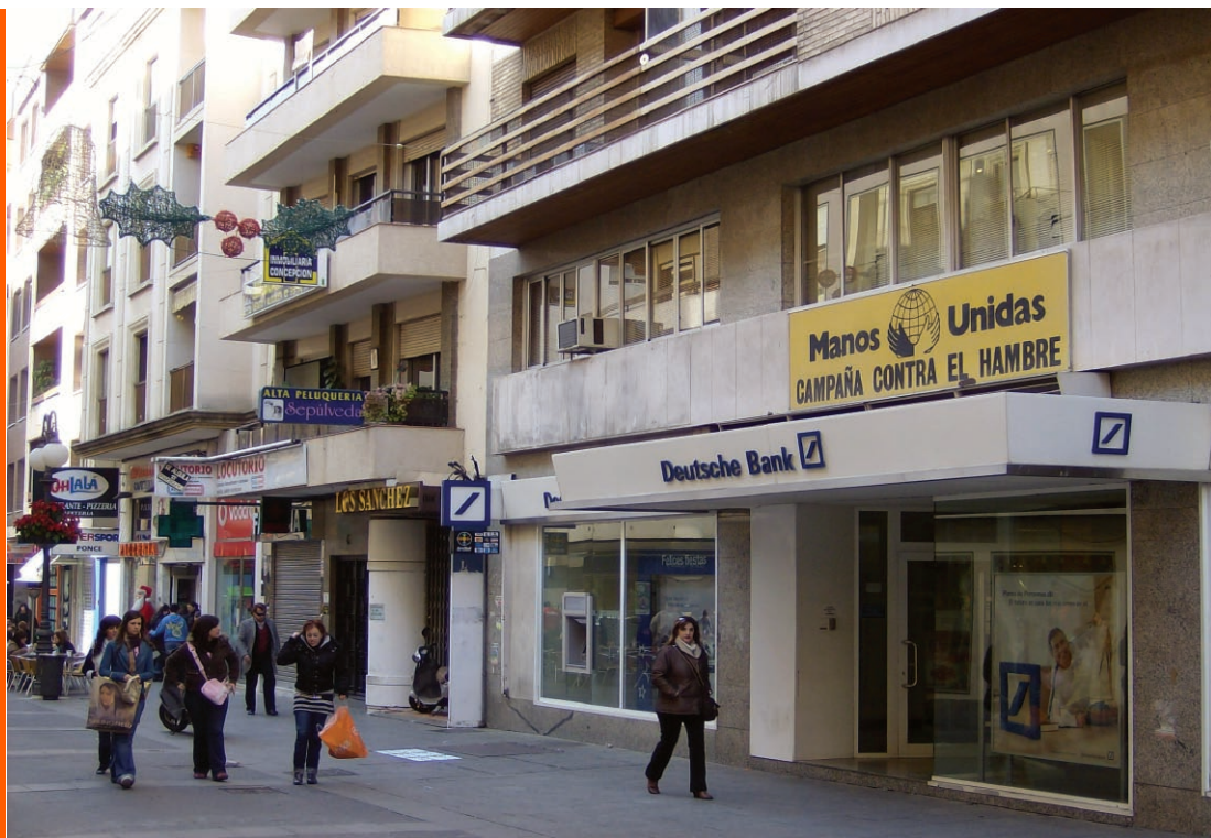
SI. 15. Poslovnica Njemačke banke govori o utjecaju Njemačke na današnje španjolsko gospodarstvo.