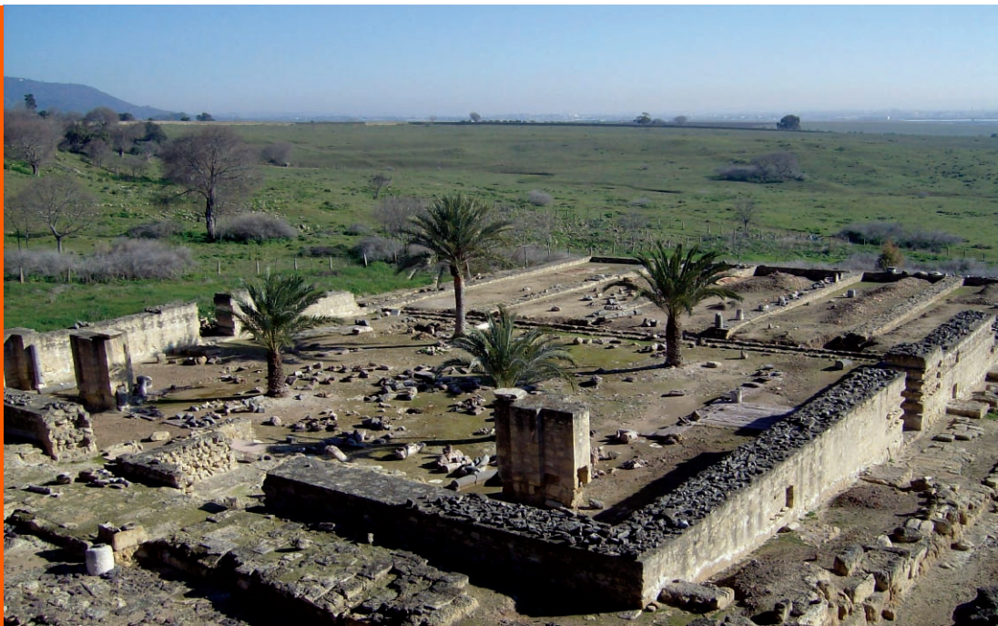
Sl. 11. Medina Azahara