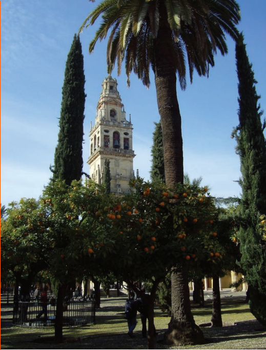
Sl. 9. Katedrala je jedan od najposjećenijih spomenika u Španjolskoj.

lukom ili pak masivna, orijentalna vrata ukrašena arapskim slovima – sve u katedrali. Najveći dio građevine ostao je neizmijenjen – samo su u sredini porušeni stupovi i sagrađeno je svetište u skladu s katoličkom graditeljskom tradicijom, i tu se doista osjećate kao u crkvi.