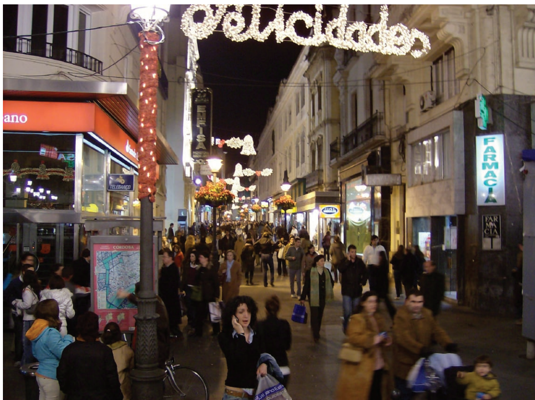
Sl. 1. Poslovno središte grada oko 22 sata u siječnju – klima i mentalitet uvjetuju drugačiji način života.

Kada danas dođete u Cordobu, primijetite da je to, iako relativno velik, iznenađujuće miran grad. Dojam mirnoće stvaraju nizina u kojoj se grad nalazi, vrlo široke ulice, ne tako visoke zgrade, ali i ležernost stanovnika. U usporedbi s drugim španjolskim gradovima, u živosti i događanjima Cordoba znatno zaostaje za obližnjom Sevilom, a još više za španjolskim metropolama Madridom ili Barcelonom. Međutim, ipak se osjeća njezin šarm. Ni sami ne znate odakle on dolazi: od prastare židovske četvrti malih, svježe oličenih kuća, od brižno uređenih dvorišta čiji vlasnici diskretno ostavljaju otvorena vrata ne bi li prolaznik malo skrenuo s ulice i pogledao njihovo umijeće. Možda od čuvene katedrale koja je gra-