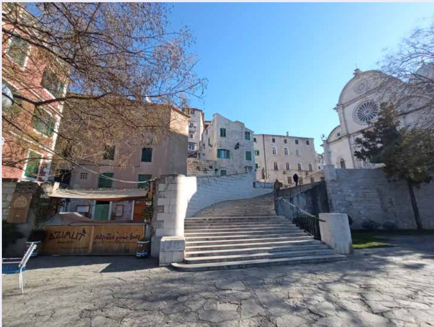
Šibenik, pogled na Četiri bunara s obale