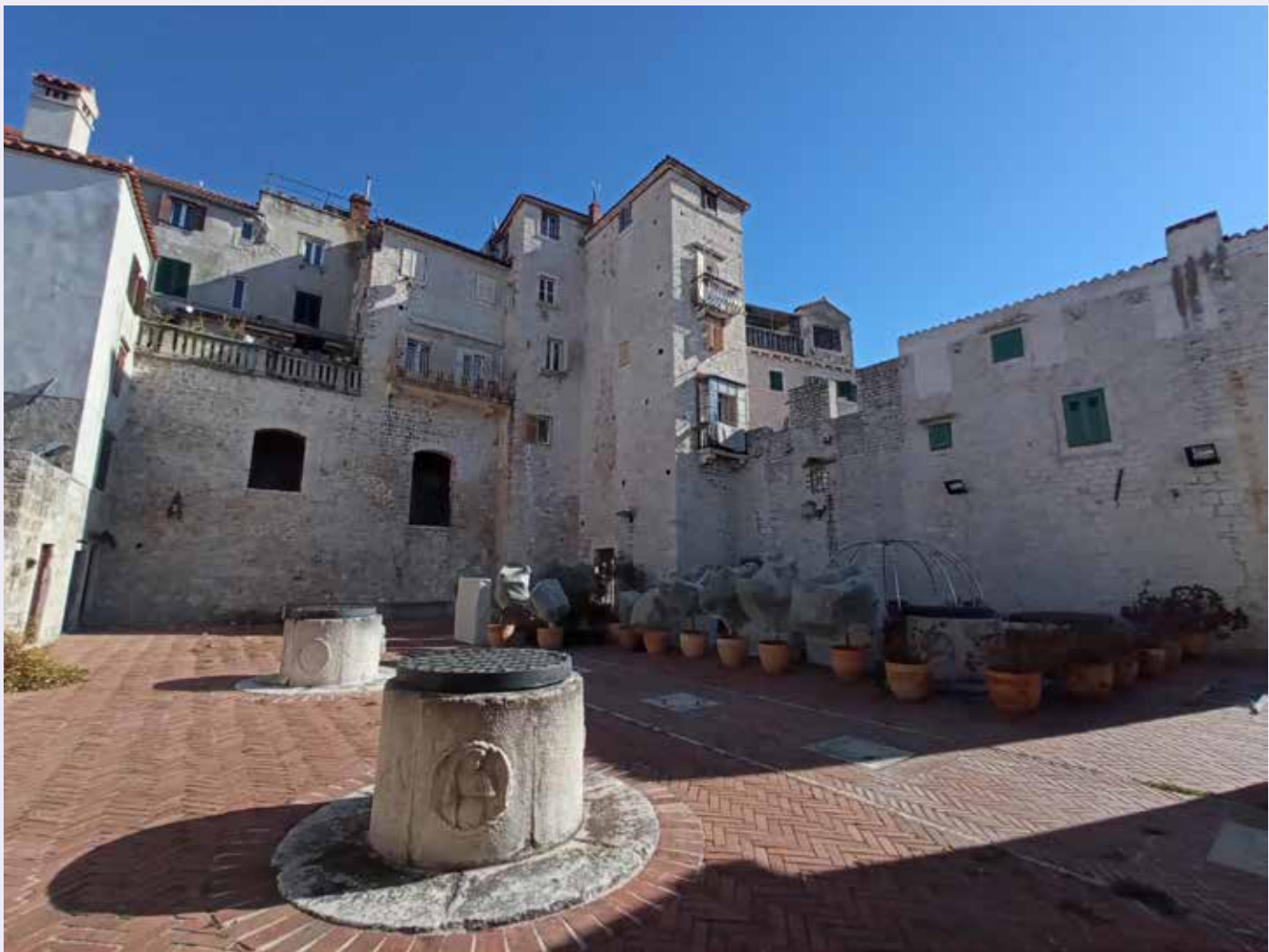
Šibenik, terasa Četiriju bunara nakon restauracije, pogled prema kuli Pelegrini