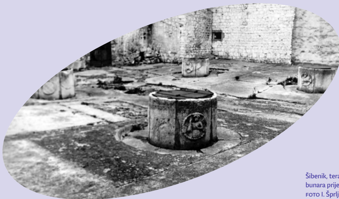
Šibenik, terasa Četiriju bunara prije restauracije