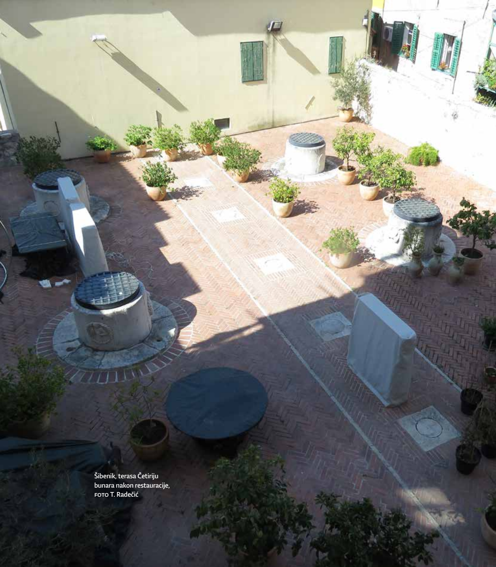
Šibenik, terasa Četiriju bunara nakon restauracije