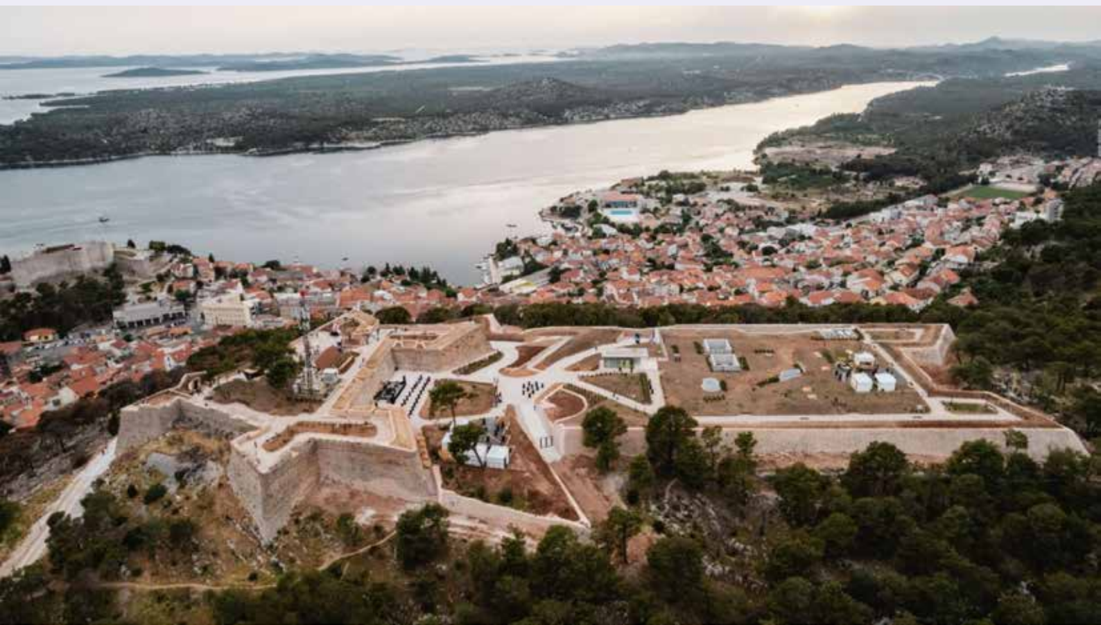
Utvrda sv. Ivana, FOTO Tvrđava kulture