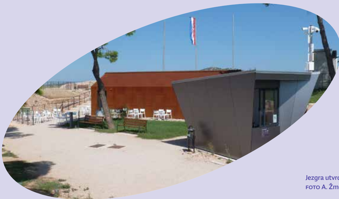
Jezgra utvrde

Obnova utvrde sv. Ivana u Šibeniku, lipanj 2022.