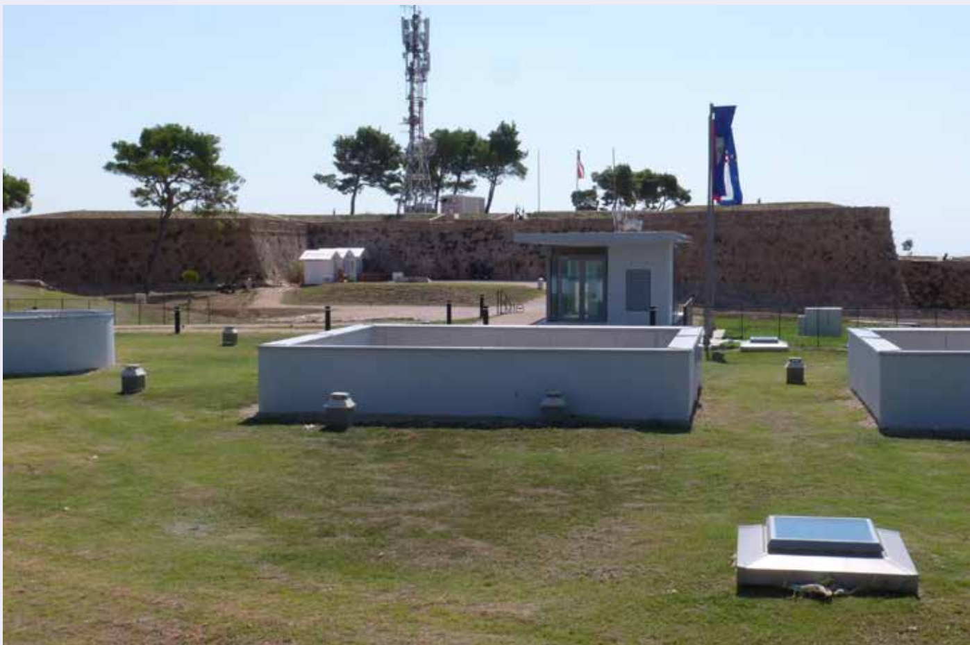
Pogled prema jugu