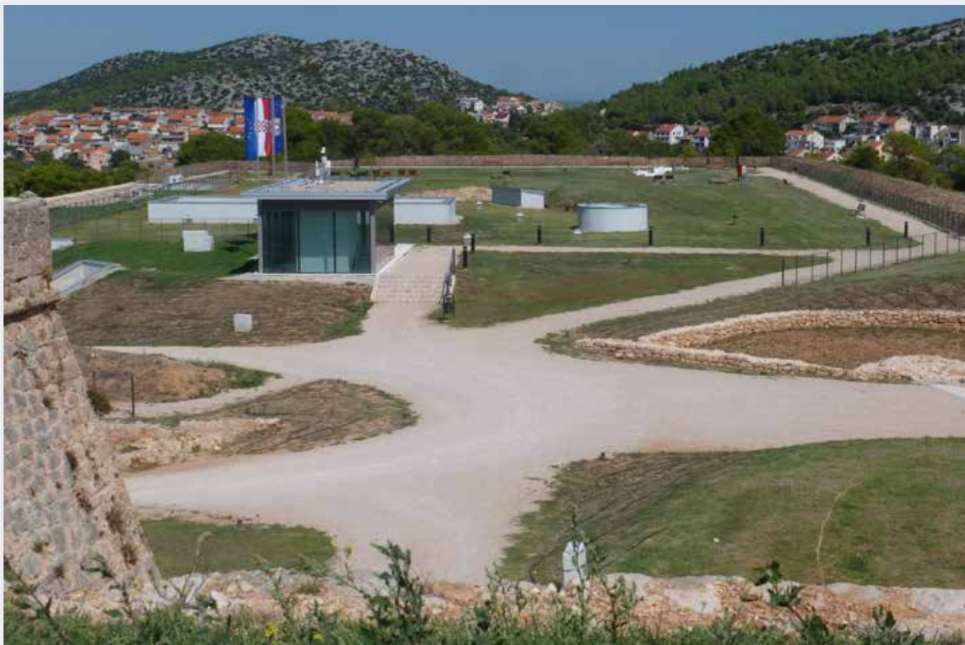
Pogled prema sjeveru