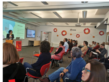
BDC seminar u Zagrebu u Srcu, 27. studenoga 2023.