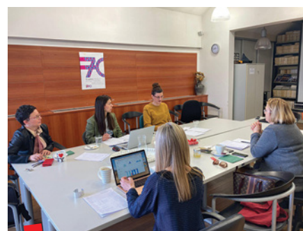
Sastanak voditelja, koordinatorica i urednika registara. Knjižnica IEF-a, 19. travnja 2023.