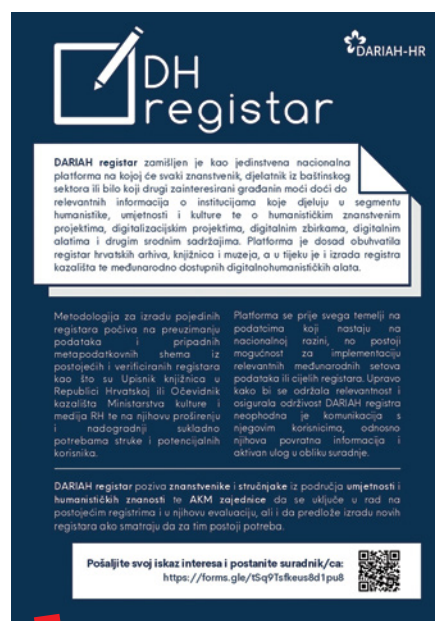
DH registar promotivni letak