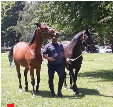
Klinike i zavodi Veterinarskog fakulteta