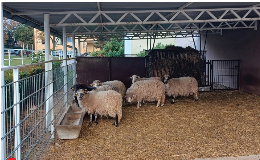
Klinike i zavodi Veterinarskog fakulteta

I na kraju dolazimo do najzabavnijeg dijela šetnice Fakulteta kojeg čine naši živi eksponati. Iako je njihova prisutnost isključivo obrazovnog karaktera oni nam uljepšavaju svaki radni dan i daju nam opuštajući osjećaj seoske idile. ■