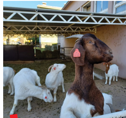
Klinike i zavodi Veterinarskog fakulteta