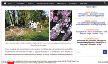
Horvatom brijeg u perivoju fakulteta / Obilježavanje biljnih vrsta u perivoju Fakulteta.

na fitocenološkom snimanju i unosu u karte detaljnog mjerila. Horvatom zalaganjem proglašeno je više prirodnih rezervata: Nacionalni park Risnjak u Hrvatskoj i Nacionalni park Pelister u Makedoniji, kao i manji rezervati kao što su šumski rezervati Lička Plješivica, kanjonska dolina Zelenjak i močvarni cret Dubravica u Hrvatskom zagorju. Tijekom višegodišnjeg neumornog istraživanja skupio je najveći osobni herbar jugoistočne Europe s više od 75.000 listova, koji se danas čuva u Botaničkom zavodu Prirodoslovno-matematičkoga fakulteta u Zagrebu. Tijekom akademske godine 2022./23. digitalizirana je Zbirka Ive Horvata koju sačinjavaju personalije, izvještaji sa znanstvenih i stručnih putovanja, odluke i članstva u brojnim domaćim i međunarodnim društvima, odlikovanja i dr.