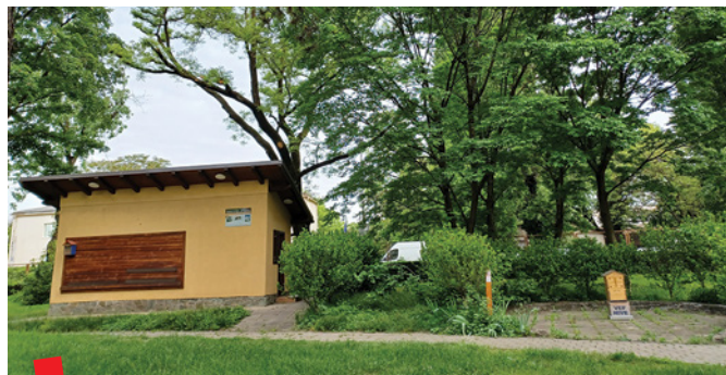
Edukativno-arhivska postaja za pčelarstvo