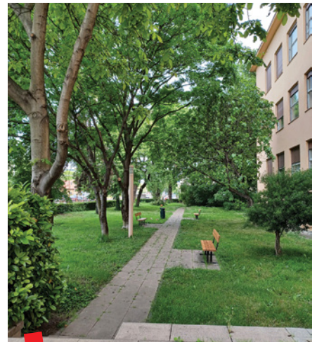
Horvatom brijeg u perivoju fakulteta

Na Zavodu za veterinarsku biologiju čuva se i Karpološka zbirka profesora Horvata koja se sastoji od 515 dijaspora (plodova i sjemenki) u staklenim boči-