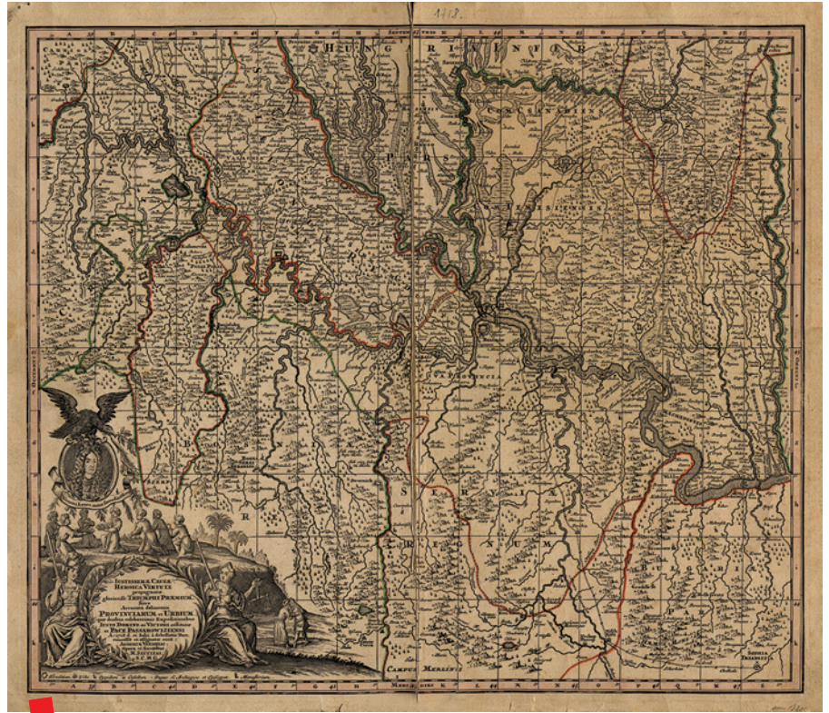
Karta graničnih područja Austrije i Turske nakon mira u Karlovcima i Požarevcu 1718. godine. AV, F.373, 1

Nakon protjerivanja Turaka i Požarevačkog mira 1718. godine cijelo područje Banata je pripalo Austriji. Na teritoriji tzv. Tamiškog Banata organizirana je vojna uprava koja je 1751. godine zamijenjena civilnom. Bečki dvor nije dugo dopuštao da se Banat priključi Ugarskoj, kako je to tražilo ugarsko plemstvo, već ga je stavio pod svoju vojno-komorsku upravu. Ugarski sabor je tek 1778.