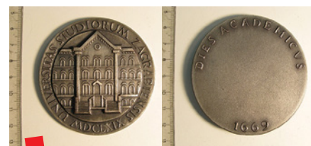
Spomen-medalja Sveučilišta u Zagrebu autora Ante Despota (1969.)

Prilikom evidentiranja i obrade svih 140 medalja izvršena je i njihova digitalizacija koja će korisnicima uskoro biti dostupna na portalu Vizbi.UNIZG, a neke su već i sada javno dostupne. ■