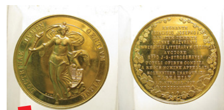
Zlatna spomen-medalja otvorenja Sveučilišta u Zagrebu (1874.)

Najnovija sveučilišna medalja izrađena je 2019. prilikom proslave 350. obljetnice Sveučilišta, a njezin je autor profesor Damir Mataušić. Medalja je napravljena u tri inačice: 1) Počasna medalja od srebra, težine 350 gr/925 sa zlatnim aplikatom od 22 karatnog zlata promjera 24 mm, 2) Počasna medalja od srebra, težine 350 gr/925, 3) Počasna medalja od tombaka (jedne vrste mjedi). Sve medalje bile su promjera 90 mm. Na aversu medalje nalazi se zgrada Rektorata ispred koje je skulptura Ivana Meštrovića „Povijest Hrvata“. Iznad zgrade je natpis 1669., na lijevoj strani zgrade je natpis 1874. unutar koje se nalazi i smanjena zlatna sveučilišna medalja iz 1874., dok je na desnoj strani natpis 2019. popraćen izmjeničnim kvadratima koji predstavljaju hrvatski identitet unutar kojega je i smanjeni grb Zagreba. Na dnu aversa ostavljen je prostor za ugraviranje imena dobitnika medalje. Počasnu zlatnu medalju Sveučilište u Zagrebu dodijelilo je akademiku Zvonku Kusiću, kardinalu Josipu Bozaniću, general-pukovniku Mati Pađenu te svojim sastavnicama: Građevinskom fakultetu,