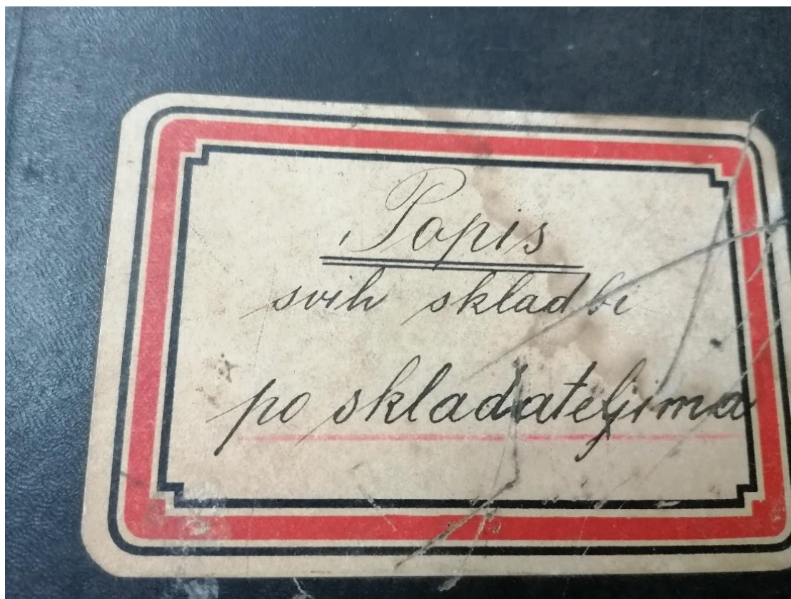
Slika 1. Inventarna knjiga HPD „Lipa“

života grada Osijeka i Osječko-baranjske županije te je od njih primila vrijedna priznanja za svoja postignuća, od kojih se izdvajaju: Pečat grada Osijeka za doprinos u duhovnom razvoju grada Osijeka 1996., Nagrada Osječko-baranjske županije za iznimna dostignuća 2000. te zlatnu plaketu Grb grada Osijeka za izuzetna ostvarenja u kulturi 2009. Prvo literarno izdanje u kojem se iscrpno govori o nastanku i povijesti Hrvatskoga pjevačkog društva „Lipa“ djelo je dr.sc.Stanislava Marijanovića, uglednog znanstvenika, sveučilišnog profesora i književnika, pod nazivom Hrvatsko pjevačko društvo „Lipa“ u Osijeku 1876. – 1986., a izdano je 1987. prigodom 110. obljetnice osnutka Društva. Okosnicu „Lipina“ repertoara čine a cappella skladbe hrvatskih i svjetskih skladatelja, od renesanse do suvremene zbarske glazbe.