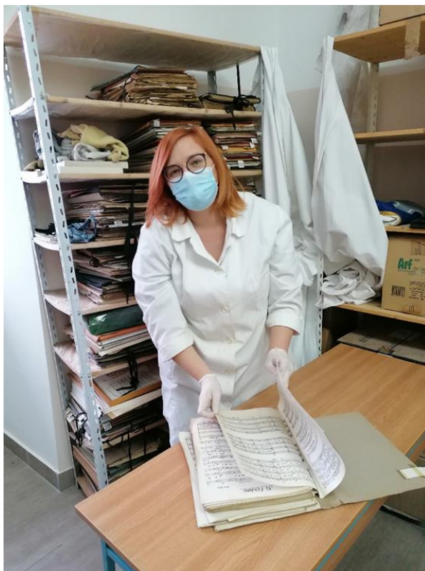
Slika 3. Pregled notne građe nakon preseljenja u preuređeni prostor