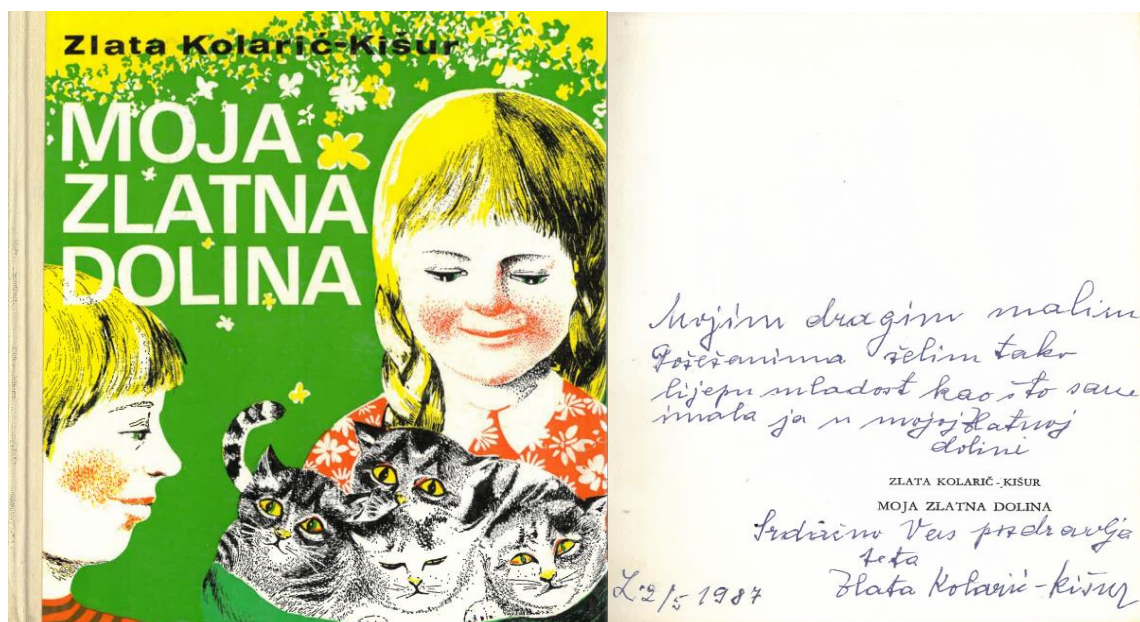
Slika 5. Kolarić-Kišur, Z. Moja Zlatna dolina . Zagreb : Mladost, 1986. (Iz privatne ostavštine Zlate Kolarić-Kišur)

Dječjim romanom Moja Zlatna dolina Zlata Kolarić-Kišur opisuje vlastito odrastanje i djetinjstvo u Požegi, gradu u srcu Slavonije kojega su još Rimljani zbog specifičnih prirodnih ljepota nazvali Zlatnom dolinom. Roman je podijeljen na dva dijela: Moja Zlatna dolina i Rastanak sa Zlatnom dolinom . Prvi dio romana Moja Zlatna dolina opisuje Zlatino djetinjstvo koje je bilo lijepo, bezbrižno i radosno te prepuno igre i posebnih prijateljstava, a drugi dio romana Rastanak sa Zlatnom dolinom značajnije bilježi ozbiljnije i tragičnije tonove nastale uslijed zbivanja tijekom Prvoga svjetskog rata.