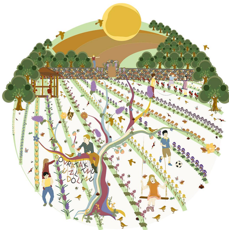
Slika 6. Vizual književne manifestacije Povratak u Zlatnu dolinu koji je izradila požeška umjetnica Nina Alvir

Sama kompozicija romana otvorila je Gradskoj knjižnici Požega, kao nasljednici Zlatine ostavštine, prostor za metaforičkim stvaranjem trećeg poglavlja romana i to onog za kojim je sama književnica čitav život čeznula, a to je upravo Povratak u Zlatnu dolinu . Metaforičko je to treće poglavlje Moje Zlatne doline ostvareno kao književna manifestacija nastala 2022. godine s ciljem promocije života i stvaralaštva Zlate Kolarić-Kišur, poticanja stvaranja dječje dramske književnosti kroz nacionalni natječaj za dječji igrokaz nadahnut romanom Moja Zlatna dolina te konačno s ciljem stvaranja suradnje kulturnih i odgojno-obrazovnih ustanova kroz uprizorenje igrokaza i njegovu primjenu u školama