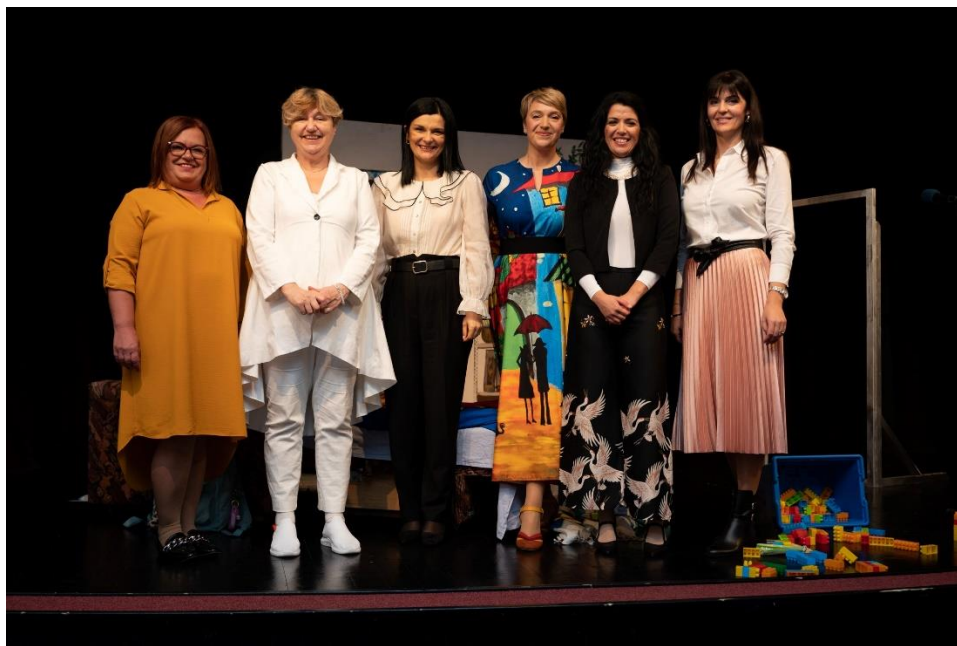
Slika 8. Završna manifestacija Povratak u Zlatnu dolinu Gradske knjižnice Požega; studeni 2023.

Konačno, Gradska knjižnica Požega kao organizator i koordinator književne manifestacije poziva učitelje i učiteljice da koriste igrokaze proizašle iz manifestacije u redovnoj nastavi, posebno kada se obrađuje lektirni naslov Moja Zlatna dolina ili kada se pripremaju scenski nastupi za razne školske svečanosti.