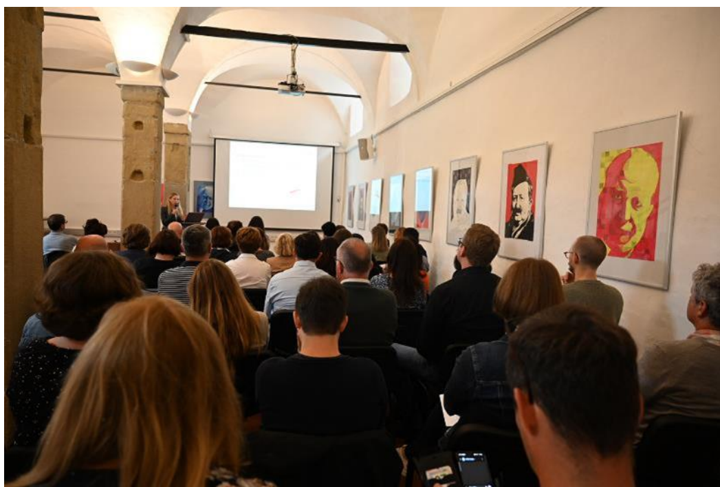
Slika 4. Od 2019. godine, u Ptujju pripremamo stručne skupove za knjižničare na području zavičajnih studija. Na fotografiji su sudionici stručnog skupa pod nazivom 2. delovno srečanje domoznancev u Ptujju, održanom 2023. godine.

Trenutno se u okviru šire radne skupine pripremaju smjernice za provedbu zavičajne djelatnosti u slovenskom knjižničnom sustavu. Nakon brojnih uspješno provedenih projekata digitalizacije, posljednjih je godina među SRK-ovima aktualno i pitanje digitalizacije djela koja su još zaštićena autorskim pravom i trajnog očuvanja digitalnih sadržaja. U traženju rješenja SRK-ovi surađuju s NUK-om.