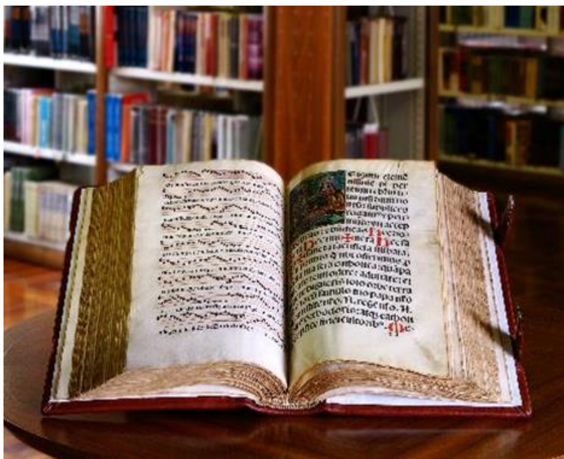
Slika 2. U Odjelu za zavičajnost čuva se i knjižno blago koje datira iz 15. i 16. stoljeća. Na fotografiji je bogato ilustrirani misal Missale secundum ritum sancte ecclesie Pragensis in Bohemia iz 1522. godine koji sadrži nekoliko pergamentnih listova. Knjiga je restaurirana 1986.

Njihovo pohranjivanje u Odjelu za zavičajnost ima smisla jer se, kao i kod zavičajne građe, radi o posebno brižno čuvanoj građi koja je dostupna samo za korištenje u čitaonici. Zavičajnu građu i aktivnosti prezentira se na manifestacijama i izložbama kroz bibliografski rad i publicističke aktivnosti.