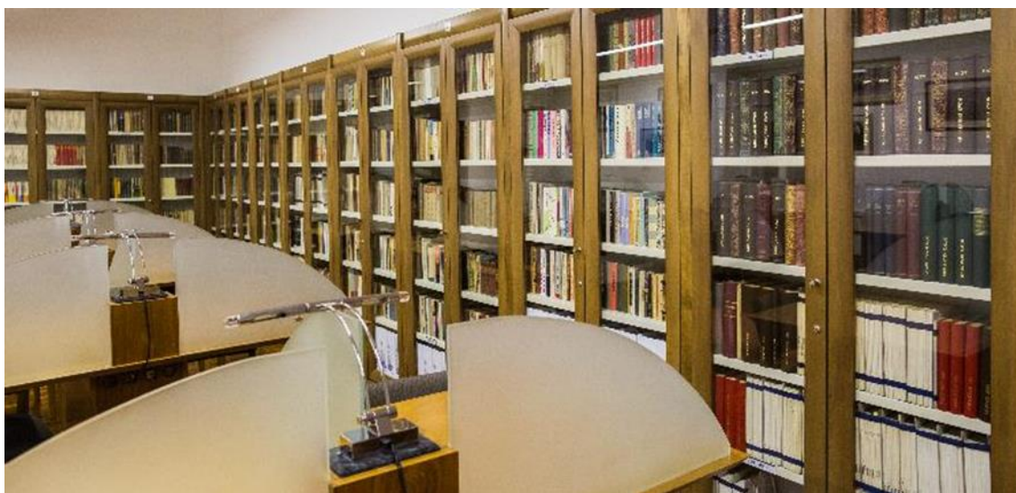
Slika 3. U Knjižnici Ivana Potrča Ptuj čuva se osobne ostavštine nekih poznatih zavičajnika. Najopsežnije su zbirke Ivana Potrča, dr. Štefke Cobelj i Ive Arharja. Središnje mjesto među ostavštinama pripada zbirci književnika Ivana Potrča, po kojem knjižnica od 1993. godine nosi ime.

U skladu sa suvremenim stručnim polazištima, zavičajne zbirke nastoje se neprestano unaprijediti, upotpuniti i što bolje prezentirati potencijalnim korisnicima. Tako su proteklih godina bili uređeni podaci za zavičajnu građu u zajedničkom katalogu, retrospektivno uneseni u njega dijelovi starijeg fonda te obrađene i predstavljene neke osobne ostavštine. Uređeni su uvjeti materijalne zaštite građe i pokrenuti brojni projekti digitalizacije, omogućivši najširu dostupnost uz istovremenu zaštitu građe u fizičkom obliku.