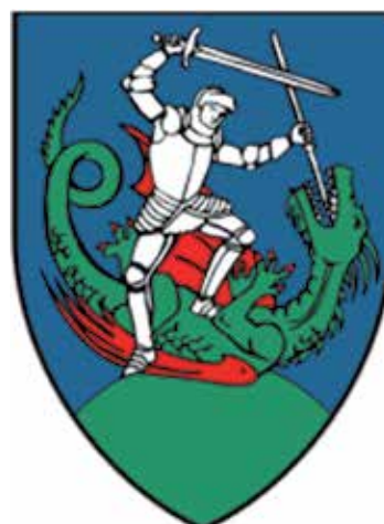
Sv. Juraj na Bregu