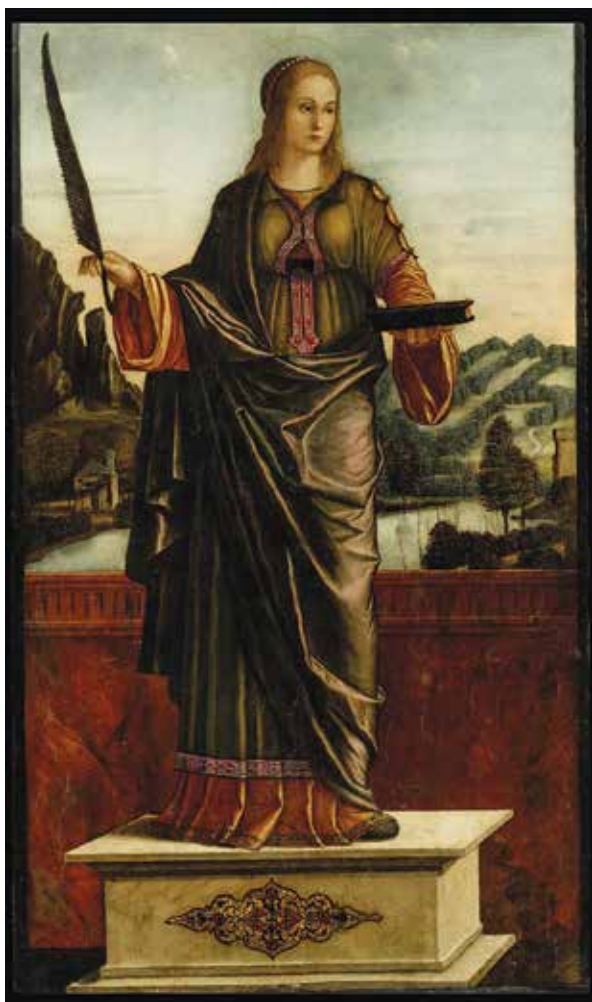
4. Sv. Stošija, detalj poliptiha