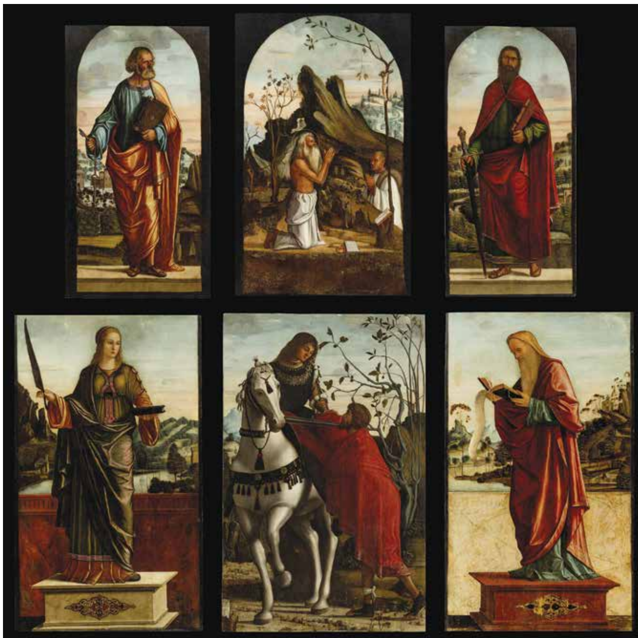
1. Vittore Carpaccio, poliptih, Zadar, Stalna izložba crkvene umjetnosti – iz katedrale sv. Stošije (fototeka Hrvatskog restauratorskog zavoda, foto: Goran Tomljenović, 2017.)

Vittore Carpaccio, polyptych, Zadar, Permanent Exhibition of Sacral Art, from the Cathedral of St Anastasia