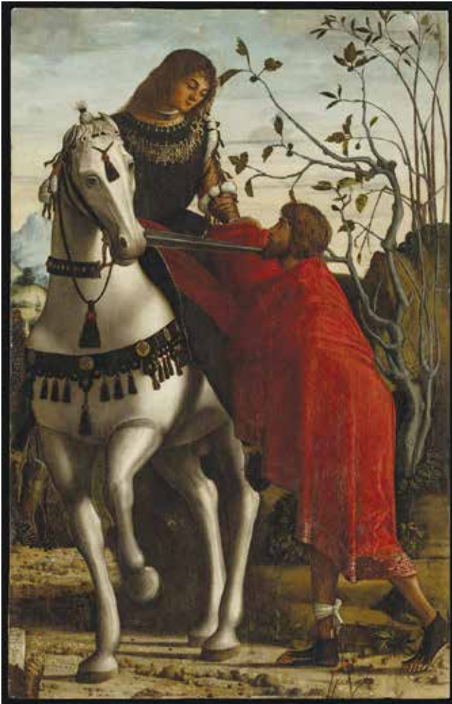
2. Sv. Martin i prosjak, detalj poliptiha

St Martin and the beggar, detail of the polyptych