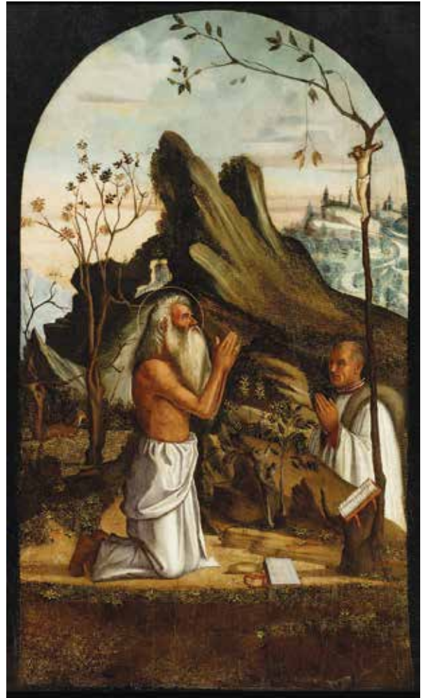
3. Sv. Jeronim i donator, detalj poliptiha

St Martin and the beggar, detail of the polyptych