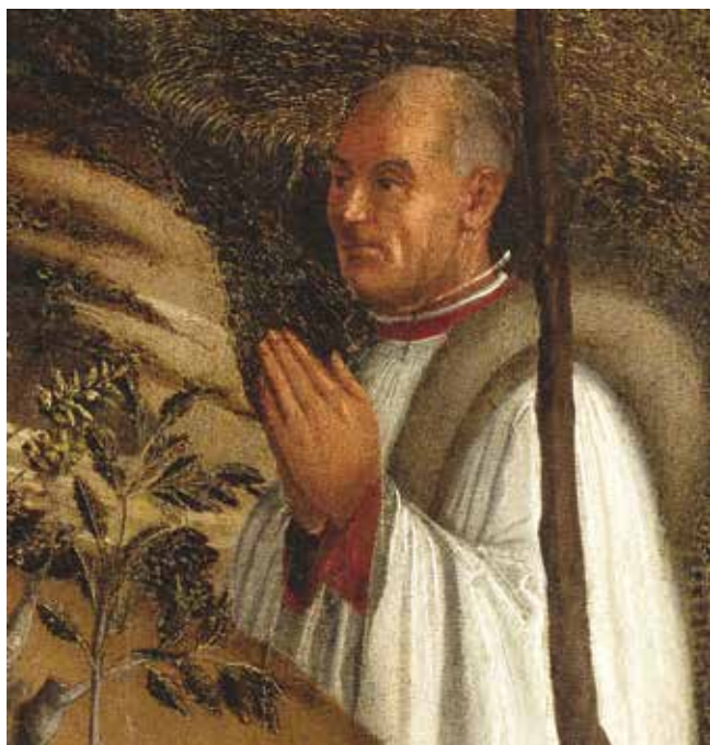
6. Portret Martina Mladošića, detalj poliptiha

Portrait of Martin Mladošić, detail of the polyptych