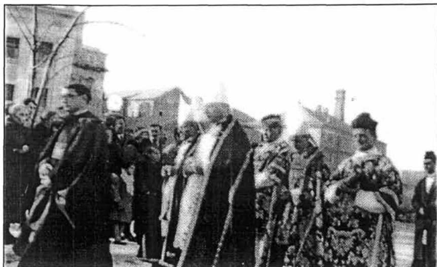
Sl. 4. Pogreb biskupa Starčevića, 27. XI. 1934. Nadbiskup Alojzije Stepinac u sredini, a do njega senjski kanonici. Ispred njih biskupi Rožman i Srebrnić (slika s izložbe)