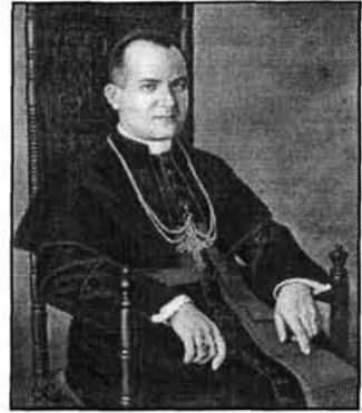
Sl. 6. Senjski biskup dr. Viktor Burić (1935. – 1983.)

blagopokojni biskup dr. Ivan Starčević uzeo ga je za svog tajnika. Za to vrijeme promoviran je na zagrebačkom sveučilištu na čast doktora bogoslovije. 6 Čim je bilo ponovno otvoreno sjemenište u Senju, bio je imenovan profesorom filozofije i crkvene povijesti. Svojom je dobrotom osvojio srca bogoslova, a svojom je učenošću širio jasnoću i vedrinu u njihovim dušama. A sada, kada je njihov omiljeli profesor imenovan vrhovnim pastirorom, oni će se kao i sav naš kler, mladenačkim oduševljenjem predati njegovu vodstvu slijedeći u svemu svoga vođu.