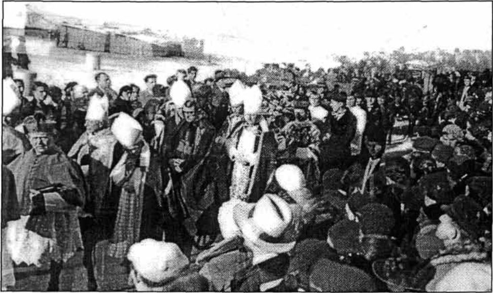
Sl. 3. Pogreb biskupa Starčevića, 27. XI. 1934. Pogrebna povorka kreće se obalom (na slici se vidi nadbiskup Alojzije Stepinac u sredini, a do njega biskup krčki Josip Srebrnić i ljubljanski Gregorije Rožman) (slika s izložbe)

sjemeništa. 1906. doktorirao je tezom De moralitate actuum humanorum ( Moralnost ljudskih čina ). 1930. bolesni Marušić imenuje ga generalnim vikarom, a nakon biskupove smrti kaptoli senjski i modruški izabraše ga kapitularnim vikarom. To je prvi put da oba kaptola biraju samo jednog vikara. Tako je Starčević u stvari već od tada upravljao biskupijama. Biskupsko imenovanje stiglo je 1. srpnja 1932. Bio je 10 godina dijabetičar, ali stanje nije izgledalo tako kritično. 24. studenoga 1934. naglo mu je pozlilo i još je isti dan preminuo. Pokopan je, po vlastitoj želji, na senjskom groblju uz crkvicu sv. Vida. Mrkopaljci su željeli da on počiva u njihovoj sredini pa je njegovo tijelo 18. rujna 1937. preneseno u Mrkopalj i pokopano u tamošnjoj crkvi Majke Božje od Sedam Žalosti.