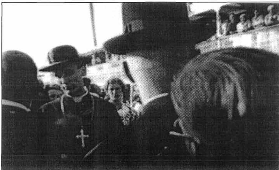
Sl. 7. Nadbiskup Stepinac među pukom na rivi 27. VII. 1935. (slika s izložbe)

U tome vidi crtu religioznosti Senja i njihovo poštivanje crkvenog autoriteta, taj znak duboke vjere veseli ga i tješi. Naš narod posvema je vezan s katoličkom crkvom, ona ga je i uvela u kolo kulturnih naroda, sačuvala mu je narodnost. Zato se on pod geslom Za Krst časni i slobodu zlatnu borio i ginuo kroz vijekove i služio zapadu na obranu. Ta vjera uvijek je bila duboka u srcu Senjana. Želi i nastojat će, da Senj bude opet ono, što je bio u svojoj slavnoj povijesti i da svima prednjači u vjeri. Moli građane da u ovim teškim vremenima ne klonu, već da uprave svoje poglede prema nebu, otkuda će doći pomoć. Neka ovako nastave i neka se kao potomci slavni Uskoka istaknu svojom vjerom i svojim nastupom čita-voj biskupiji.