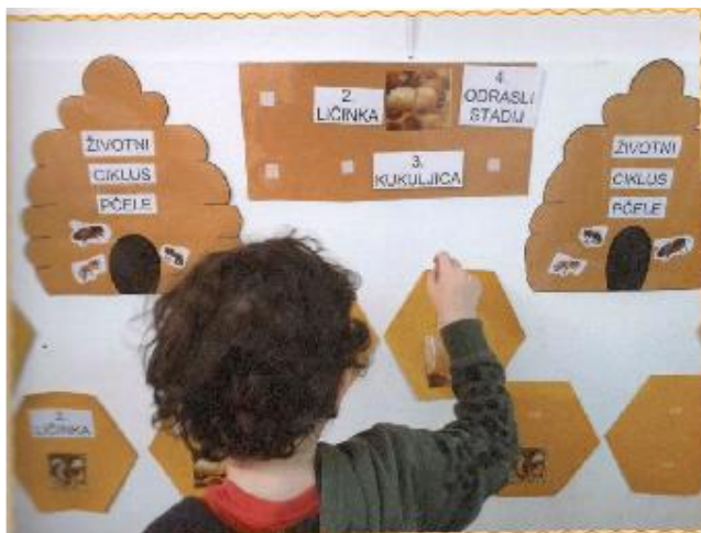
Kognitivna mapa „Životni ciklus pčele“ potiče kod djece spoznajni razvoj, razvoj vizualne percepcije, pažnju, koncentraciju, uočavanje i zaključivanje.