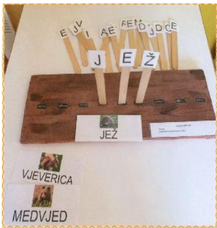
Šumska umetalka Ponudeni materijali: stradur ploča, štapići sa slovima, predložak riječi i slike životinja Prema odabranom predlošku (slike naziv životinja) djeca umeću štapiće, tj. slova u stradur ploču slažući riječ.

U poglavlju Primjeri dobre prakse u vrtiću djeca upoznaju vrste i dijelove gljiva, one jestive i nejestive, promatraju gljive pod povećalom; upoznaju šumske životinje: ježa, vjevericu, medvjeda. U narednom poglavlju Aktivnosti u vrtiću susreću se s mravima i pčelama, sa životom nad i pod morem, a poticaj za ovu aktivnost bio je odlazak i posjet pulskom Aquariumu Verudela.