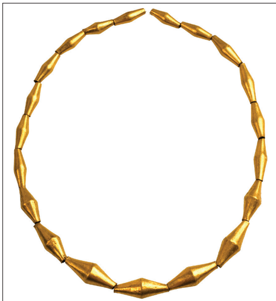
Slika 1. Zlatne bikonične perlice iz Nina-Privlake.