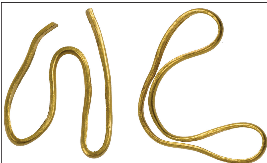
Slika 4. Zlatne žice/narukvice iz Nina-Privlake.